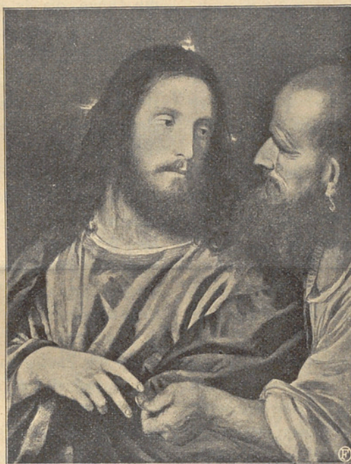
Zinsgroschen von Tizian.

In Hinsicht sowohl auf Komposition als Kolorit hätte unter den modernen Künstlern kaum einem Berufeneren die Aufgabe zu teil werden können. Im Gegensatz zu Tizian hat Ciseri ein Gruppenbild mit lebensgrossen Figuren geschaffen. Die fesselnde Komposition mit ori-