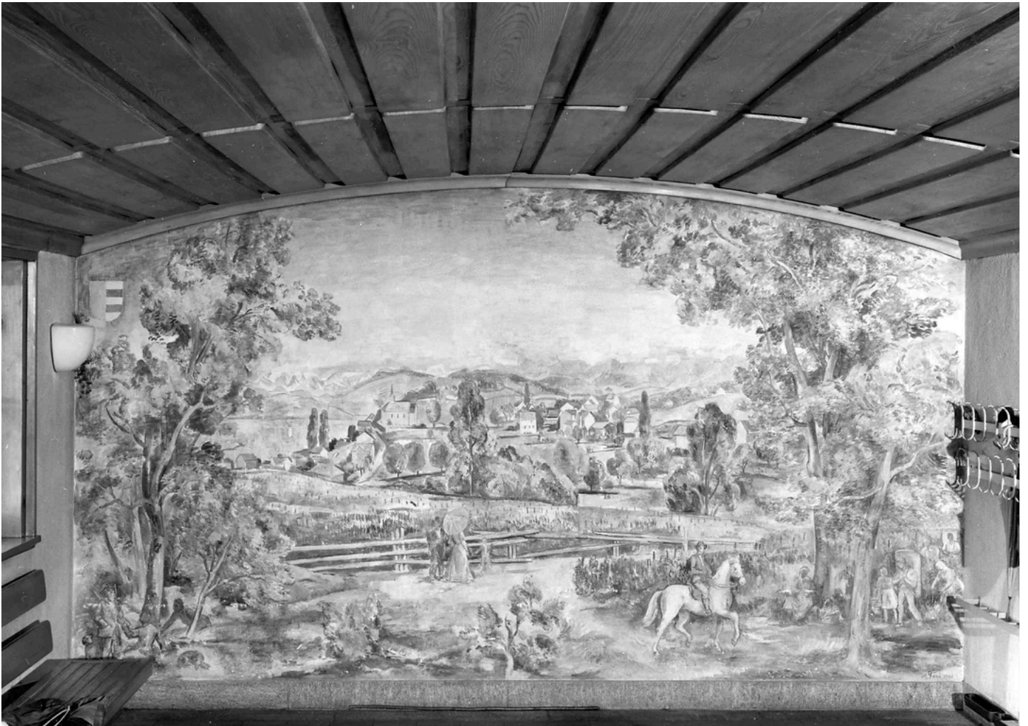
Wollishofen. Wandbild von Adolf Funk im Schulhaus Auf der Egg. 1967.

Und noch ein Ausschnitt, aktuell fotografiert (2024). Funk dürfte eine ältere Abbildung als Anregung bzw. Vorlage verwendet haben: