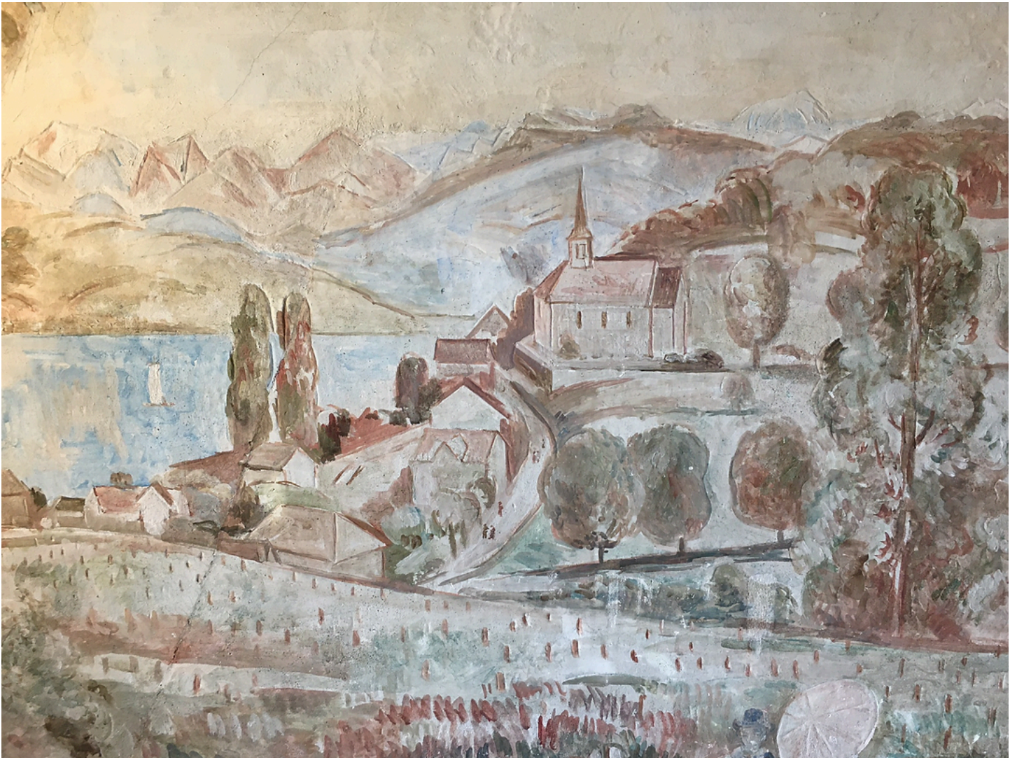
Ausschnitt Alte Kirche Wollishofen. Maler Adolf Funk. 2024.

Ich danke Marlis Streuli für die Anregung und Ursula Palmy für die Unterstützung.