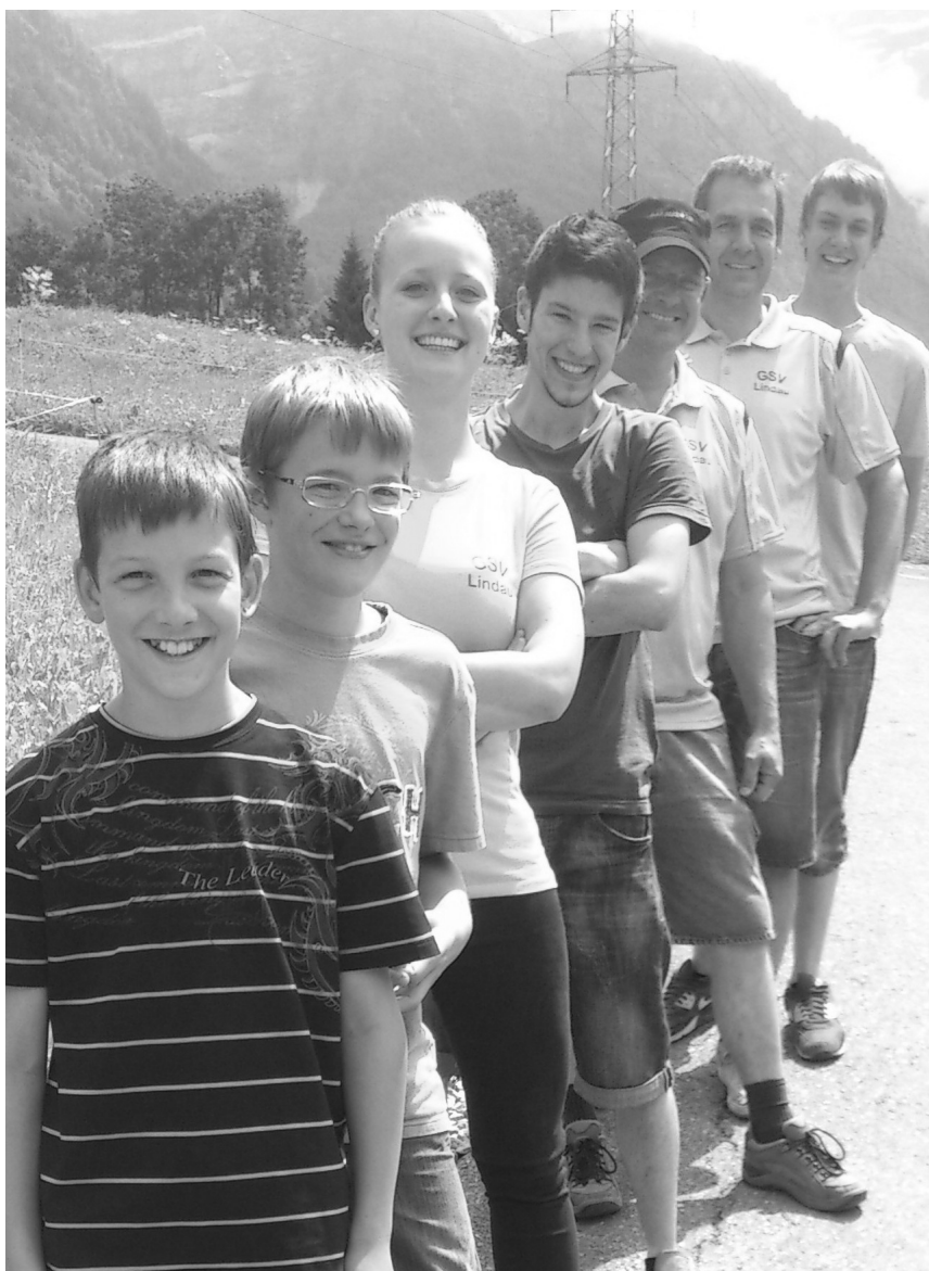
Die erfolgreichen Nachwuchsschützin und -schützen des GSV Lindau.