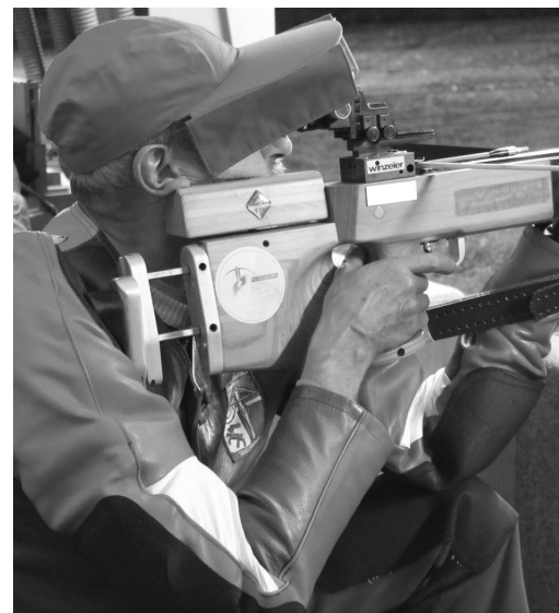
Da ist volle Konzentration gefordert.

Mit den zwei Heimrunden, welche in den vergangenen Monaten geschossen werden mussten, hat sich die Gruppe der AS Tagelswangen auf Rang 13 platziert und ist somit für den Kant. Final in Turbenthal qualifiziert. Die besten 15 Gruppen des Kantons traten gegeneinander an. Dunkelheit, Sonne, Wind und Regen machten den Schützen/Innen zu schaffen.