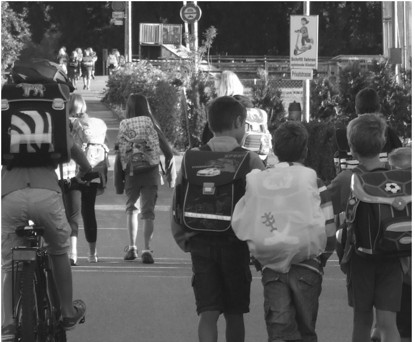
Viele Schülerinnen und Schüler aus Grafstal nehmen den Schulweg wieder zu Fuss in Angriff.