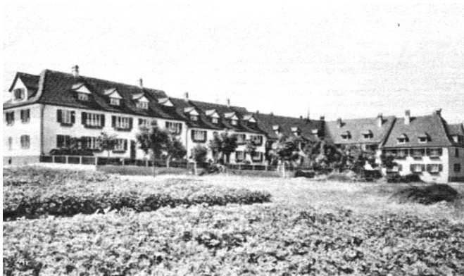
Diese Überbauung steht seit 100 Jahren fast unverändert an der Koloniestrasse in Grafstal.

Das Personal in der Maggifabrik umfasste im Jahre 1912 700 Personen. Sechs Jahre zuvor waren es noch deren 300 gewesen. Deshalb waren die Wohnungen in der Gegend rar und gesucht. Die alten Bauernhäuser mussten durch den Betrieb der Gutswirtschaft und deren Arbeiter belegt werden. Deshalb befasste sich die Generaldirektion intensiv mit dem