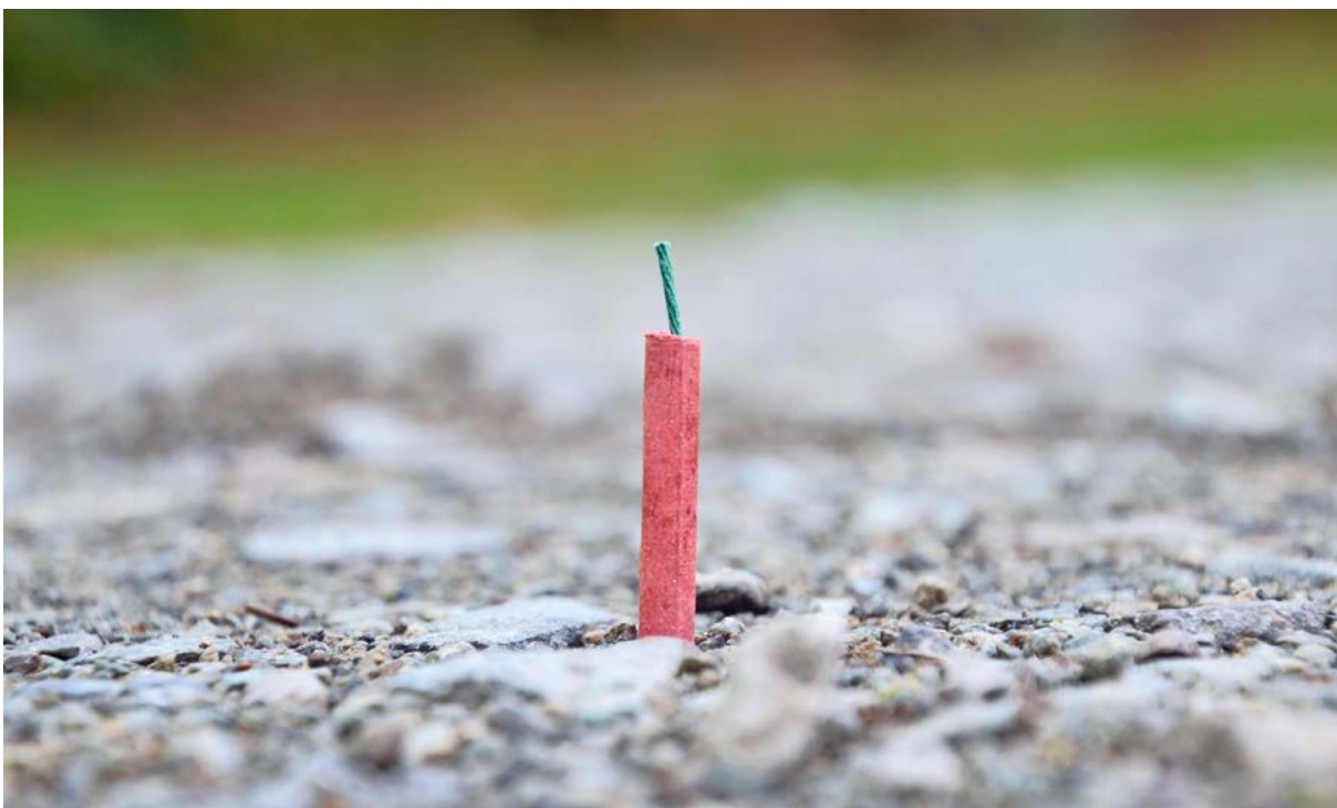
Einzelinitiative fordert Verbot von lärmendem Feuerwerk

Negative Auswirkungen auf Mensch, Tier und Umwelt versus Brauchtum und Tradition: Am 8. Dezember werden Maurerinnen und Maurer an der Gemeindeversammlung darüber befinden, ob lärmendes Feuerwerk in Maur künftig verboten werden soll.