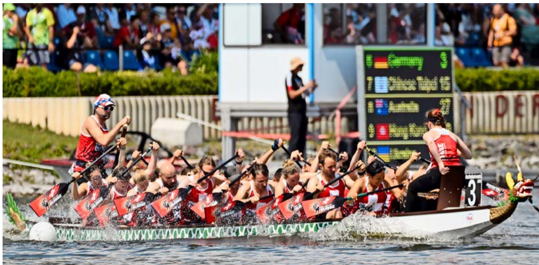
Mitte Juli fand auf dem Beetzsee in Brandenburg die Drachenboot-WM statt. Die Schweizer Nationalmannschaft, darunter 20 Dragons, erkämpfte sich Top-Ten-Ergebnisse.

Ein Projekt liegt den Greifensee Dragons besonders am Herzen: das Pink Paddling. Eine reine Frauengruppe, bestehend aus Frauen, die an Krebs erkrankt sind oder waren. «Die Idee dazu entstand bei einem Drachenboot-Rennen in Hannover, wo ein «Pink Cup» ausgetragen wurde», erzählt Züger. «Unsere Vizepräsidentin hat dann das Projekt mit einer Kollegin für unseren Verein ins Leben gerufen.» Ein Team von bis zu 20 Frauen trainiert hier gemeinsam in einem grossen Drachenboot. Für dieses En-