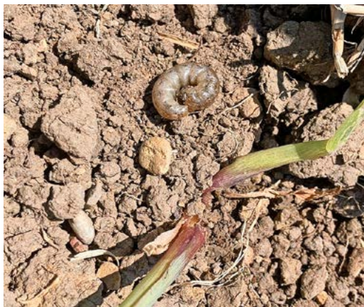
Bei Berührung rollen sich die Erdräupen c-förmig ein.

Erdräupen machen Landwirten das Leben schwer. Dieses Jahr traten die gefrässigen Larven in Maur und Umgebung in Massen auf und fressen bei einzelnen Landwirten teilweise bis zwei Drittel der Maisernte weg.