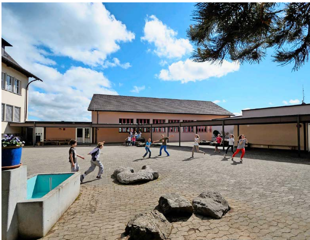
Die Schulpflege leitet und beaufsichtigt die Schule und vertritt sie gegen aussen.