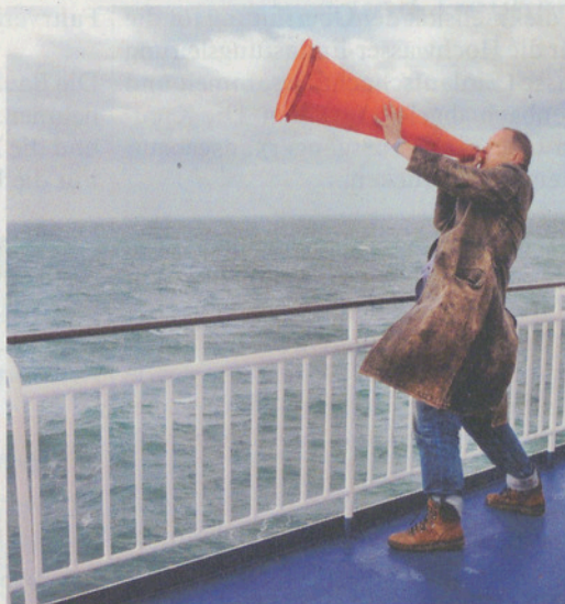
Was, wenn alle Musik verschwunden wäre?

Der Film begleitet Drummond, wie er immer neue Stimmen findet für seinen Chor: auf offenem Feld oder in einer Fabrik, im Schulzimmer oder in einem Pub. Es ist eine Reise an den Nullpunkt der Musik. Damit wir sie in aller Unschuld nochmals neu erfinden. Gemeinsam, in diesem Moment.