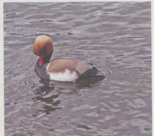
Ein Einblick in das Leben der Vögel.