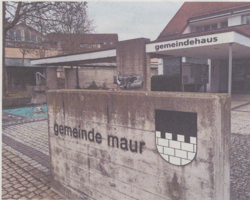
Die Maurmer Behörden äusserten sich bisher nur zurückhaltend zum Fall.