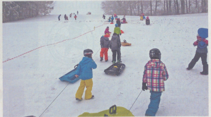
Und immer wieder den Hang hinauf... Schlitteln muss man sich verdienen.