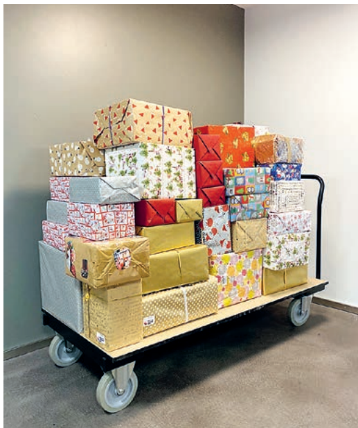
Päckli, die Bedürftige erfreuen.