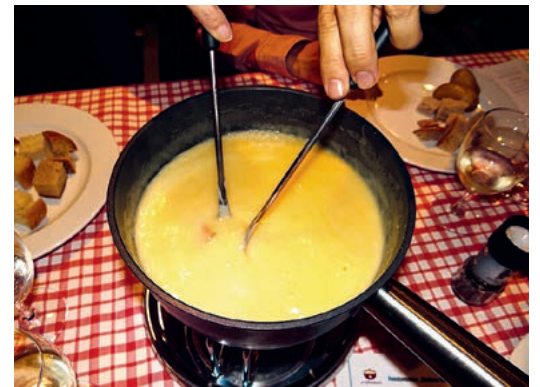
Beliebt war auch das Fondue auf dem kleinen Weinschiff.

Auf die Frage, wie es nun für seinen Anlass weitergehe, meinte Markus Gaab ein bisschen wehmütig: «Ich hätte es sehr gerne erneut organisiert, aber aus verschiedenen Gründen findet das kleine Weinschiff vorläufig nicht mehr statt.»