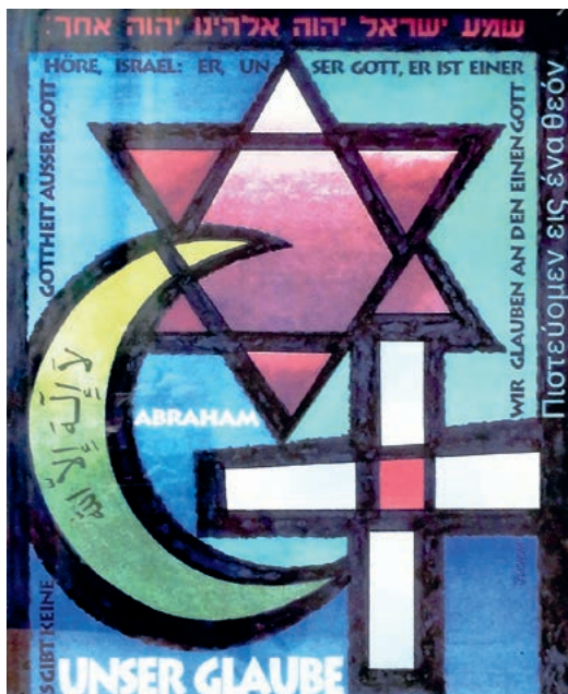
Drei Symbole, drei Religionen.