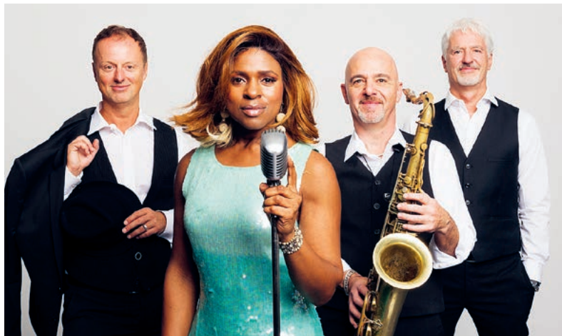
Stimmungsvoller Abend mit Jazz, Swing und Soul.