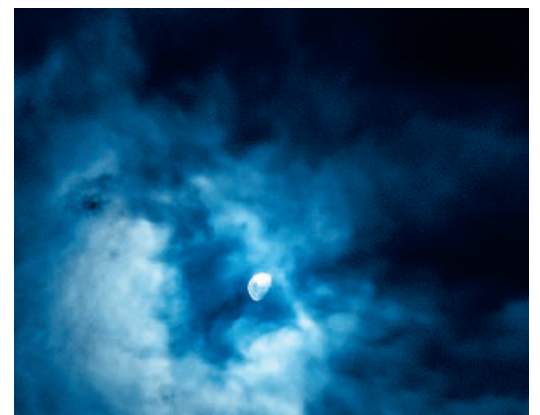
Dramatischer Nachthimmel.

Am letzten Sonntag lud Pfarrerin Pascale Rondez zu einem Nachtgottesdienst in die Kirche Maur. Unter dem Titel «Träumen in der Kirche» wurden Wolkenbilder an die Wand projiziert, die der Berner Jurist und Fotograf Wolfgang Straub vom Himmel über Bern in einer Vollmondnacht geschossen hat. Dazu hörte man ein Musikarrangement, dargeboten an Orgel und Klavier von Alex Stukkalenko, das unter anderem ein Stück aus den für einen Schlaflosen komponierten «Goldberg-Variationen» von Bach enthielt.