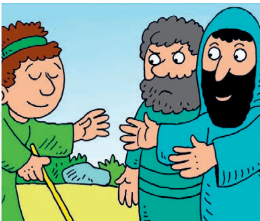
Der blinde Bartimäus