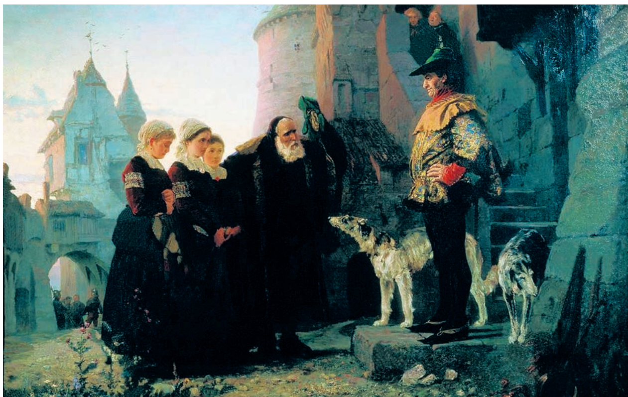
So stellte man sich das mittelalterliche «Herrenrecht» im 19. Jahrhundert vor: Das Gemälde (1874) vom russischen Maler Wassili Dmitrijewitsch Polenow zeigt, wie ein älterer Mann seine Töchter zum Feudalherrn bringt.