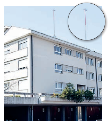
Die Antenne soll aufs Dach kommen.

113 in Ebmatingen) eine neue Mobilfunkanlage erstellt werde, damit – so die Swisscom – «die Kundinnen und Kunden auch in Zukunft ohne Beeinträchtigungen sowohl in Geschwindigkeit und Qualität im Mobilfunknetz Daten- und Telefoniedienste in Anspruch nehmen können». Das Baugesuch sei «für die Frequenzen aller Technologien» ausgelegt – also vermutlich auch für den neuen 5G-Standard.