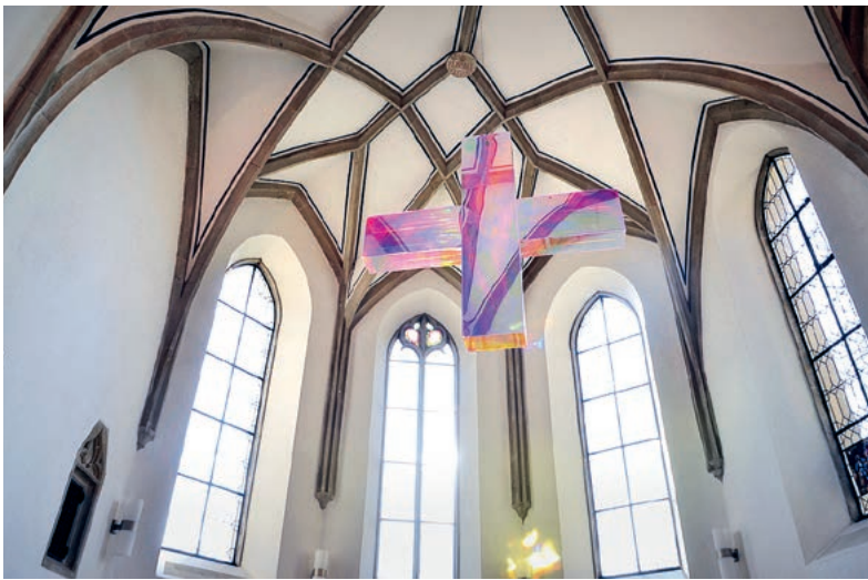
Lichtspiegelungen Chorraum Kirche Maur.