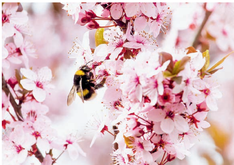
Wenn die Natur im Frühling neu erwacht, summten und brummen die Insekten wieder.

Fiona hatte ein grosses Herz für alles, was krecht und fleucht, ja