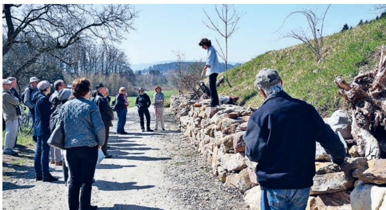
Trockenmauern sind Lebens- und Schutzräume für viele Tierarten.