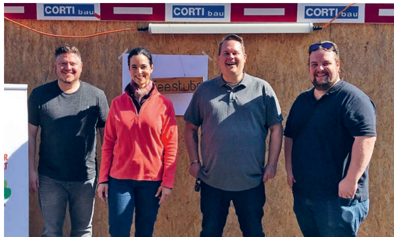
Gute Laune bei den beiden Veranstaltungs-Teams (links: Team der Kinderbörse, rechts: Die SVP-Organisatoren der Velobörse).