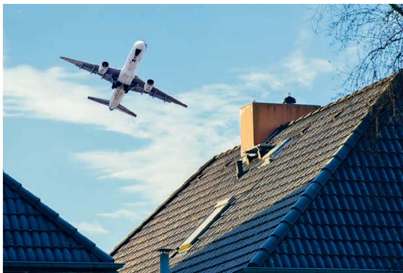
Maur gehört auch zu den von Fluglärm belasteten Gemeinden.

Viele Themen kamen an diesem Abend zur Sprache: die wirtschaftlichen Interessen natürlich, weil der Flughafen Zürich auch Arbeitgeber ist und für Wachstum in der Region sorgt; die internationale Bedeutung des Flughafens Kloten, der inzwischen von verschiedenen Fluggesellschaften als sogenannter Hub genutzt wird, also als Dreh- und Umsteigekreuz für Stop-over-Flüge. Und dabei auch die Frage, ob die Swiss