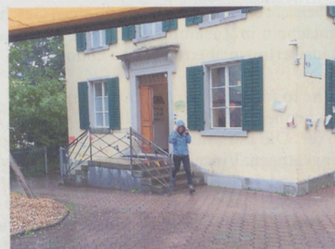
Schnell über den Platz und unters Vordach!

Am vergangenen Samstag stand alles bereit: Ein Buffet mit Kuchen und anderen Häppchen, ein Wurstgrill, ein riesengrosses Trampolin mit Sprunggurten, ein buntes Bölelibad, und an einem Stand durften sich Kinder schminken lassen. Toll, was das Chinderhuus alles auf die Beine gestellt hatte! Aber es regnete Bindfäden und donnerte grollend, sodass alle eilends unter den Vordächern Schutz suchen mussten. Umso bemerkenswerter, fanden bei dem Hudelwetter zunehmend Besucher den Weg zum Chinderhuus: Kleinkinder, allesamt in Gummistiefel und farbige Regenschütze gehüllt, und deren Eltern, welche die Möglichkeit zum Austausch untereinander nutzten. Gute Launen