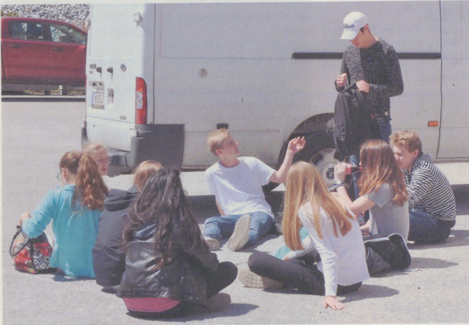
Endlich sonnig! Pause in Bonaduz.