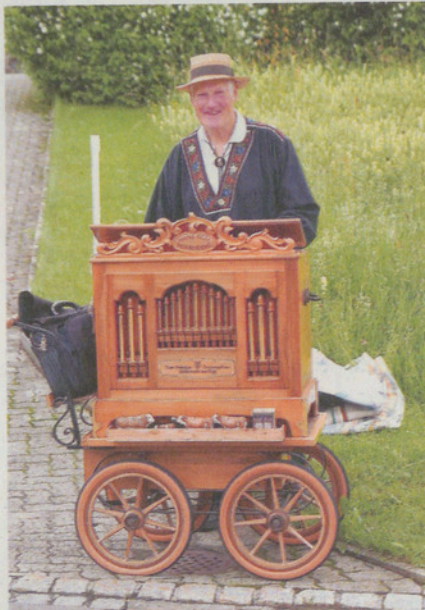
Auch in diesem Jahr verbreitete die Drehorgel gute Stimmung am Schlachthüüsl-Fäscht. Zum Verkauf standen feine Fleischspezialitäten.

Nebst den traditionellen Köstlichkeiten konnte man sich auch mit feinsten Wurst- und Esswa-