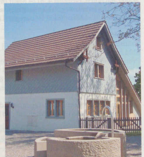
Der bisherige Standort der Gigampfi in Binz.