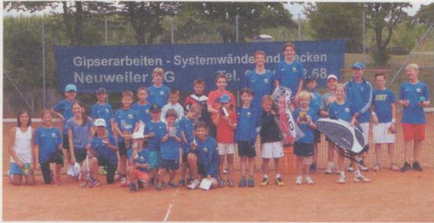
Die Teilnehmer des Juniorencamps 2015.