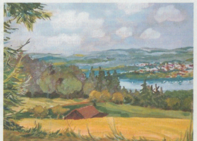
Trudie v. Maaren Ansicht von Maur, gemalt von Trudie v. Maaren.