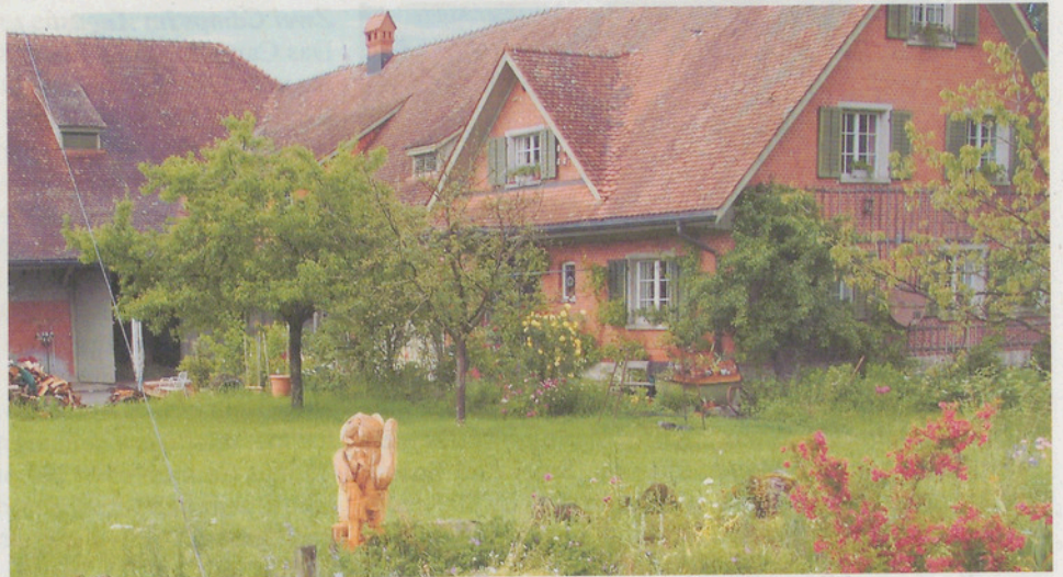
Der Kindergottesdienst findet auf dem prächtigen Hof der Familie Walser statt.