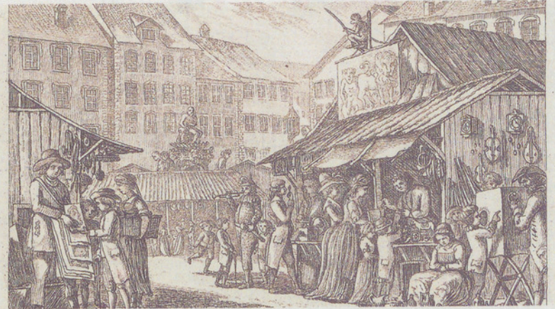
Der Jahrmarkt auf dem Münsterhof in Zürich: Auf der linken Seite ein Druckgraphikverkäufer und rechts der «Guckkästner».

David Herrliberger, der als letzter Gerichtsherr bis 1775 die Burg Maur bewohnte und einer der wichtigsten Zürcher Buchverleger des 18. Jahrhunderts war, schuf selbst berühmte Bilder, etwa die Serien der Zürcher oder der Basler Ausrufer – womit auch der Bezug der Ausstellung zur Burg und zur permanenten Ausstellung hergestellt wäre.