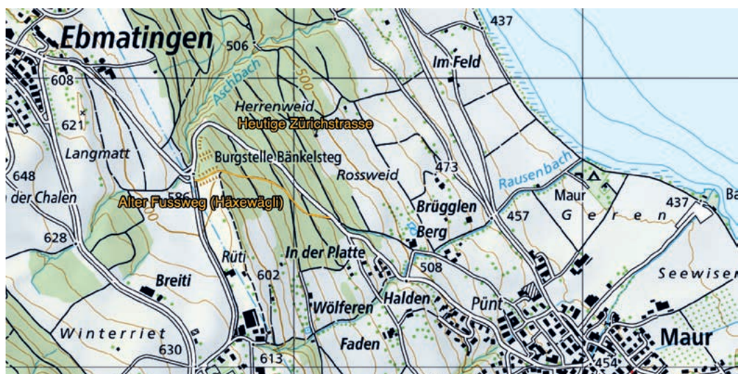
Die frühere Route von Maur nach Ebmatungen führte durch den Wald. Das Häxewägli gibt es noch als Waldweg.

Wie Bachhofen ausführt, hätten früher die Männer noch zu Fuss nach Zürich laufen müssen, mit schweren Waren auf dem Rücken wie etwa Most, Schnaps oder in Heimarbeit erstellten Weberzeugnissen, um sie in der Stadt zu ver-