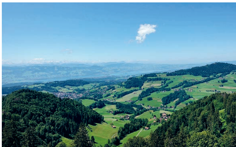
Mittagsrast bei prächtiger Aussicht.