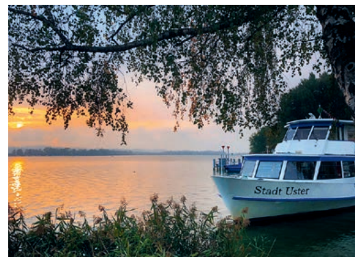
Den Sonnenuntergang am Wasser geniessen.