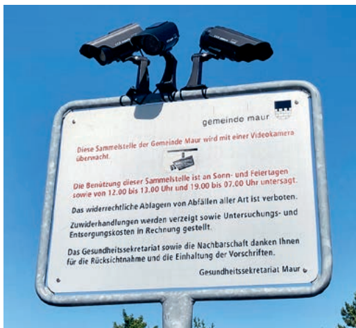
Videoüberwachung der Gemeinde.

Antwort: Die Aufnahmen werden stichprobenartig kontrolliert, die Daten gemäss einem Videoreglement vom September 2010, das man online auf der Homepage der Gemeinde einsehen kann, aufbewahrt, behandelt, verwertet und gelöscht. In diesem Reglement steht zum Beispiel, dass ausschliesslich Polizeisekretär oder Polizeisekretärin oder deren Stellvertreter Zugriff auf die Aufnahmen haben. Die Gemeinde selbst wird nur hinzugezogen, wenn sie zur Identifikation etwaiger Straftäter nötig ist. Gelöscht wird nach spätestens 168 Stunden seit Aufzeichnung. www.maur.ch/documents/Vidoreglement.pdf