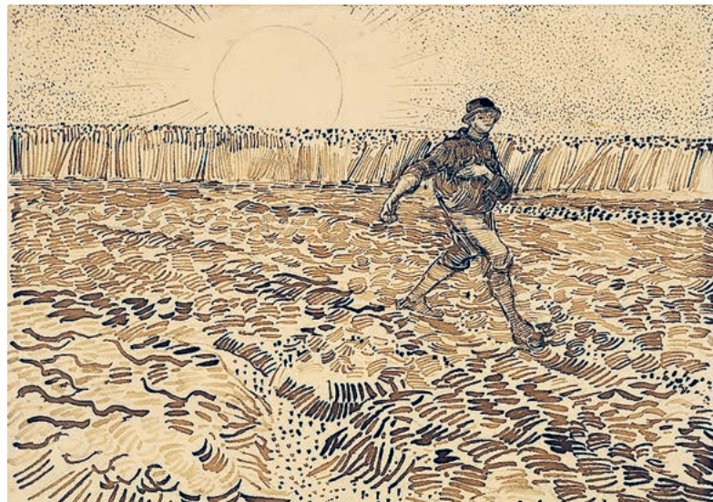
Vincent van Gogh, «Der Sämann» (August 1888)

Und ist es nicht auch so, dass wir selbst dies bei unserem Aussäen im Kleinen und im Grossen auch tun?