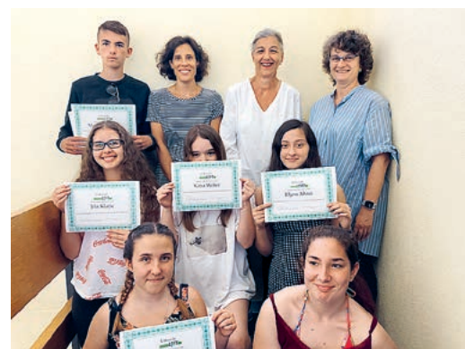
Das LIFT-Projektteam und Diplomanden.

Die Schifffahrts-Genossenschaft Greifensee SGG hat den Steg-3-Bar-Betrieb wieder aufgenommen. Jeden ersten Donnerstag im Monat kann man abends auf der «Stadt Uster» sitzen (sie bleibt am Steg) und bei Drinks und Snacks den Sonnenuntergang beobachten. Natürlich hat die SGG ein Schutzkonzept ausgearbeitet, man kann es online anschauen, dort findet man auch die näheren Infos zum Barbetrieb. sgg-greifensee.ch