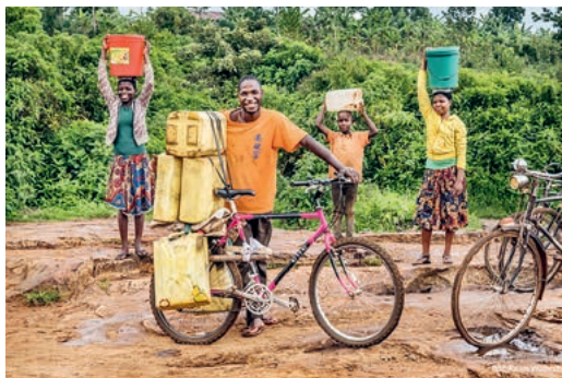
Ein Velo schafft neue Perspektiven.

Die Velos werden anschliessend in einer sozialen Einrichtung für den Export aufbereitet. Wenn Sie ein Velo haben, dieses aber nicht auf die Looren transportieren können, melden Sie sich