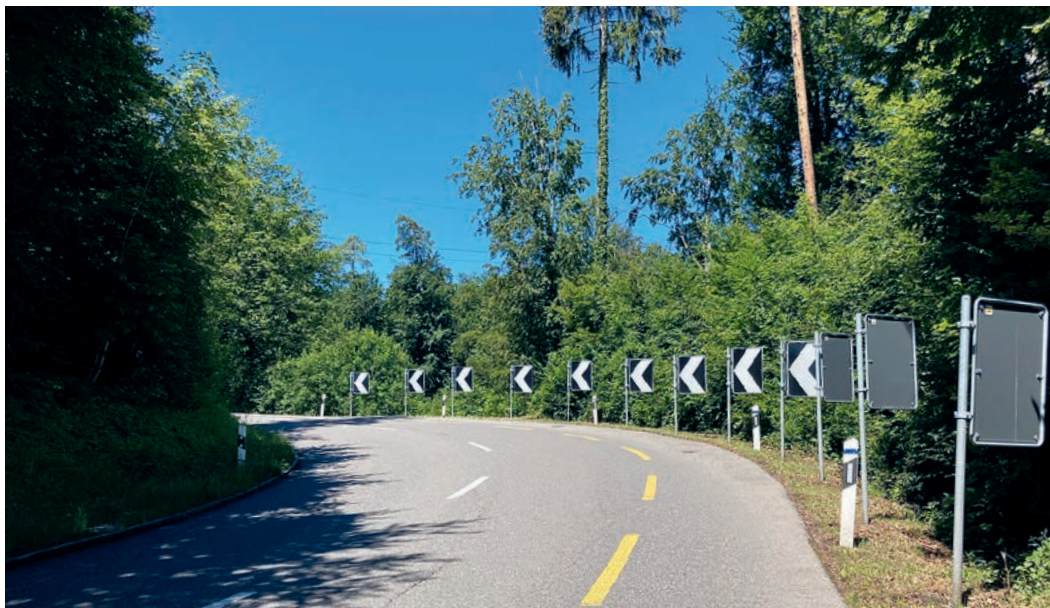
Die «Horrorcurve» beim Benkelsteg. Weiter hinten geht es steil ins Tobel runter.

Ein «Steg» ist der Benkelsteg deshalb, weil sich hier einst ein Brücklein über den (heute an dieser Stelle unterirdisch verlaufenden) Aschbach befand. Als Maur und Ebmatungen noch eigenständige Zivilgemeinden waren, markierte der Steg wohl so etwas wie die Grenze beider Ortschaften – sowohl für Maurmer wie auch für Ebmatinger ein Stück «Vorort» und «Ausserhalb»; das Brücklein der Übergangsort, wo man das