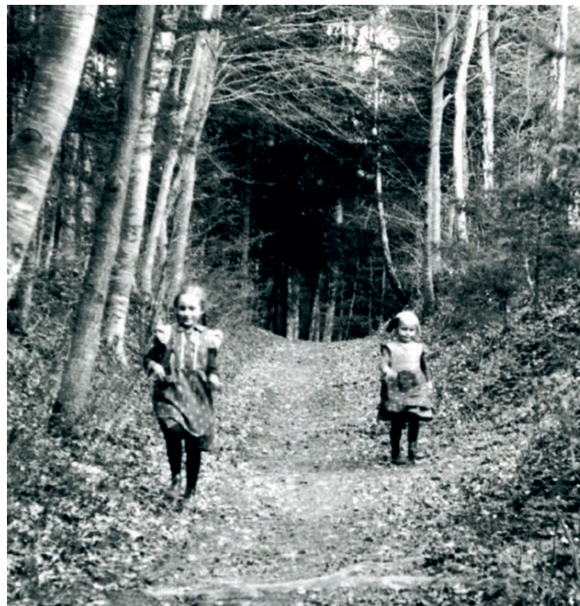
Zwei Mädchen in einer Aufnahme von 1937, wie sie beim Benkelsteg auf dem alten «Häxewägli» laufen. Hier trieb das Benkelfräuli sein Unwesen.

Das Frauchen selbst sehe man gewöhnlich nicht; es sei nur oft, wie wenn man auf einmal an eine Wand käme und nicht mehr weiterkönnte, nur einen Moment, dann verschwinde es wieder. So habe es ein Mann von Maur erlebt – er nannte mir den Namen. Beim Heimfahren von Zürich nachts 11 Uhr mit dem Velo konnte er dort auf einmal nicht mehr weiter, so dass er absteigen musste. Auch das