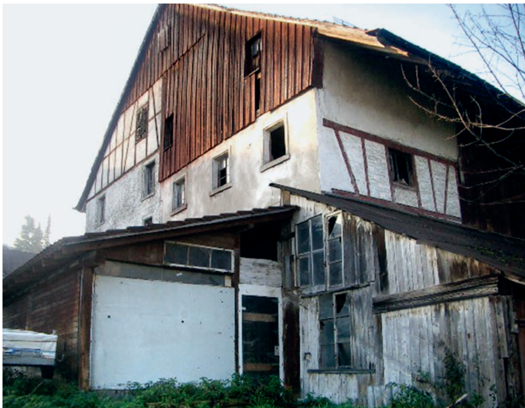
Das mittlerweile abgerissene Haus in Ebmingen. Hier soll das Benkelfräuli gewohnt haben.

Eines Abends also habe die Frau des eines Bauernmetzgers aus Maur recht lange gewartet auf die Rückkehr ihres Mannes. Sie habe Angst gehabt und sich aufgemacht, um ihn zu suchen. Sie lief ihm entgegen und war gerade auf Höhe Benkelsteg, mitten im Wald. In diesem Moment sei ein anderer Bauernmetzger ebenfalls auf dem Heimweg von der Arbeit gewesen. Er kam durch den Wald gelaufen – singend und mit sich selbst redend. Die rabiate Frau, in der Annahme es handle sich um ihren Mann, nahm wütend ein Stück Holz und schlug dem ihr direkt Entgegenstürzenden eins runter. Dann erschrak sie, weil sie realisierte, dass es nicht der eigene Mann war.