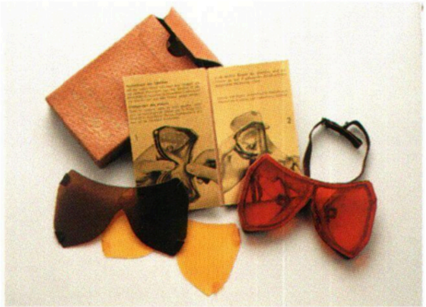
Abb. 5 Schneebrille mit auswechselbaren Gläsern aus Zelluloid. Meiss Sport Zürich, 1920–1940. 7 × 12 cm.

Aus dem Artikel von Christof Kübler und Christina Sonderegger zur Design-Sammlung des Landesmuseums (20. Jahrhundert).