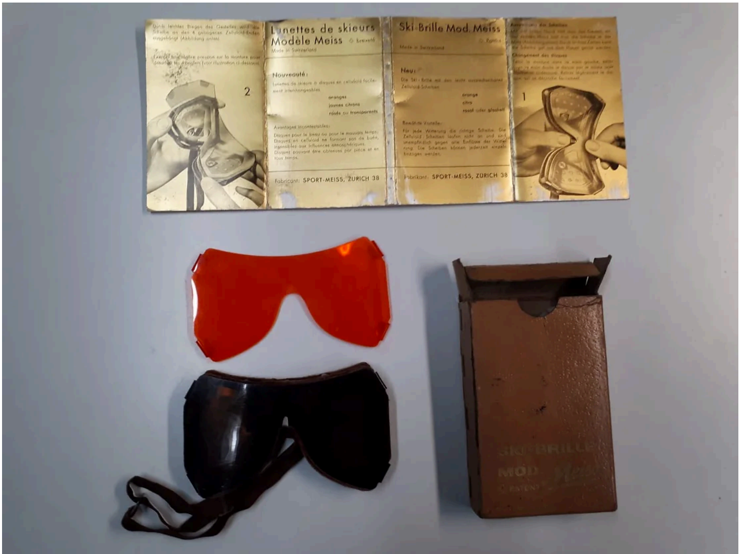
Skibrille von «Sport Meiss Zürich 38».