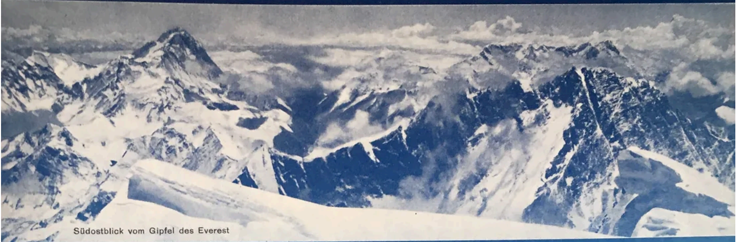
Südostblick vom Gipfel des Everest