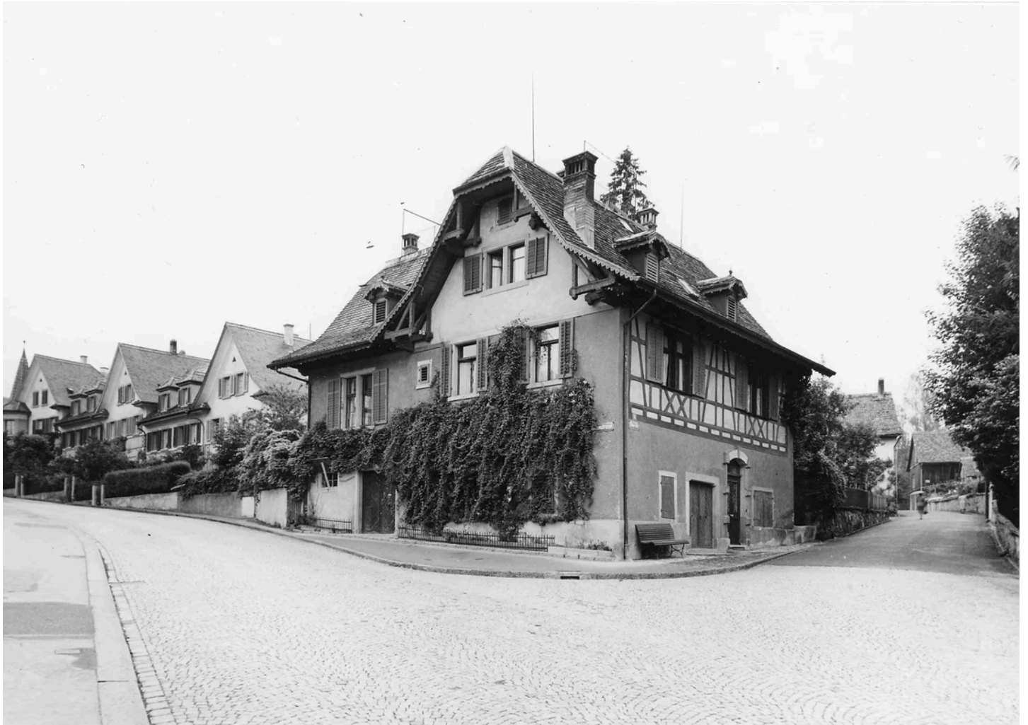
SPORT MEISS, Domizil Rainstrasse 5 an der Ecke zur Butzenstrasse. 1954.

produzierten im 1. Stock zeitweise über 5 Näherinnen vor allem Rucksäcke. Später konnte Meiss das Haus kaufen und betrieb im 1. Stock eine regelrechte Fabrik.