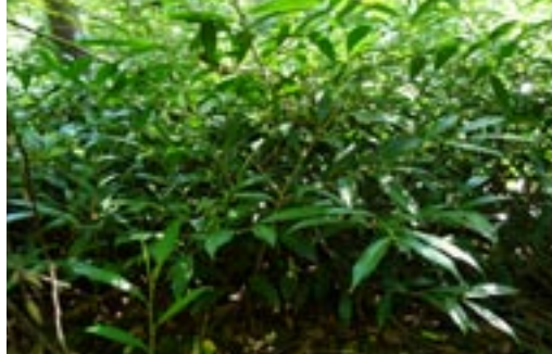
Verwilderter Kirschlorbeer in einem Waldstück bei Illnau. Unter dem Kirschlorbeer wächst praktisch nichts mehr.

Eigentlich erstaunlich, dass wir ein so giftiges Gewächs aus Westasien und Südosteuropa als Zierpflanze in unser Land geholt haben. Aber der Kirschlorbeer erfüllt gleich mehrere Bedingungen, die viele Gartenbesitzer/innen an Heckenpflanzen stellen: Er