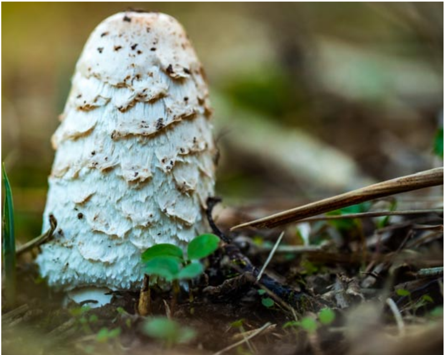
Die herbstlichen Farben und Gerüche läuten die kältere Jahreszeit ein.