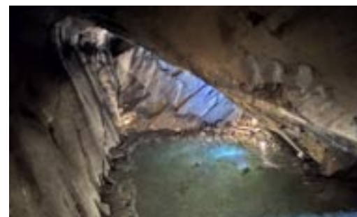
Spannende Führung durch die Höhle.

Als wir in die Höhle reingingen, mussten wir erst einmal alle unsere Jacken anziehen, denn in dieser Höhle war es so kalt, dass wir es niemals ohne überlebt hätten. Wir mussten auch Minenhelme tragen. Nach der Führung, die wirklich sehr interessant war,