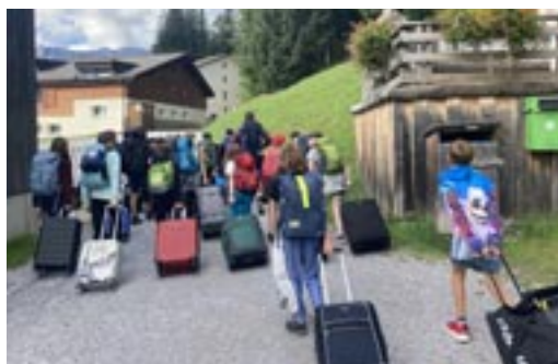
Ankunft in Elm

Wir trafen uns um 7.30 Uhr am Bahnhof Effretikon. Wir waren nervös und freuten uns sehr! Im Zug hatten wir Zeit zum Gamen, Reden und Essen. Drei Mal mussten wir umsteigen. Während der Fahrt im Zug bemerkte ich, dass ich in meinem Rucksack noch ein