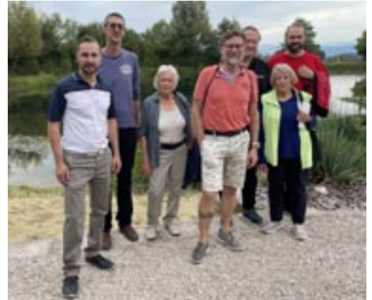
Dieser charmante Teich dient als Wasserreservoir

Manche Zonen müssen von Zeit zu Zeit erneuert werden. Dabei wird das Erdreich abgetragen, es landet aber nicht in der Abfuhr, sondern wird an Ort und Stelle recycelt. Auch mit der Ressource Wasser wird schonend umgegangen. Auf dem Golfplatz hat es einen Teich, der von Dachwasser und aus dem Drainagenetz gespeist wird, um so den Rasen in seinem leuchtenden Grün zu erhalten. Dieser Teich und seine Umgebung sind einladend und naturnah gestaltet. Schon manche über das öffentliche Golfplatzrestaurant buchbaren Anlässe und Familienfeiern haben dort stattgefunden. Ökologisch aufgewertet wird die Anlage durch verschiedene nicht begehbare Biotope, wo so manche der kleinen weissen Bälle verloren gehen. Auch dank einer grossflächigen Photovoltaik-