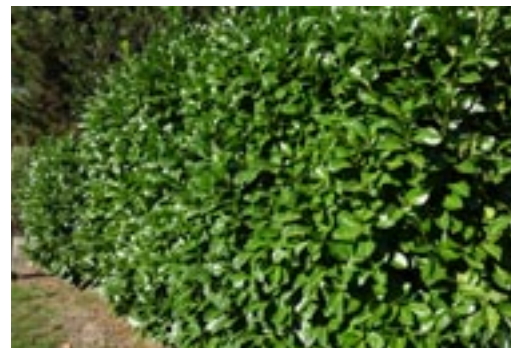
Eine Wand aus Kirschlorbeer, grün und blickdicht.

Auch zum Würzen eignen sich die Blätter des Kirschlorbeers nicht – sie sind nämlich giftig. Sie enthalten Blausäure, die unter anderem dafür sorgt, dass die Blätter nur sehr schwer verrotten. Auch die Früchte sind giftig, wenn sie zerkaut werden. Zerkauter Samen setzen im Magen ebenfalls Blausäure frei, was