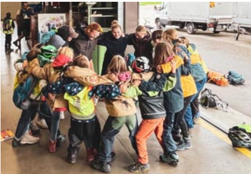
Als Abschluss der Pfadi Aktivität machten wir ein Tiaiai.

aus, jedoch gibt es nur schlechte Kleidung und kein schlechtes Wetter für uns Pfadis. Gemeinsam mit einigen Eltern und freiwilligen Helfern, Anwohnern aus der Gemeinde Lindau konnte auch dieses Jahr wieder eine grosse Menge an Abfall gesammelt werden. In der heutigen Zeit muss man leider zugeben, ist es gang und gäbe, dass einige ihren Abfall herumliegen