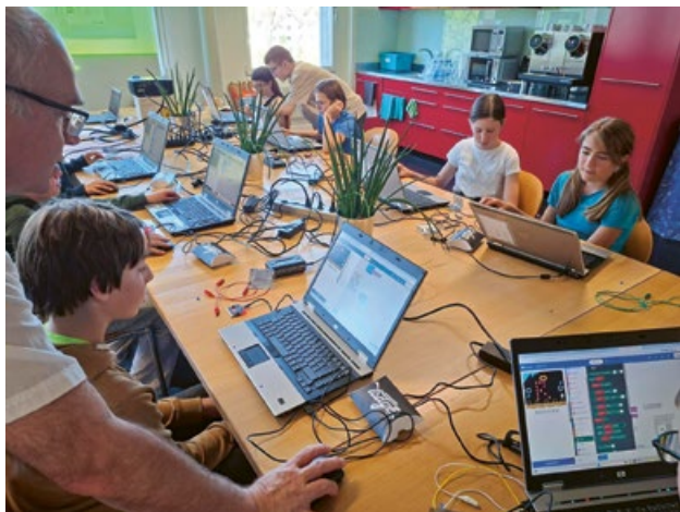
Unter fachkundiger Leitung fertigten Kinder aus der Region bei der Lasercut AG in Bäretswil ihren ersten Seifenblasen-Automaten.