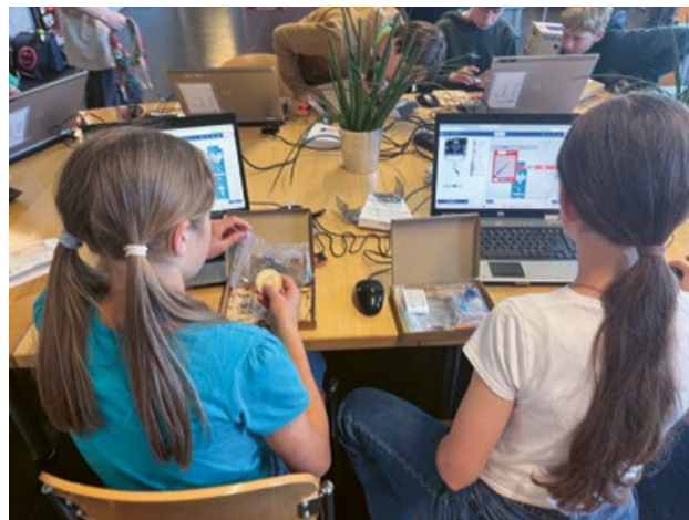
Tüfteln macht Spass, baut Rollenklischees ab und stärkt langfristig den Fachkräftenachwuchs im Zürcher Oberland.