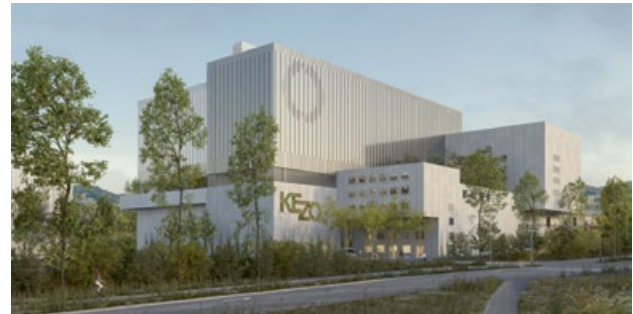
Visualisierung: Penzel Valier AG & Maurus Schifferli Landschaftsarchitekt AG/maars