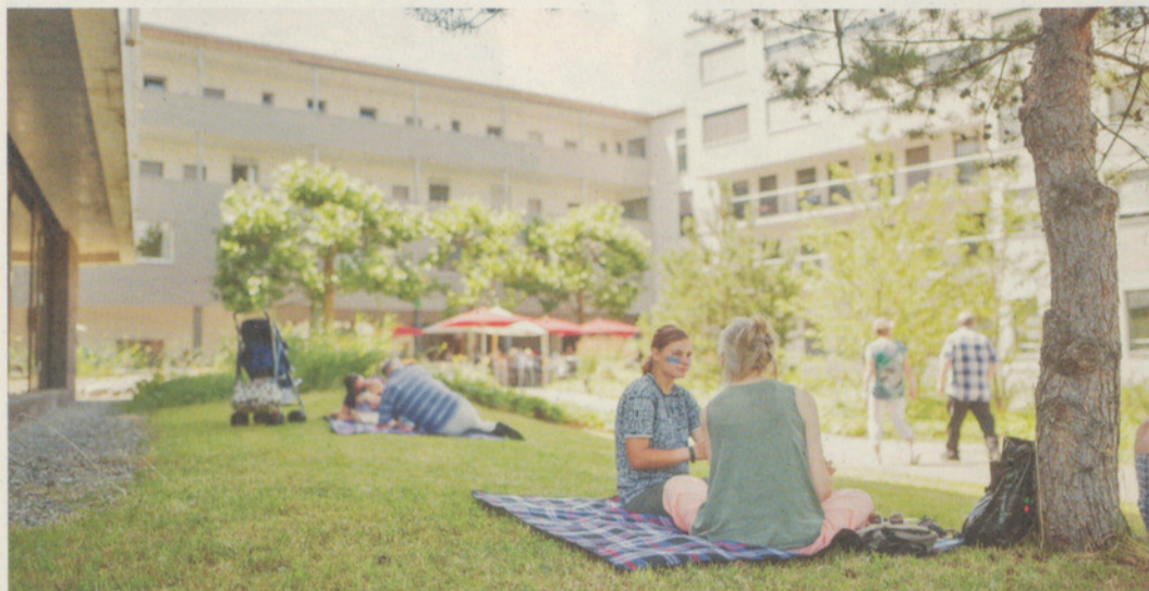
Der Zollinger Park beim letztjährigen Sommerfest.