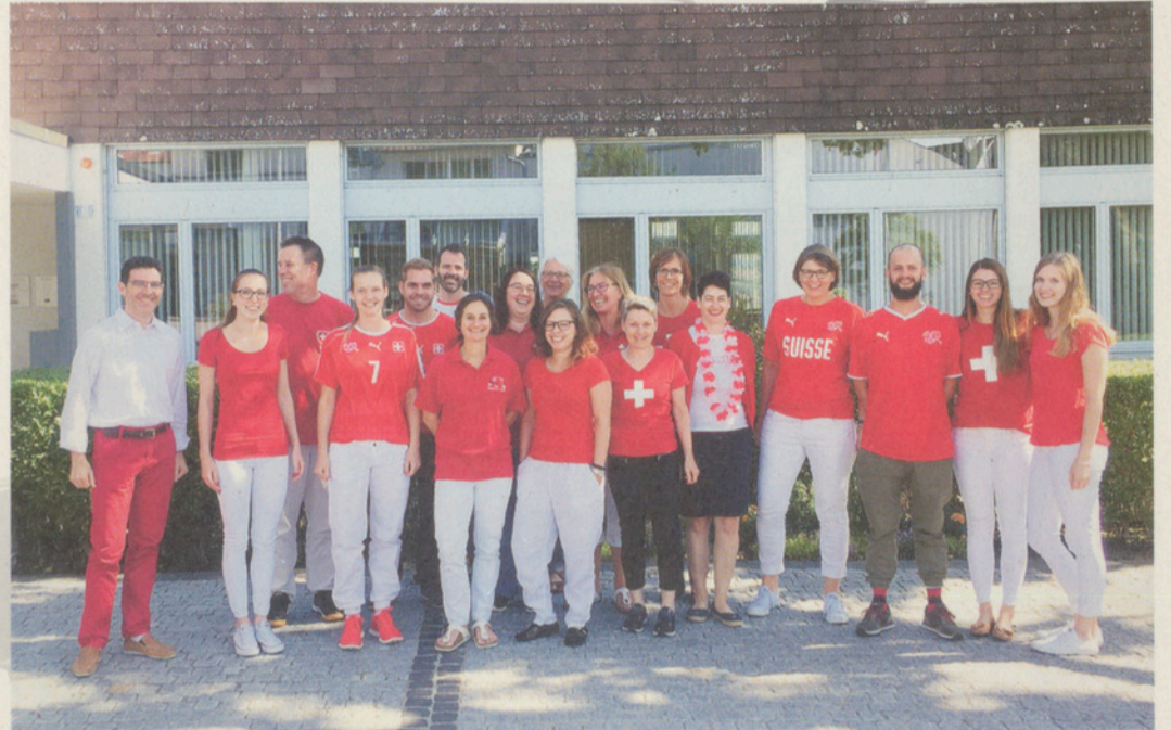
Die Mitarbeiter der Gemeindeverwaltung arbeiteten am Freitag (als die Schweizer Nationalmannschaft gegen Serbien gewann) unter dem Motto: «Friday in red and white – Hopp Schwiiz!»

Fernseher: Normaler Fernseher Wird jeder Match übertragen: Ja Spezielles: WM-Karte mit div. Baguettes (z. B. mit Peperoni/Chili/Salami/Käse)