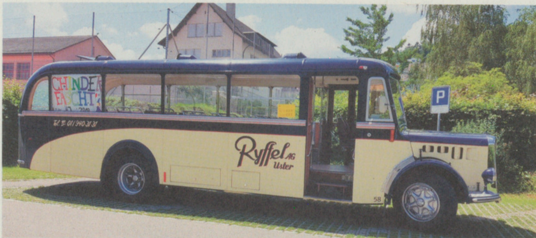
Das alte Postauto verkehrte zwischen allen Chinderhuus-Stätten.