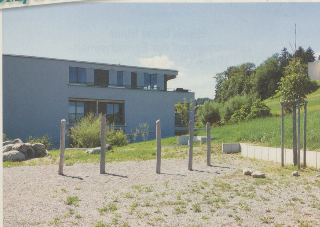
Spielplatz Breiti, Ebmatingen: So einladend sieht der einzige wirklich öffentliche Spielplatz in der Gemeinde aus.