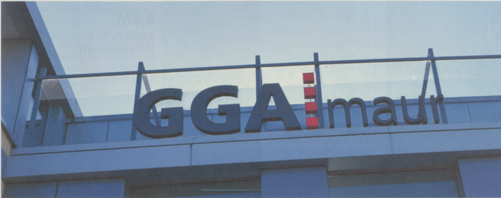
Im Vorstand der Genossenschaft gibt es grössere personelle Wechsel.