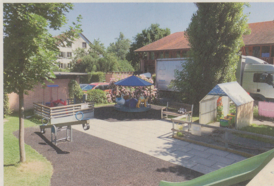
Schiffflände Maur, ein privater Spielplatz mit Potential: Nebst einem neu installierten Kletterturm mit Rutsche, einer Wippe und Schaukeln befinden sich dort auch viele Geldautomaten, die Eltern in Zugzwang bringen...