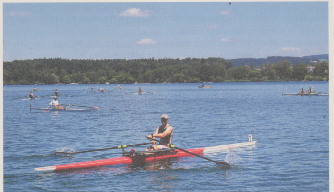
Text und Bild: Christoph Lehmann

Bei prächtigstem Wetter und fast ohne Wind fand auch in diesem Jahr mit viel Publikum die traditionelle internationale Ruderregatta auf dem Greifensee statt. 48 Teams aus der Schweiz, Österreich und Deutschland massen sich in den verschiedensten Ruder kategorien in gegen 100 Rennen.