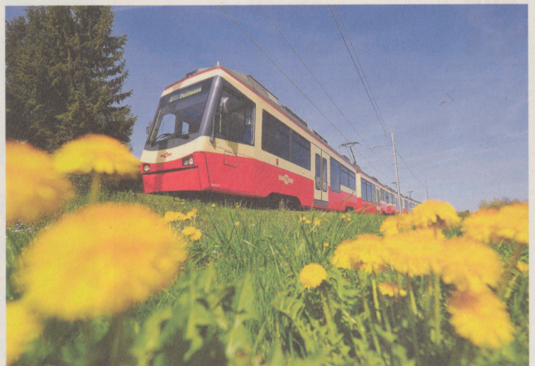
Gut auf Kurs: 89 Prozent aller FB-Züge erreichten 2017 ihr Ziel ohne Verspätung.

In Sachen Pünktlichkeit der Züge erreichte die Bahn mit 89% (Vorjahr 72%) aller Züge in der Hauptverkehrszeit pünktlich ihr Ziel. Eine weitere interessante Zahl ist die Anzahl von Fahrgästen ohne gültiges Ticket: Von insgesamt 54000 kontrollierten Fahrgästen mussten insgesamt 1,1% ohne Fahrschein registriert werden. Das Geschäftsjahr 2017 war für die FB also insgesamt sehr positiv und auch bauseitig verlief das Jahr ruhig, es mussten nur an wenigen Tagen und einigen Abschnitten Bahnersatzbusse eingesetzt werden. An der letzten Generalversammlung verabschiedete sich die Gesellschaft ausserdem würdig vom langjährigen Verwaltungsratspräsidenten Ueli Büchi, der 70 Jahre alt geworden ist.