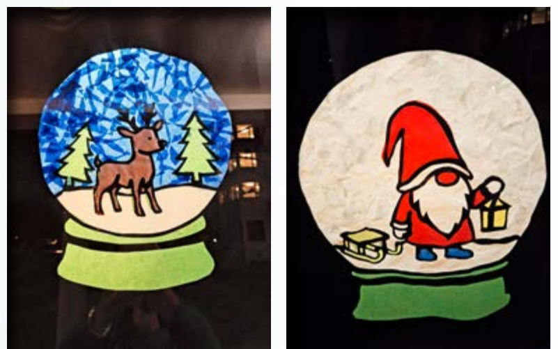
Adventsfenster Forch, Chinderhuus Muur, Hort Forch, Nr. 4.