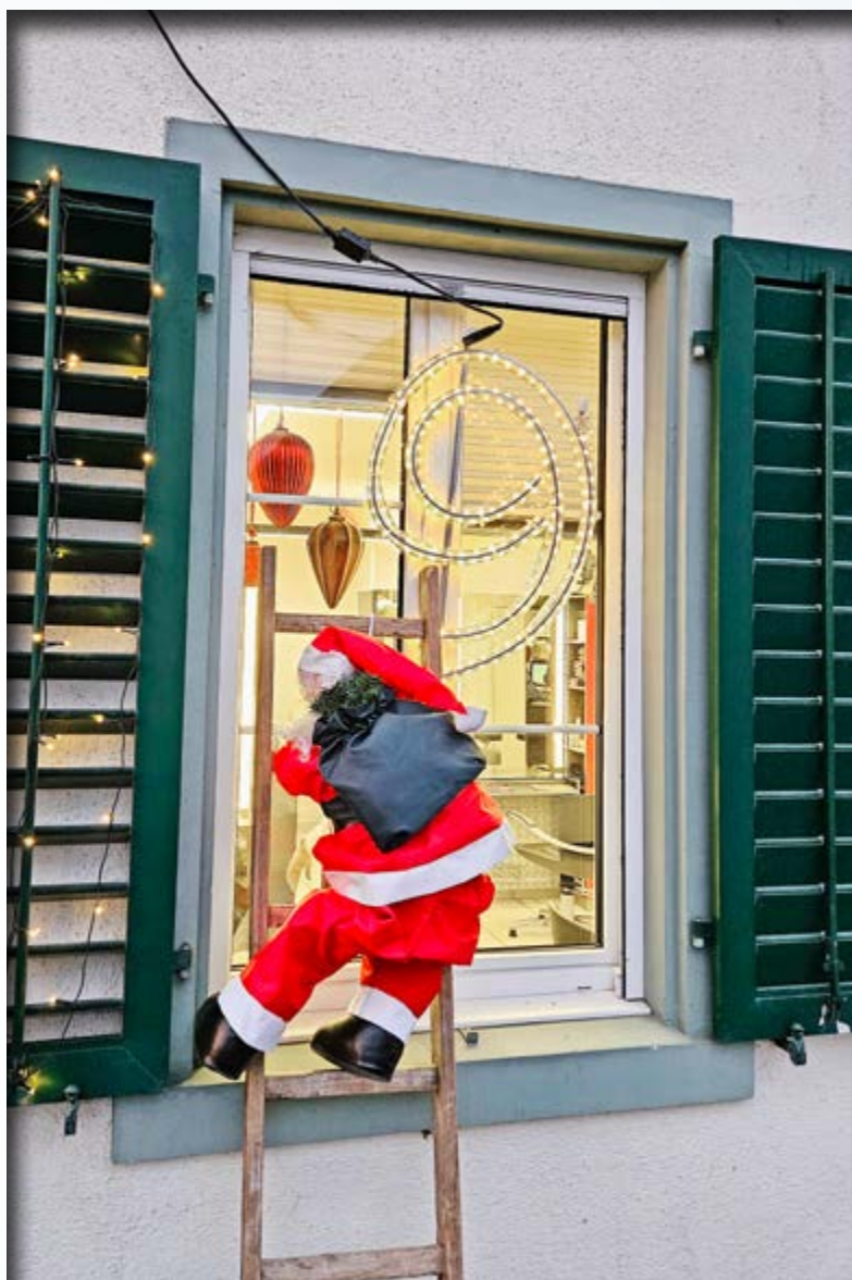
Adventsfenster Maur, Nr. 9, Coiffeur Neuhof