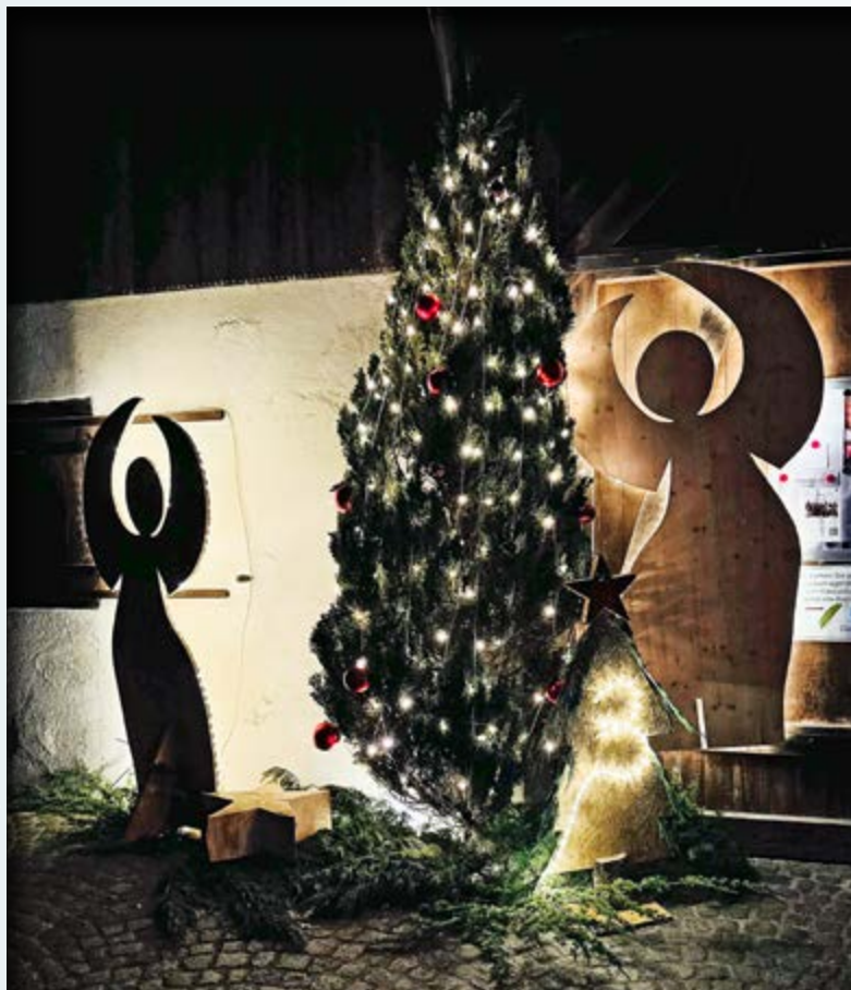
Adventsfenster Forch, Ortsverein Aesch Scheuren Forch, Nr. 3.