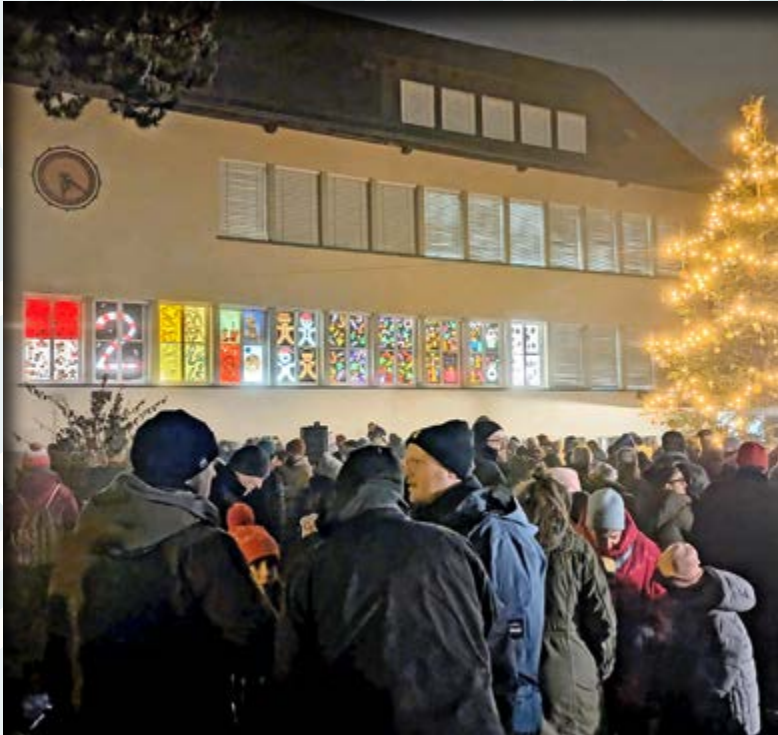
Adventsfenster Maur, Schulhaus Pünt, Nr. 2.

Tradition Jahr für Jahr sind die stimmungsvollen Dekorationen in der Gemeinde ein lichtvoller Hingucker – und eine wunderbare Gelegenheit zum vorweihnachtlichen Austausch.