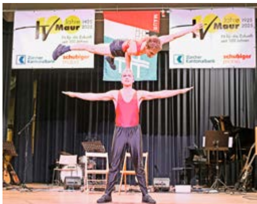
Akrobatikvorführung von «HandundStand» am Jubiläumsfest.

Als Höhepunkt im Vereinsjahr feierten wir am 29. November 2025 das 100-Jahre-Jubiläum. Rund 200 aktive und ehemalige Vereinsmitglieder trafen sich mit ihren Partnerinnen und Partnern in der Vogtei in Herrliberg, um dieses Jubiläum gebührend zu feiern, denn vor fast genau 100 Jahren am 1. Dezember 1925 gründeten 22 junge Männer im damaligen Schulhaus in Maur (heutige Bibliothek) den Turnverein. Es war ein tolles Fest. Die Folk-Rock-Band Floorless spielte auf, bei denen zwei der fünf Mitglieder dem TV