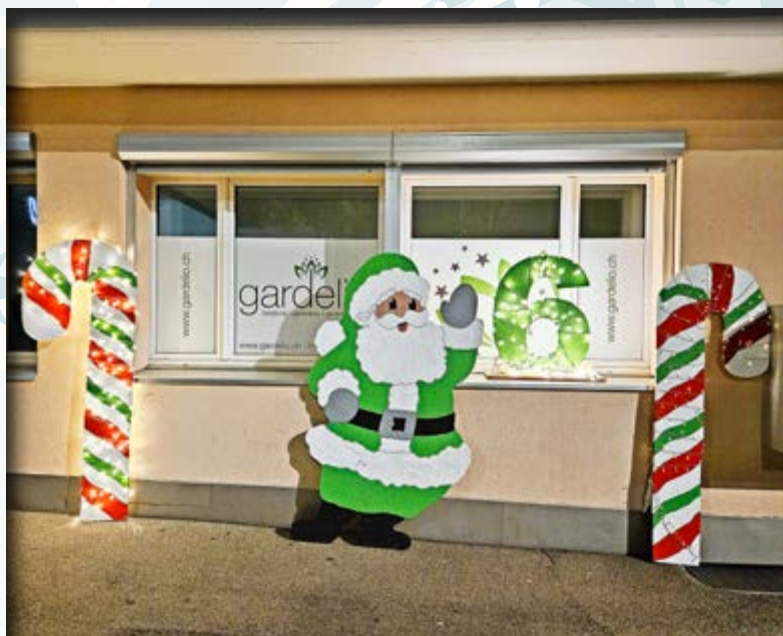
Adventsfenster Binz, Nr. 6, Gardelio