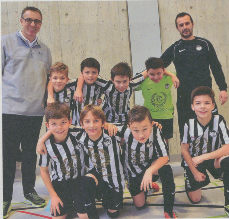
Die Ea-Junioren mit den Trainern vor dem Spiel gegen den FC Küsnacht.

Die jungen Fussballer studieren die Mannschaftslisten und handeln bereits die ersten Resultate. Ob FC Zollikon, FC Küsnacht, FC Red Star – viele Teams kennen sie von