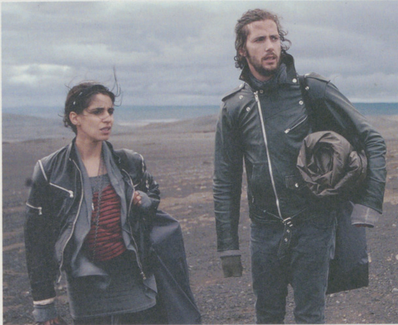
Preisgekrönter Berner Spielfilm mit Schauplatz Island.