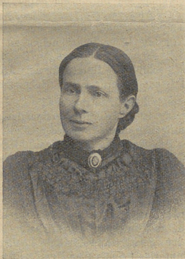
Frau Dr. Marie Heim-Vögtlin die erste schweizerische Ärztin

Inhalt: Bild: Frau Dr. Marie Heim-Vögtlin, die erste schweizerische Aerztin. — Frau Dr. Heim-Vögtlin (Text). — Aus dem Zentralvorstand. — Ueber Frauenberufe (Fortsetzung). — Der schweizerische Puppenwettbewerb 1916. — Jungfer Regula. — Vom Büchertisch. — Inserate.