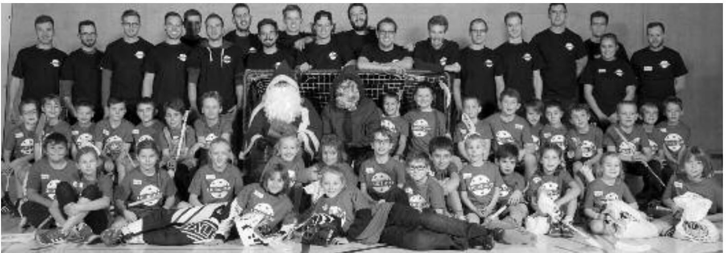
Grosser Einsatz, um den Spass am Unihockey zu wecken.