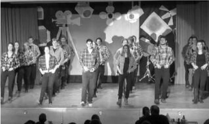
Die Fernsehshow begeisterte den vollen Bucksaal.

einer Übertragung der Schweizer Meisterschaft im Synchronschwimmen. Nachdem eine Programmstörung gekonnt mit einer Darbietung der grossen JUSPO-Meitli überbrückt wurde, trat dann die Turnvereins-Kompanie der Schweizer Armee auf. Kurz vor Sendeschluss fassten dann die Korbballerinnen das Sportgeschehen im Sportpanorama zusammen. Zusätzliche Einnahmen für die Vereinskasse generierte die Damenriege mit einer Zweifel Chips-Werbung. Die Glasfasern waren bis zu diesem Zeitpunkt schon ziemlich erhitzt, das genügte dem Gemeindepräsident allerdings noch nicht. Der Auftrag lautet klipp und klar: «Glühen muss das Netz!». Also setzten die Turnerinnen und Turner der Turnvereine Grafstal zum Schlusspunkt an und die junggebliebenen Frauen zeigten in «Bauer, ledig, sucht» wo der «Bartli wirklich den Moscht holt».