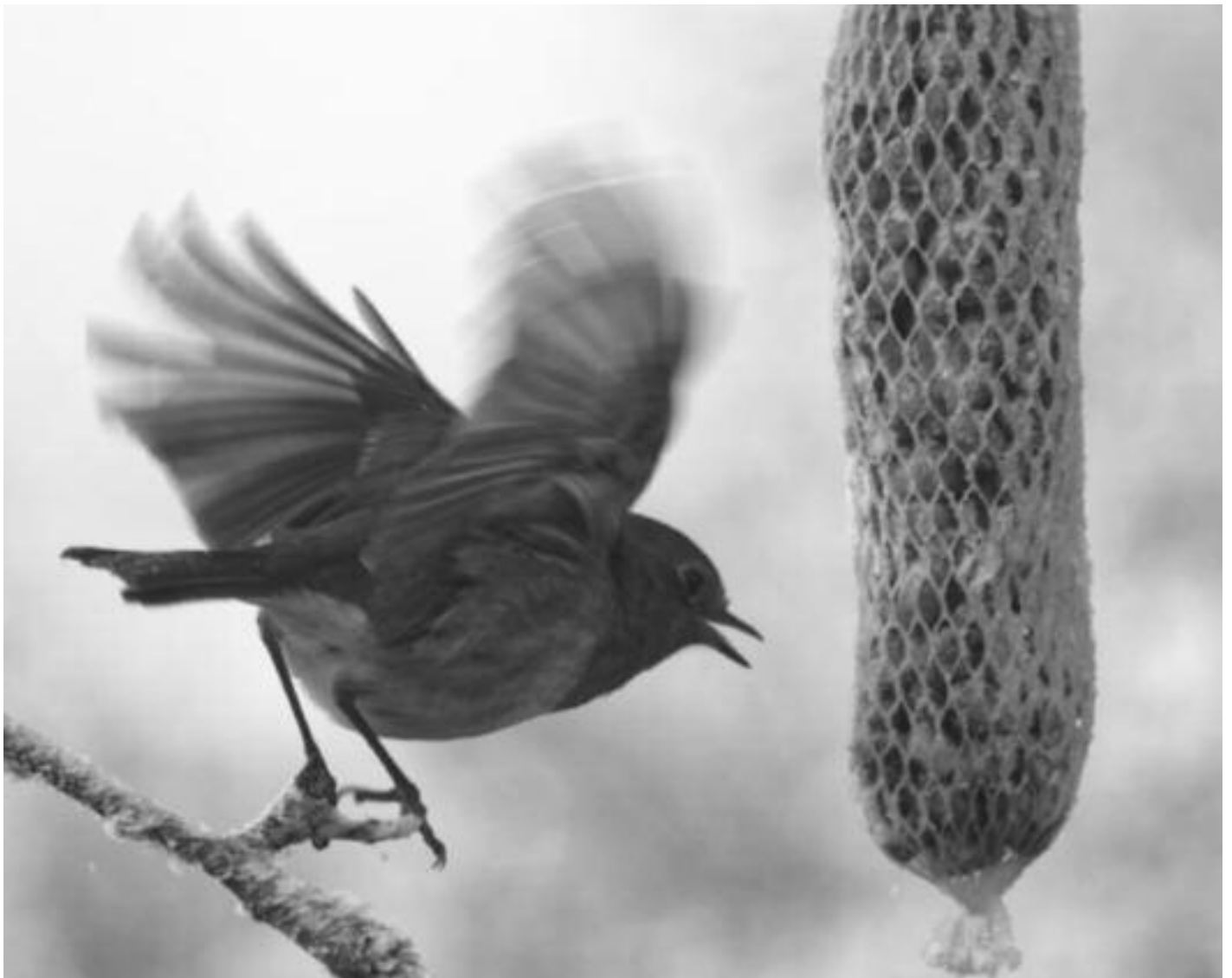
Winterlicher Gast im Garten