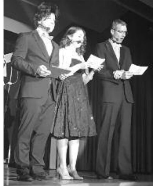
Einmal mehr bot die Turnerfamilie ein Spektakel und brachte den Bucksaal zum Kochen.

Einmal mehr erlebte die Turnerfamilie Grafstal ein tolles und unterhaltsames Wochenende, das allen