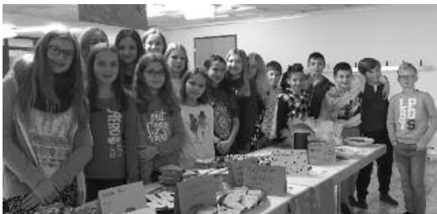
Der Pausenkiosk der 6. Klasse Bachwis war ein voller Erfolg. Und es hat Spass gemacht!

Die Idee, einen Pausenkiosk im Schulhaus aufzubauen, war schon lange ein Thema. Wir haben dieses Thema in den letzten zwei Jahren immer wieder im Schulparlament besprochen. Wir 6. KlässlerInnen wagten uns an einen ersten Pausenkiosk-Versuch im Bachwis.