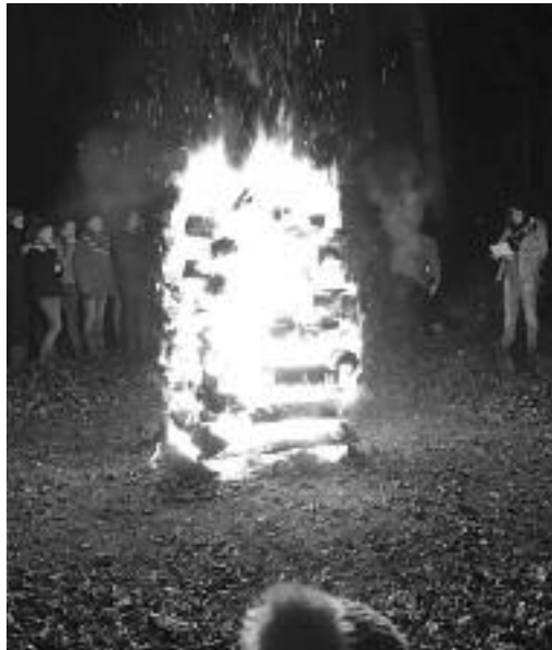
Traditionelles Feuer an der Waldweihnacht der Pfadi.

Dort erwartete sie ein hohes Feuer. Etwa 15 Kinder durften in die höhere Stufe und eine neue Gruppe übertreten. Anschliessend wurde der «Pfadi des Jahres 2016» auserkoren. Er erhielt einen Zinnbecher, welcher seit 1982 als Wanderpokal weitergereicht wird, der Pfadiname jedes Geehrten ist darin eingraviert.