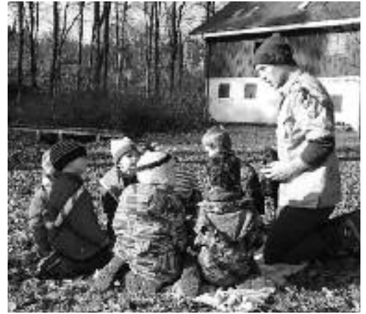
Wertvolle gemeinsame Erlebnisse in der Pfadi.

Währenddem die Eltern auf einer kurzen Wanderung zurück zum Pfadiheim gelangten, wurden in allen Gruppen die neuen Mitglieder mit einer Willkommensaktivität begrüsst. Vor dem Pfadiheim wagten danach die neuen Abteilungsleiter Akoya und Aragorn einen Blick auf das kommende Jahr und machten auf die wichtigsten Anlässe und das Lager aufmerksam. Nach ein paar Verabschiedungen und Ver-