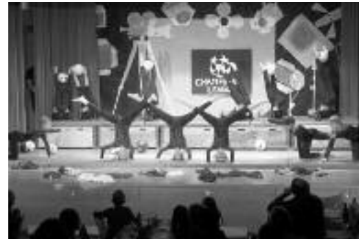
Es wurden turnerische Höchstleistungen gezeigt.

gekonnt dressiert, bevor dann die JUSPO-Bueben in der Sendung «Netz Natur» den Bären tanzen liessen. Der Wetterbericht, vorgeführt von den JUSPO-Mädchen, verhiess leider nur Regen. Das machte aber nichts, da sowohl die Küchenschlacht (Ballsport) wie auch die Tagesschau aus dem vereinseigenen Studio gesendet wurden.