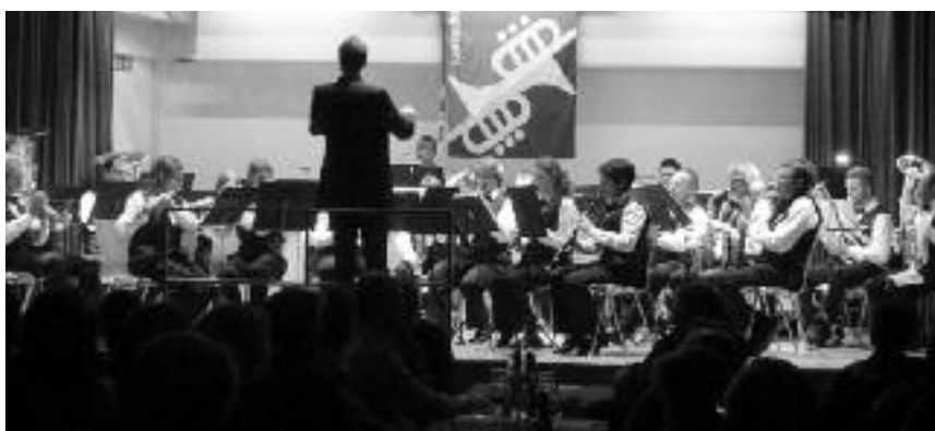
Das vielseitige Programm konnte von A bis Z begeistern.

Während der anschliessenden Pause hatten die Besucher wie jedes Jahr Gelegenheit, sich am reichhaltigen