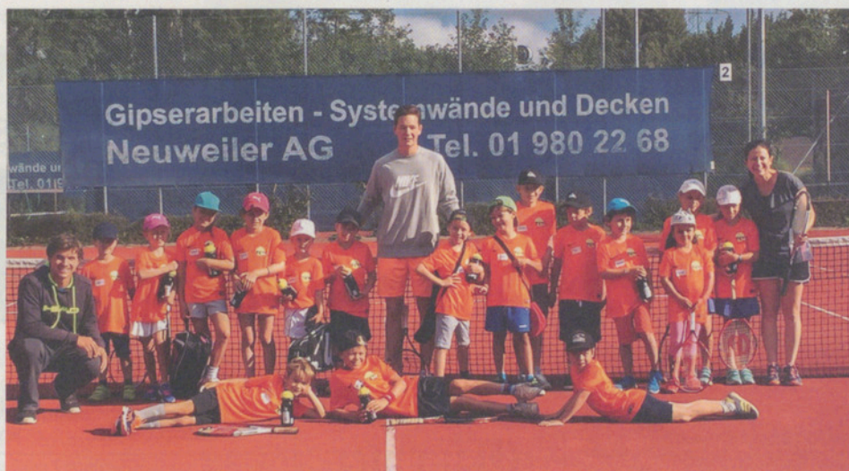
Das Tenniscamp: attraktives Angebot für Daheimgebliebene.

Immer in der vierten Sommerferienwoche findet dieses Camp für die Anfänger-Kids statt; um die zwanzig Kinder mit drei