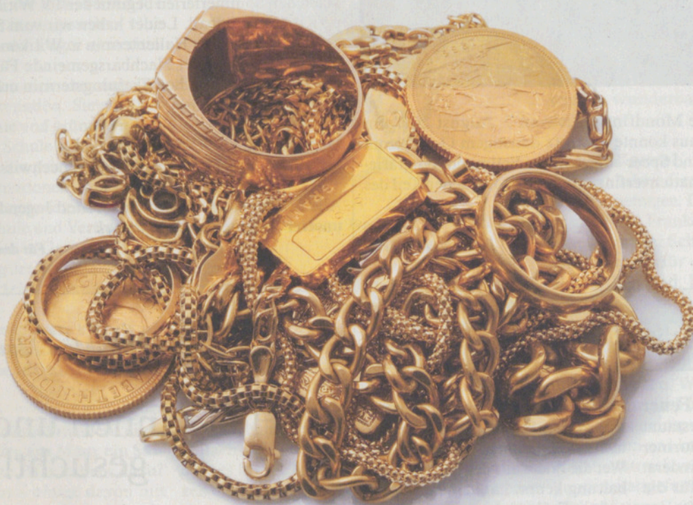
Altgold gilt als gute Wertanlage. Es lässt sich stets verkaufen. – Fragt sich allerdings nur: zu welchem Preis?

Er tippt mit seinen Goldhändchen irgendetwas in den Taschenrechner, runzelt ein paar mal die Stirn und befiehlt der Dame mit einer gekonnten «jä nuso dänn halt»-Dramatik, mir fünf blaue Nötli zu geben. Ich wollte doch gar nicht verkaufen – blöder Eigenversuch!