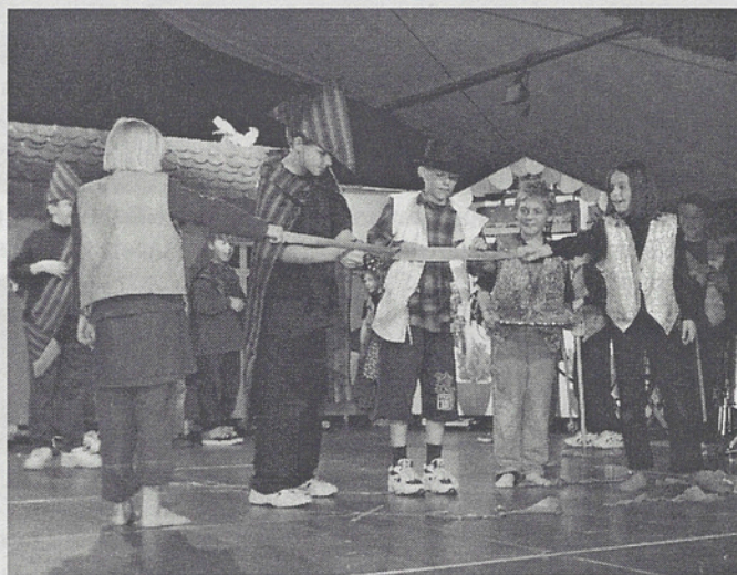
... und offizielle Einweihung der neuen Turnhalle der Schildbürger mit «Dölf» Ogi (links) und dem Bürgermeister von Schilda.

lü. Ganz Maur war letztes Wochenende auf den Beinen. Im Zentrum stand nicht nur die Halbmarathon-Weltmeisterschaft, sondern auch die Einweihung der neuen Turnhalle Pünt samt Zivilschutzanlage. Das Tüpfelchen auf dem i bildete dabei das am Samstagabend aufgeführte Singspiel «Schilda ist überall».