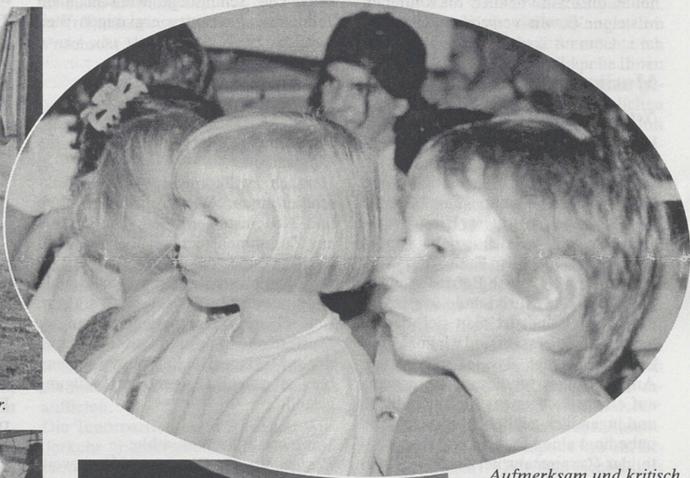
Aufmerksam und kritisch werden die Gschpännli beobachtet...