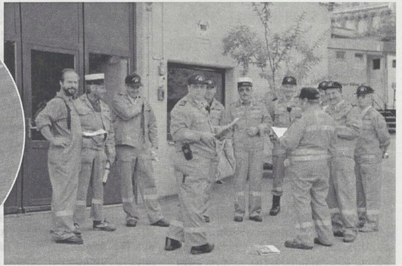
Die Verkehrsabteilung der Feuerwehr beim Appell.