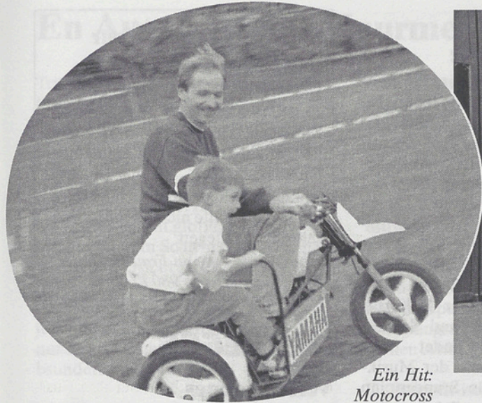
Ein Hit: Motocross