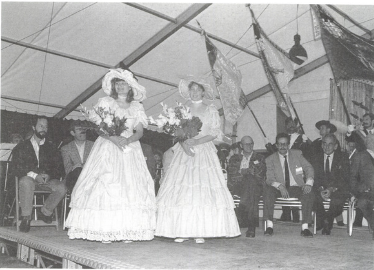
Respektvoll bewundert: zwei Ehrendamen am Dorffest in Binz.