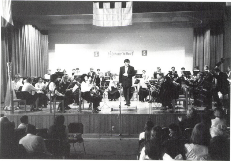
Festlicher Auftakt der Maurmer 700-Jahr-Feiern mit dem Orchester 700.