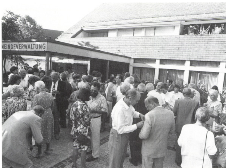
Auswärtige Maurmer treffen sich mit Einheimischen vor dem Gemeindehaus.