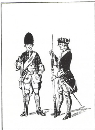
Grenadier und Füsilier im Regiment Hirzel 1725.