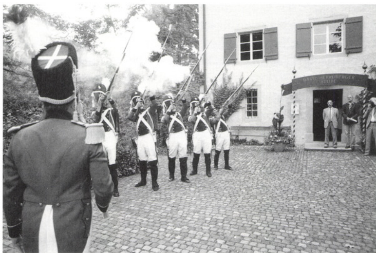
Zum Auftakt der Ausstellung «Honneur et Fidélité»: Pulverdampf der Glarner Beresina Grenadiere.