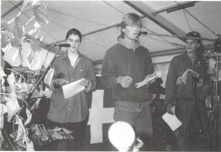
Jugendliche präsentieren an der 1. August-Feier 1991 ihre Ideen in einem Sketch.