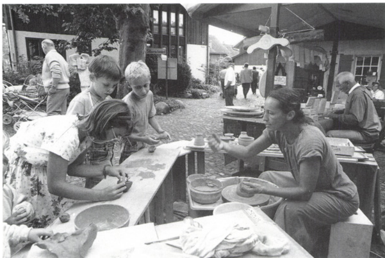
Chilbimärt Maur: Kinder lassen sich in die Geheimnisse des Töpferns einweihen.