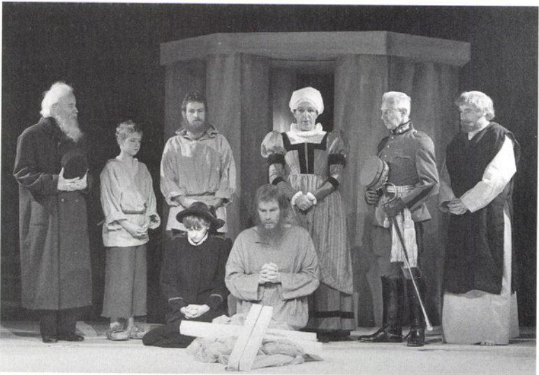
«Das Friedensmahl», Festspiel von Walter J. Hollenweger mit dem Theater für den Kanton Zürich.