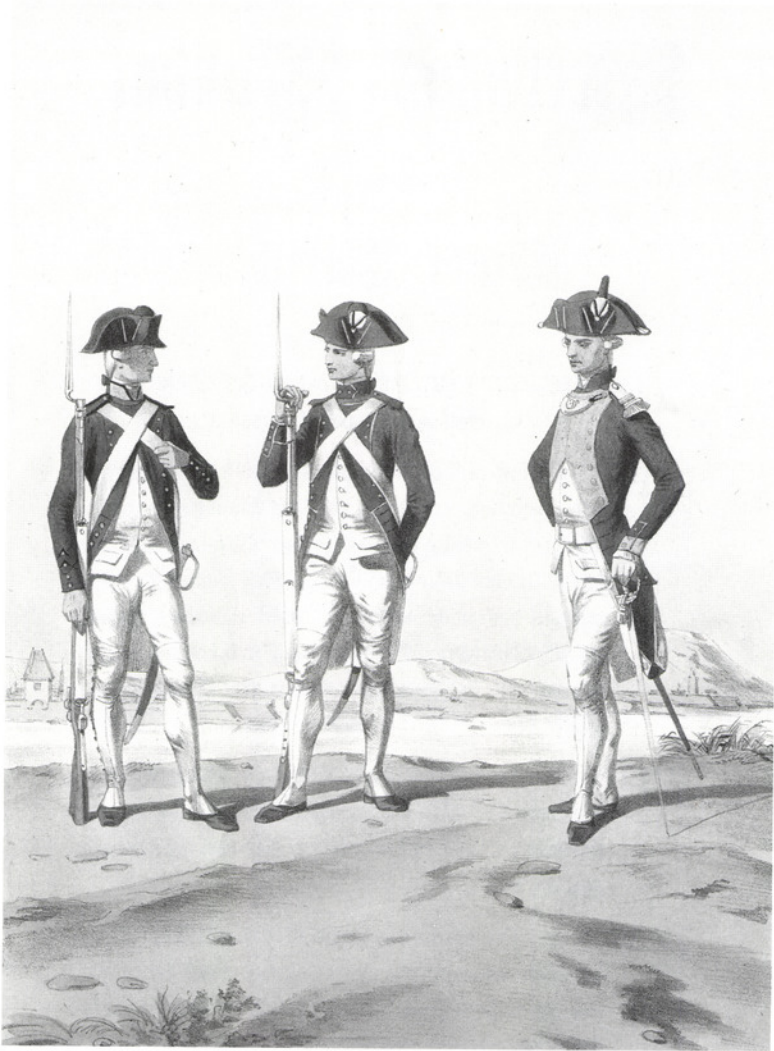
Schweizer Füsiliere und Offizier (rechts) in königlich-französischen Diensten um 1780. Lithographie nach Alfred de Marbot, Sammlung Vincenz Oertle, Maur