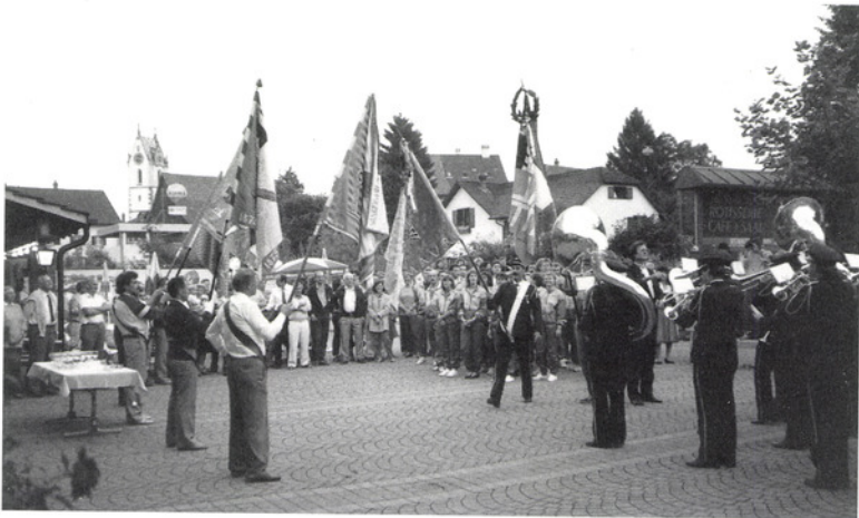
Empfang von Damenriege, Turnverein und Musikgesellschaft Maur (Heimkehr von Eidgenössischen Festanlässen)

Die Resultate liegen bei Redaktionsschluss noch nicht vor.