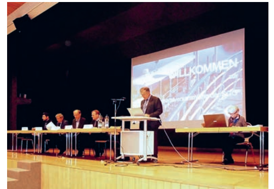
Der heisse Sommer 2018 hatte positive Effekte auf die Schifffahrt auf dem Greifensee.

Schiffseitig nahmen die Genossenschafter zur Kenntnis, dass 2018 keine nennenswerten Ausfälle zu verzeichnen waren und lediglich, während der lange anhaltenden Trockenheit die Anlegestelle «Mönchaltorf» rund sechs Monate nicht mehr angelaufen werden konnte. Die Restaurierung des Oldies «MS Heimat», die im Winter 2017 durchgeführt wurde, konnte im letzten Jahr abgeschlossen werden. Dies zu totalen Kosten von knapp 0,6 Mio. Franken, welche vom kantonalen Lotteriefonds gespeist werden konnten. Der entsprechende Rechenschaftsbericht ist von der Finanzdirektion ohne Vorbehalte im Oktober 2018 genehmigt worden. Der Ausblick auf das angelaufene Jahr zeigte den Anwesenden, dass sich der Verwaltungsrat in der dritten Phase des Projekts «Futura» bewegt und hier vor allem in der Kulinarik noch einen Zucken zulegen möchte. Für alle soll es etwas geben: «Von einheimischen Themenabenden