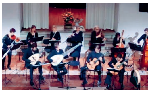
Das Ensemble spielt alte Musik aus dem Norden.

Das Ensemble «Barock Nord West» ist eine Gruppe von Musizierenden, die sich der weitgehend unbekannteren alten Musik aus dem Norden und Nordwesten Europas verschrieben hat. Die Lieder und Tänze stammen vorwiegend aus der Renaissance- und Barockzeit um 1530 bis ca. 1770, aufgeschrieben in Manuskripten oder von Komponisten meist nur als einstimmige Melodie festgehalten. So ist es möglich, dem Stück durch die Instrumentenbesetzung (u. a. Renaissance-laute und Cimbaly) einen zum Ensemble passenden Charakter zu geben. Geprägt von den rauen