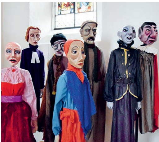
Das Puppenensemble der menschengrossen Tösstaler Marionetten, die von Puppenspielern bewegt wurden und deren Stimmen erhielten.

In der Novelle, die Gotthelf 1842 schrieb, geht es um Bauern, die in viel zu kurzer Frist einen Auftrag für ihren Lehnsherrn ausführen müsse. Der Teufel rettet die Bauern aus der Not, will dafür aber ein ungetauftes Kind. Eine Frau, die versucht, das Unglück zu verhindern, wird vom