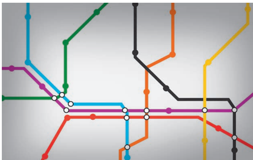
Die neue Busanbindung – für Maur ein Mehrwert.

Die Verlängerung der Linie 910 von Tiefenbrunnen nach Looren wird im Dezember 2019 in den Fahrplan genommen. Von Montag bis Freitag soll der Bus zwischen 6.00 und 20.00 Uhr verkehren. Zu den anderen Zeiten wird der Bus nur zwischen «Bahnhof Tiefenbrunnen» und «Station Zollikerberg» verkehren. Zwischen 6.00 und 8.00 sowie 16.00 und 18.30 Uhr gibt es einen 15-Minuten-Takt, dazwischen fährt er alle 30 Minuten. Der Zürcher Verkehrsrat fällt den definitiven Entscheid über die Einführung des neuen Angebots im Sommer 2019.