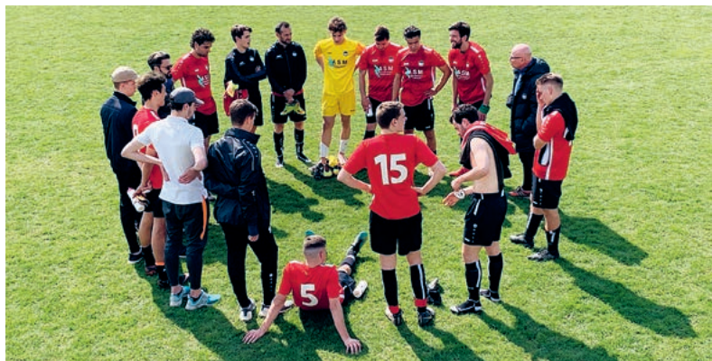
Eines ist klar: Das Runde muss ins Eckige...