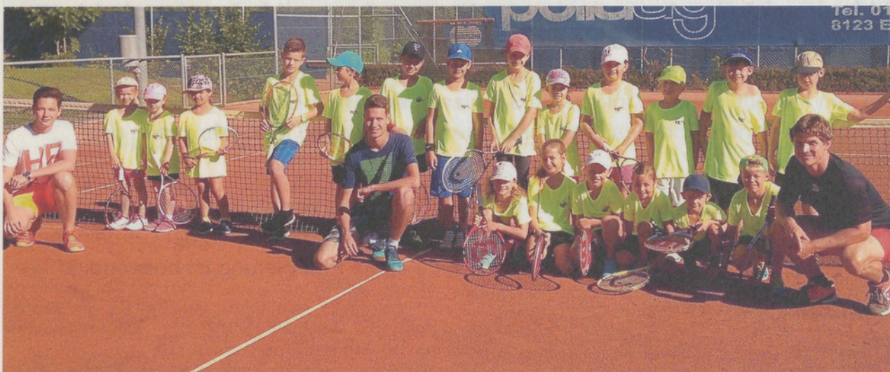
Die tennisbegeisterten Kinder des Sommerncamps mit ihren Tennislehrern.