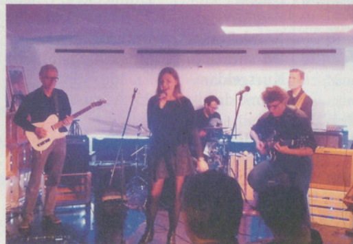
«Prank gone wrong».