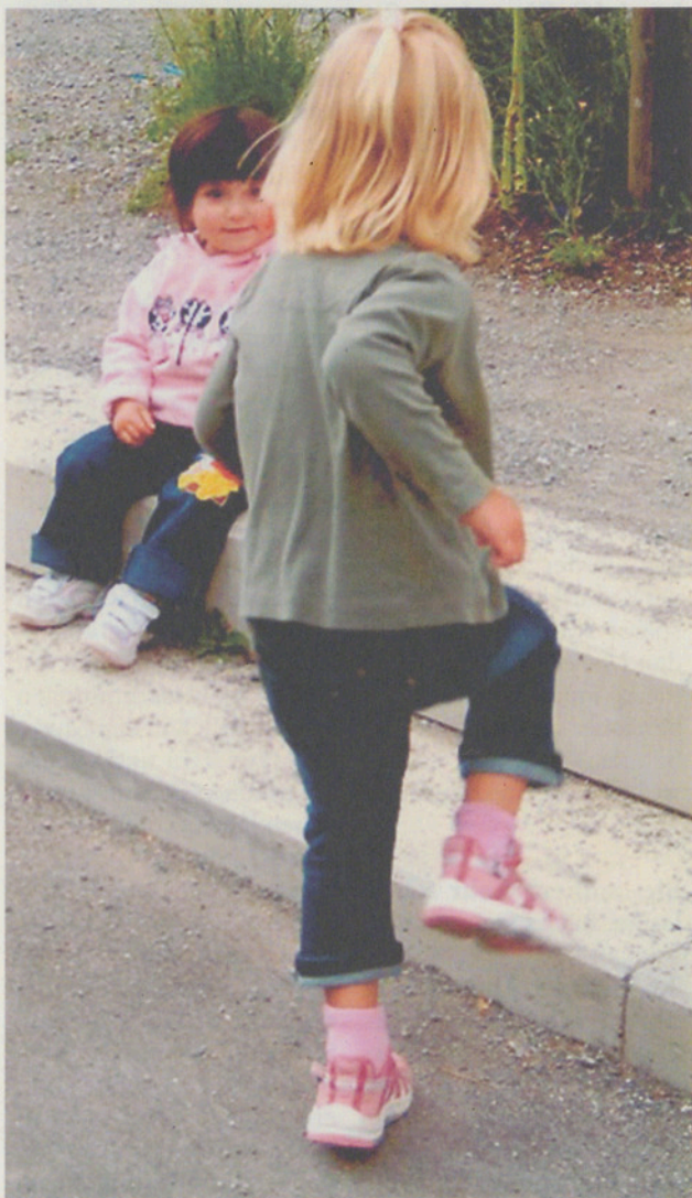
Am Dorffest Binz.