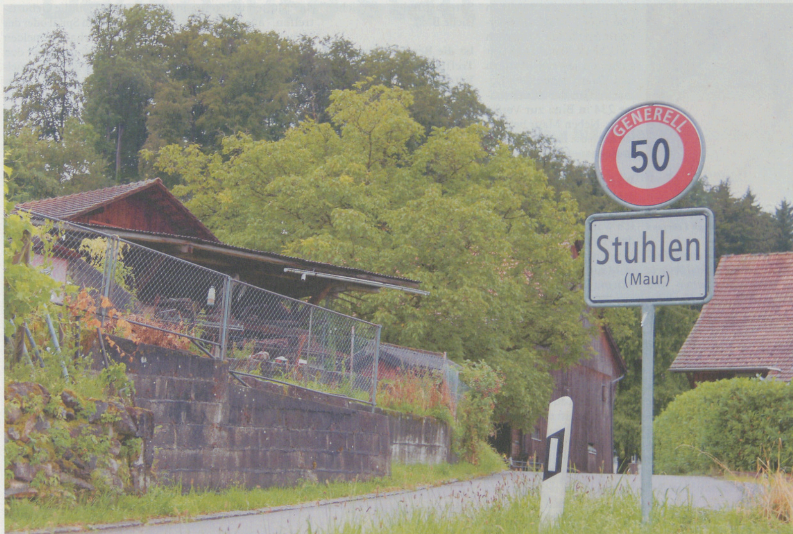
Der Weiler Stuhlen gehört zu Ebmatingen, ist aber eine kleine Welt für sich.