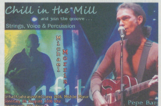
«Chill in the Mill».