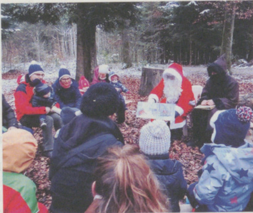
Der Samichlaus erzählte auch Weihnachtsgeschichten.

Die Grossen wärmten sich am Feuer im Wald und die Kleinen genossen einen Zvieri, aber immer wieder blickten die Anwesenden suchend die Strasse hoch: «Wann kommt denn der Samichlaus», meinte ein Kind ganz ungeduldig zu seinem Grosspapi. Und plötzlich vernahm man Rufe: «Da kommen sie, da kommen sie!» Rasch