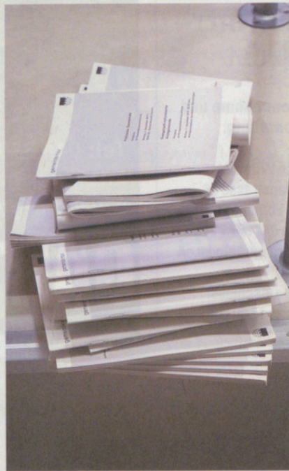
Fertig, am Ende bleibt ein Haufen Papier.

Das Budget wurde ebenso einstimmig angenommen wie der Punkt 2 auf der Traktandenliste, die Übertragung eines Gemeindegrundstücks vom Finanz- in das Verwaltungsvermögen.