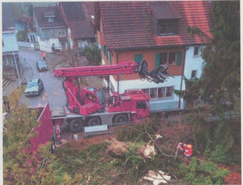
Die Bäume hinterlassen eine Lücke – im wahrsten Sinne des Wortes.

Mit grossen Maschinen hat am Mittwoch, 29. November, ein spezialisiertes Unternehmen zwischen dem Haus der «Alten Post» Binz und dem benachbarten Restaurant Trotte zwei grosse, alte Tannen entfernt. Das Holz ist aufgrund des langsamen Wachses mit vielen Ästen leider nicht weiterverwertbar zum Bauen oder Heizen, so mussten die beiden rund 20 Meter hohen Bäume leider entsorgt werden.