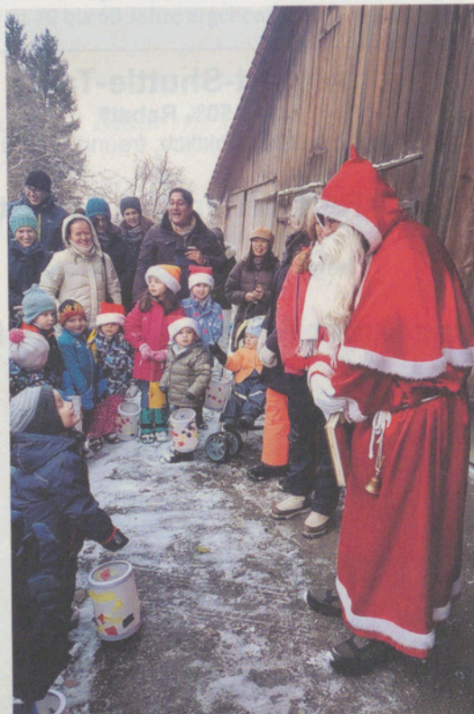
Die Spielgruppenkinder bestaunen den Samichlaus.

Im Anschluss sind alle zu einem heissen Getränk und Kuchen eingeladen. «Der Samichlaus ist ein Lieber, ich freue mich aufs nächste Jahr», ist von einer Kinderstimme zu hören.