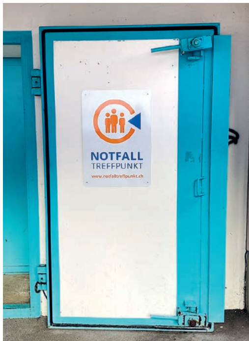
Einer der vier Notfalltreffpunkte von Maur.

Falls so ein Kommunikationsausfall länger andauert und man das Haus zwar eigentlich nicht verlassen muss, sich aber unsicher fühlt und man die Polizei nicht erreicht, weil man ja nicht telefonieren kann, dann kann man sich zu einem der vier Notfalltreffpunkte begeben, die in der Broschüre aufgelistet sind. Das sind für Uessi-