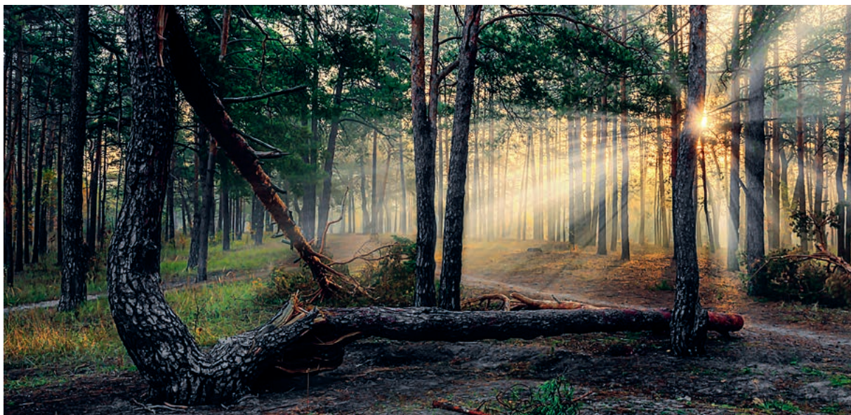
Es ist ein Erlebnis, wenn man sich die Zeit nimmt, den Wald mit allen Sinnen zu erfahren.