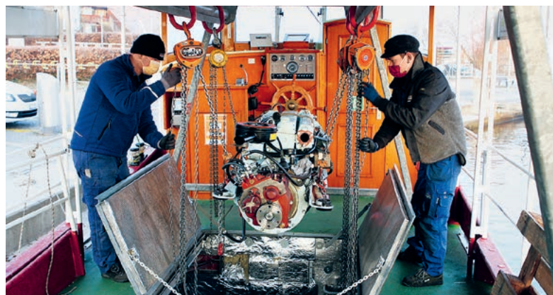
Hat treue Dienste geleistet: der alte Dieselmotor.