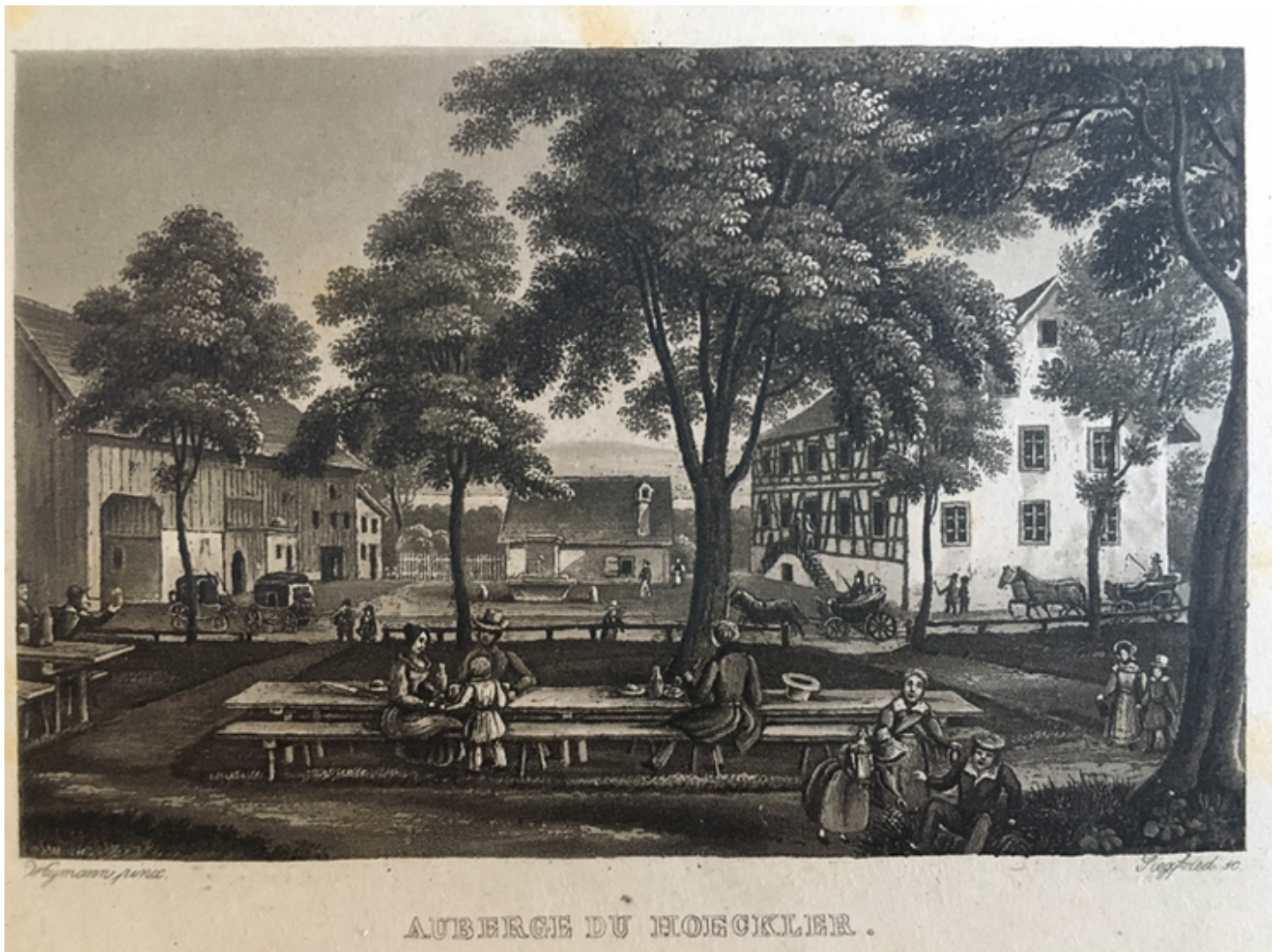
Auberge du Hoeckler. Weymann pinxit. Publié par Herrmann Trachsler. 1840. Privatbesitz.

Eine touristische Hausse dürfte die Jahrhundertwende zum 19. Jh. gewesen sein. Davon zeugt ein Kunstblatt, das den Grundriss der Anlage zeigt. Es stammt aus dem Jahre 1795 und wird Heinrich Bruppacher von Wädenswil zugeschrieben. Von der touristischen Bedeutung zeugt auch der Besuch, der dem Höckler im Sommer 1800 von der ehrenwerten Bürgerlichen Abendgesellschaft Wollishofen abgestattet wurde.