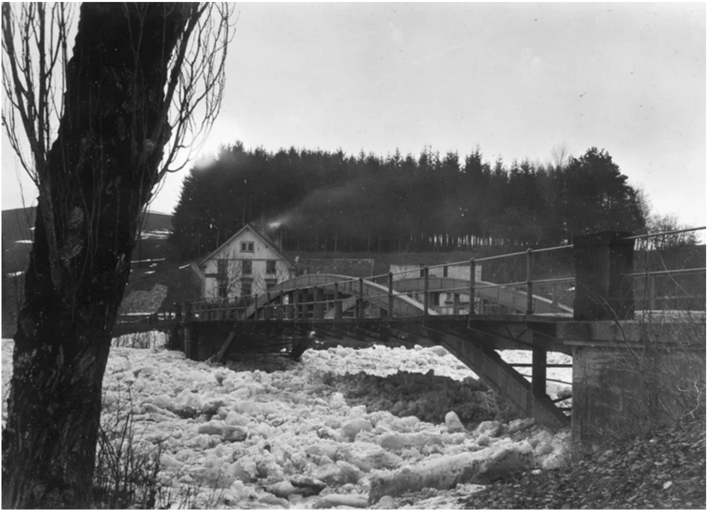
Höcklerbrücke 1893. Allmendstr. 84.

Eine zweite Bedrohung der friedlichen Landschaft ergab sich durch die Erweiterung der militärischen Anlagen des Albisgütli in Richtung Höckler. Das mündete in einen Vertrag von 1904 zwischen Stadt und Kanton zwecks «Überlassung des Allmend-Höckler-Areals und des Militärschießplatzes im Albisgütli als Bestandteile des Waffenplatzes Zürich.» Spätestens mit den Schiessübungen auf dem Höckler-Areal war dann eine landwirtschaftliche oder gar touristische Nutzung nicht mehr gegeben.