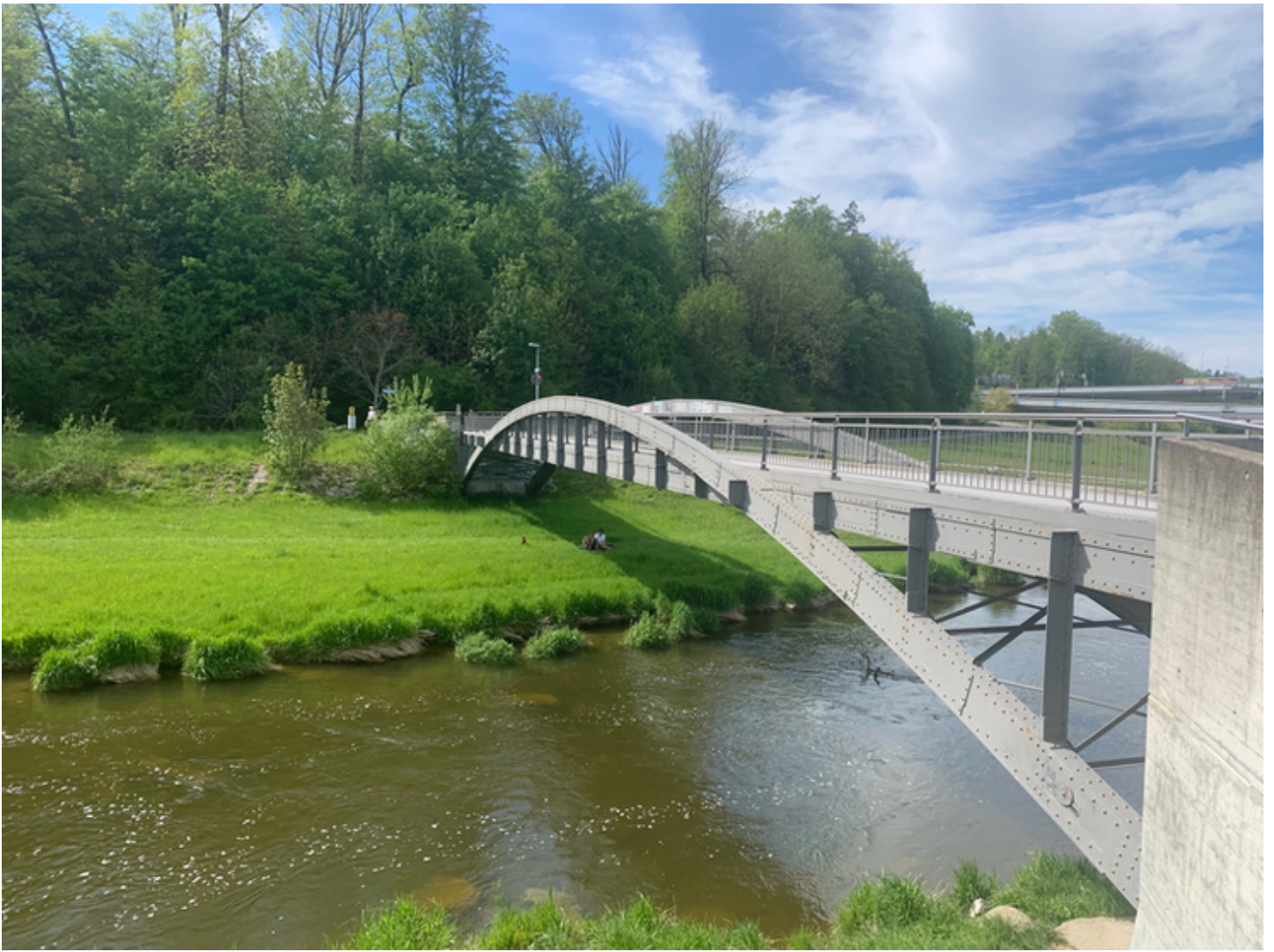
Heutige Höcklerbrücke, am neuen Standort.

Die heutige Höcklerbrücke ist das Resultat der Landschaftsgestaltung der Sihl nach Fertigstellung des Üetlibergtunnels und der Verzweigung Zürich Süd (Autobahnkreuz A3/A3W). Die Brücke wurde etwas nach Süden, gegen Leimbach hin, versetzt und instandgesetzt. Heute ist sie viel benutzt von Velofahrern, Spaziergängerinnen, Hunden mit ihren Meister/innen...