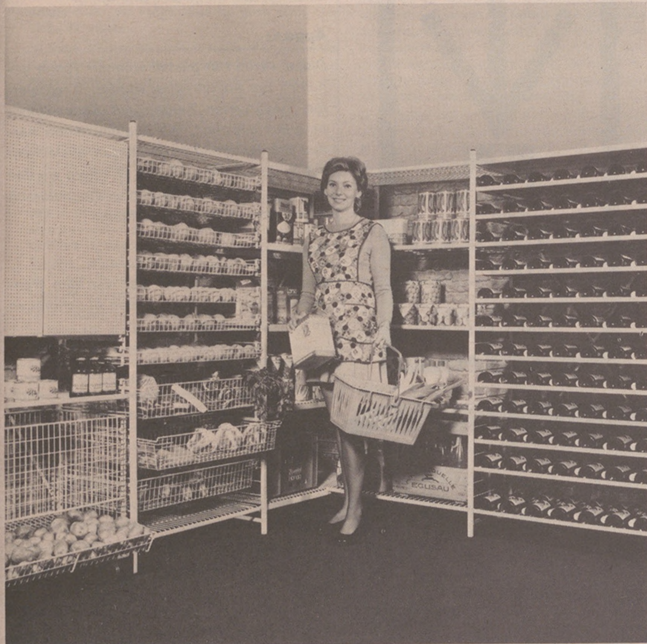
Das Universal-Hupfer-Regal mit Fliegenschrank, Kartoffelbehälter, ausziehbaren Obst- und Gemüsekörben, verstellbaren Tablaren für Konserven, Pakete usw. sowie Flaschen-Auflagen.

Mit dem sympathisch eingerichteten neuen Verkaufsbüro an der Riedhofstrasse 75 (früher Badenstrasse 330) präsentiert der Fabrikant ein Sortiment, das vom Tiefkühl-Regal über Economat-Regale bis hin zum einfachen Flaschen- und La-