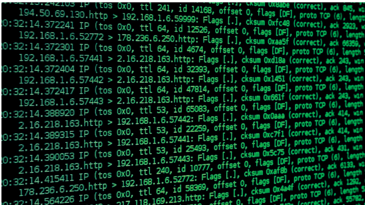
Das Internet basiert auf einer ganz eigenen Art von Sprache.