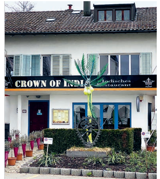
Derzeit noch in Witikon: Crown of India.

Wer sonst noch ungesicherte Amphibienzüge sieht oder tote Tiere entdeckt, melde es doch bitte Petra Lohmann unter plohmann@reprivet.ch .