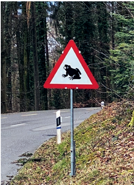
Bitte bremsen für die Frösche.