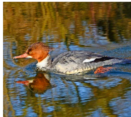
Ein Gänsesägerweibchen im Mündungsgebiet des Aabachs.