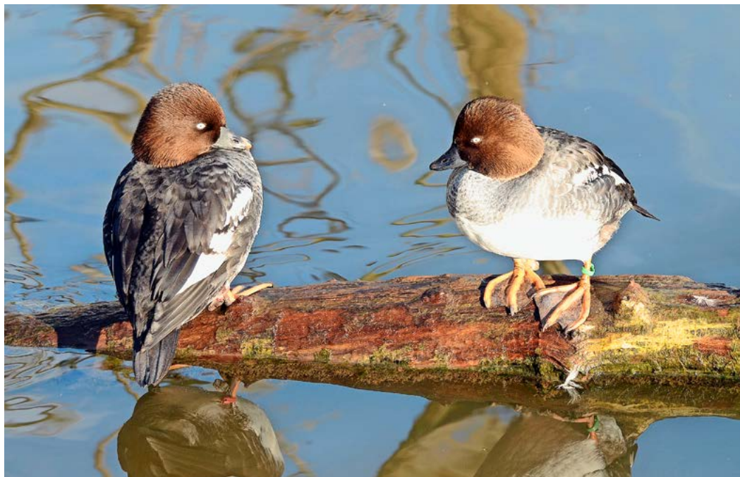
Schellenten wärmen sich zwischen den Tauchgängen auf.