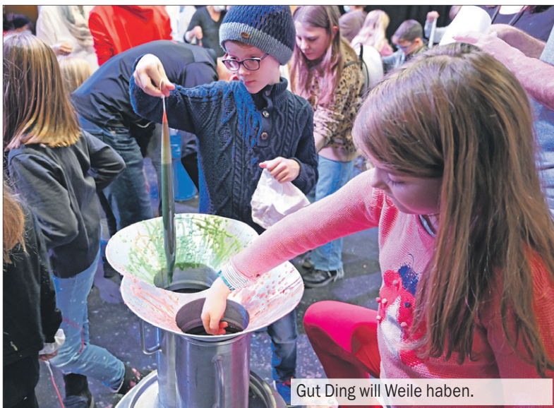
Gut Ding will Weile haben.