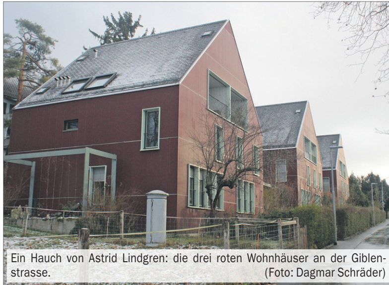
Ein Hauch von Astrid Lindgren: die drei roten Wohnhäuser an der Giblenstrasse.

In den drei Wohnhäusern befinden sich je zwei kleine 2,5 Zimmer-Wohnungen im Erdgeschoss mit Gartensitzplatz sowie zwei grössere 4,5-Zimmer-Maisonette-Wohnungen im Obergeschoss,