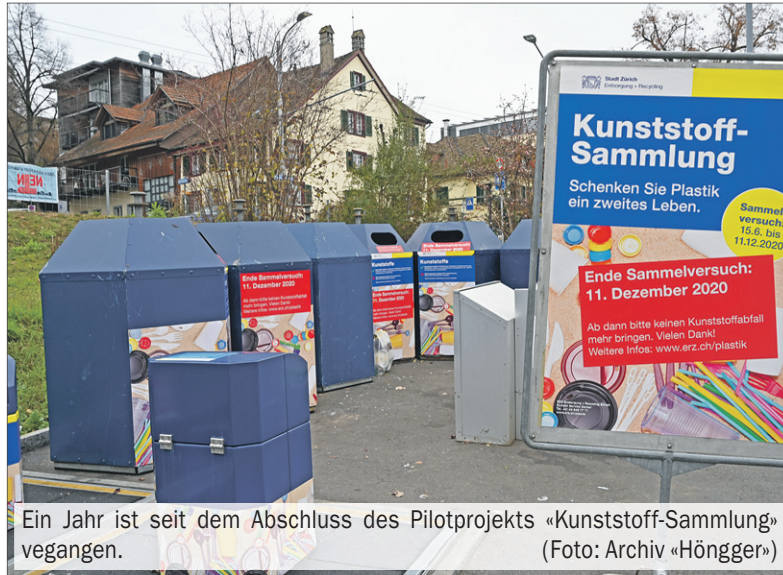
Ein Jahr ist seit dem Abschluss des Pilotprojekts «Kunststoff-Sammlung» vergangen.

Von Seiten der Bevölkerung war die Nachfrage nach der Kunststoffsammlung gross. Rund 60 Tonnen Kunststoff wurden bereits in den ersten fünf Monaten des Experiments in den beiden Quartieren gesammelt – mehr als die Stadt überhaupt bewältigen konnte. Schnell musste daher die Anzahl der Behälter an den Sammelstellen mehr als verdoppelt sowie die Abholung der Kunststoffe auf bis zu drei Touren täglich erweitert werden. Eine Herausforderung stellte dabei vor allem das Abfallvolumen dar, wie ERZ in einer Medienmitteilung im November 2020 erklärten. Langfristig gesehen würde die Bewältigung des Volumens daher nicht nur erfordern, dass der Abfall direkt vor Ort an den Sammelstellen gepresst würde, sondern auch zusätzliches Personal und Fahrzeuge notwendig machen. Eine weitere Hürde wäre die Finanzierung, so die Medienmitteilung vom November