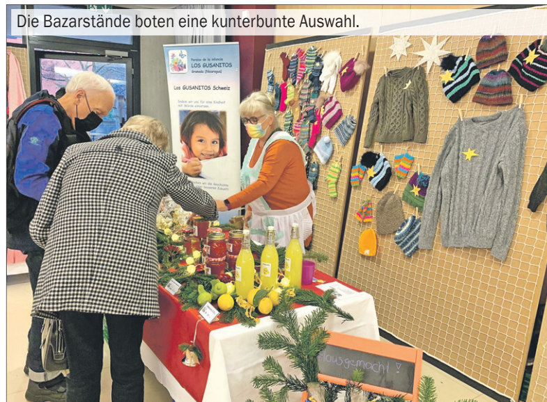
Die Bazarstände boten eine kunterbunte Auswahl.