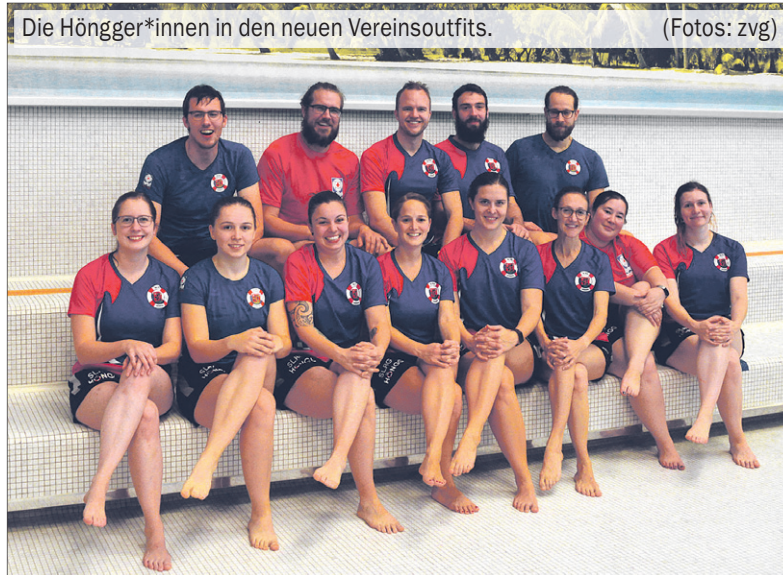
Die Höngger*innen in den neuen Vereinsoutfits.

Die Schweizermeisterschaft im Rettungsschwimmen war für die Erwachsenen dieses Jahr leider ausgefallen. Umso mehr freute man sich auf die Regionalmeisterschaft im November. Lange war aber unklar, ob sie wegen Covid wirklich stattfinden würde. Kurz vor dem Wettkampf versandte die SLRG Region Zürich nochmals einen Aufruf, dass aufgrund geringer Anmeldezahlen der Wettkampf auf der Kippe stehe und noch mehr Teams und Funktionäre gesucht werden.