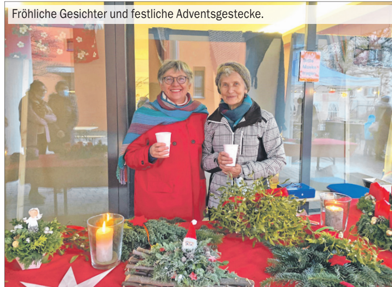
Fröhliche Gesichter und festliche Adventsgestecke.