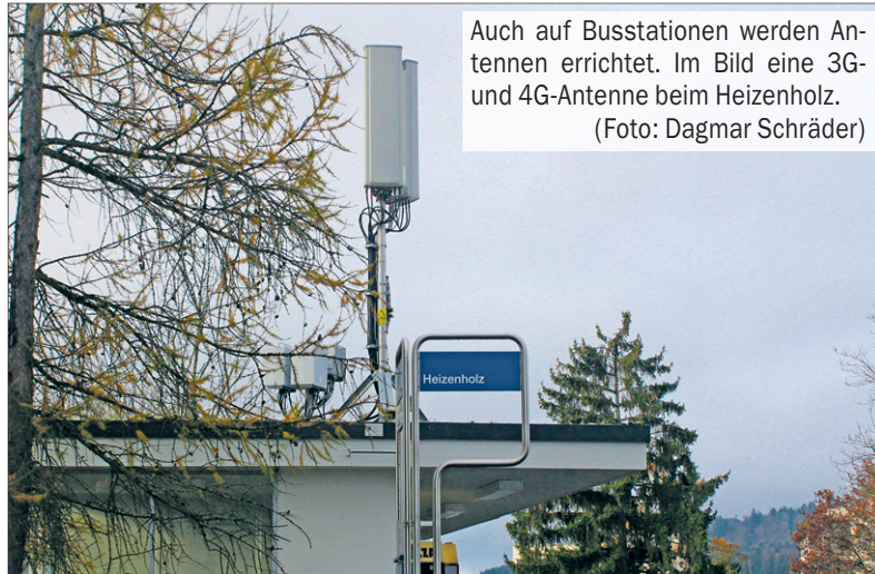
Auch auf Busstationen werden Antennen errichtet. Im Bild eine 3G- und 4G-Antenne beim Heizenholz.

Ohne Handy geht fast nichts mehr – und die genutzte Datenmenge steigt stetig an. Der Ausbau des Netzes und die Aufrüstung in punkto Leistung und Geschwindigkeit führen zu vermehrten Baueingaben für Funkantennen – ein nicht immer gern gesehenes Projekt. Auch in Höngg ist in jüngster Zeit eine vermehrte Bautätigkeit zu beobachten.