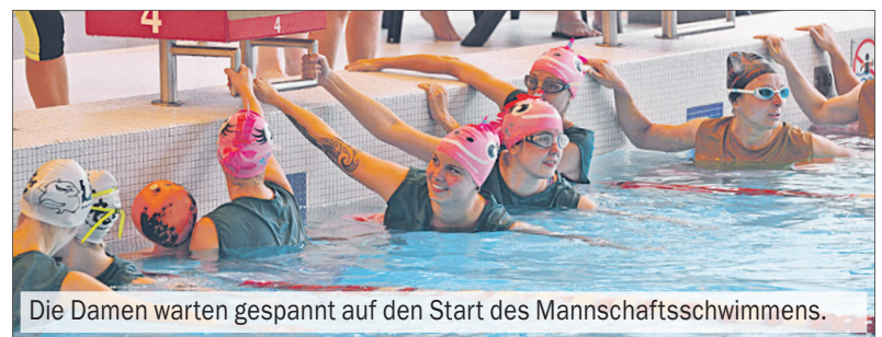
Die Damen warten gespannt auf den Start des Mannschaftsschwimmens.