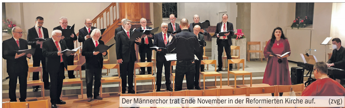
Der Männerchor trat Ende November in der Reformierten Kirche auf.

Mit nur gerade 15 Sängern veranstaltete der Männerchor Höngg am Samstagabend vor dem 1. Advent sein diesjähriges Konzert.