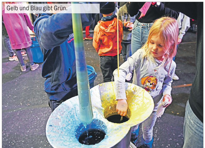
Gelb und Blau gibt Grün.