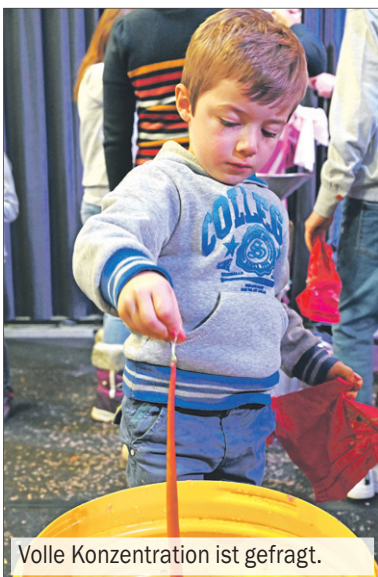
Volle Konzentration ist gefragt.