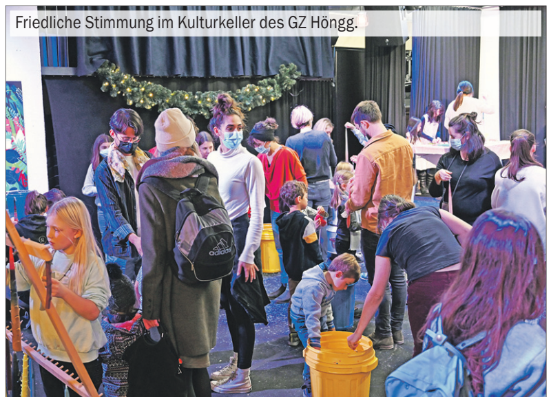
Friedliche Stimmung im Kulturkeller des GZ Höngg.