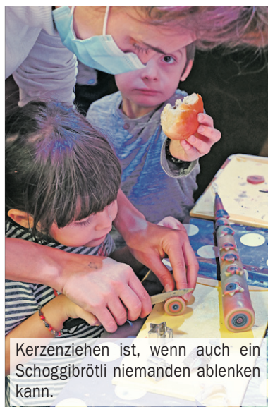
Kerzenziehen ist, wenn auch ein Schoggibrötli niemanden ablenken kann.