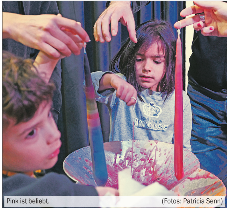
Pink ist beliebt.

Das Kerzenziehen findet noch heute und morgen, Freitag, 10. Dezember, statt. Die Bar ist an beiden Tagen ab 15 Uhr geöffnet. GZ Höngg, Limmattalstrasse 214.