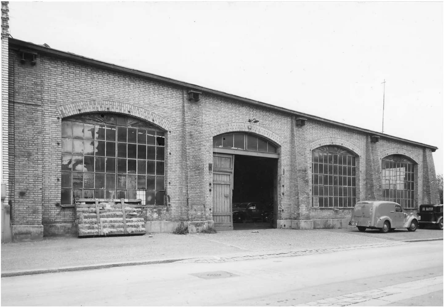
«Franz Garage» Bachstrasse 16. Erbaut 1890er Jahre. Aufnahme 1953. Baugeschichtliches Archiv Zürich.