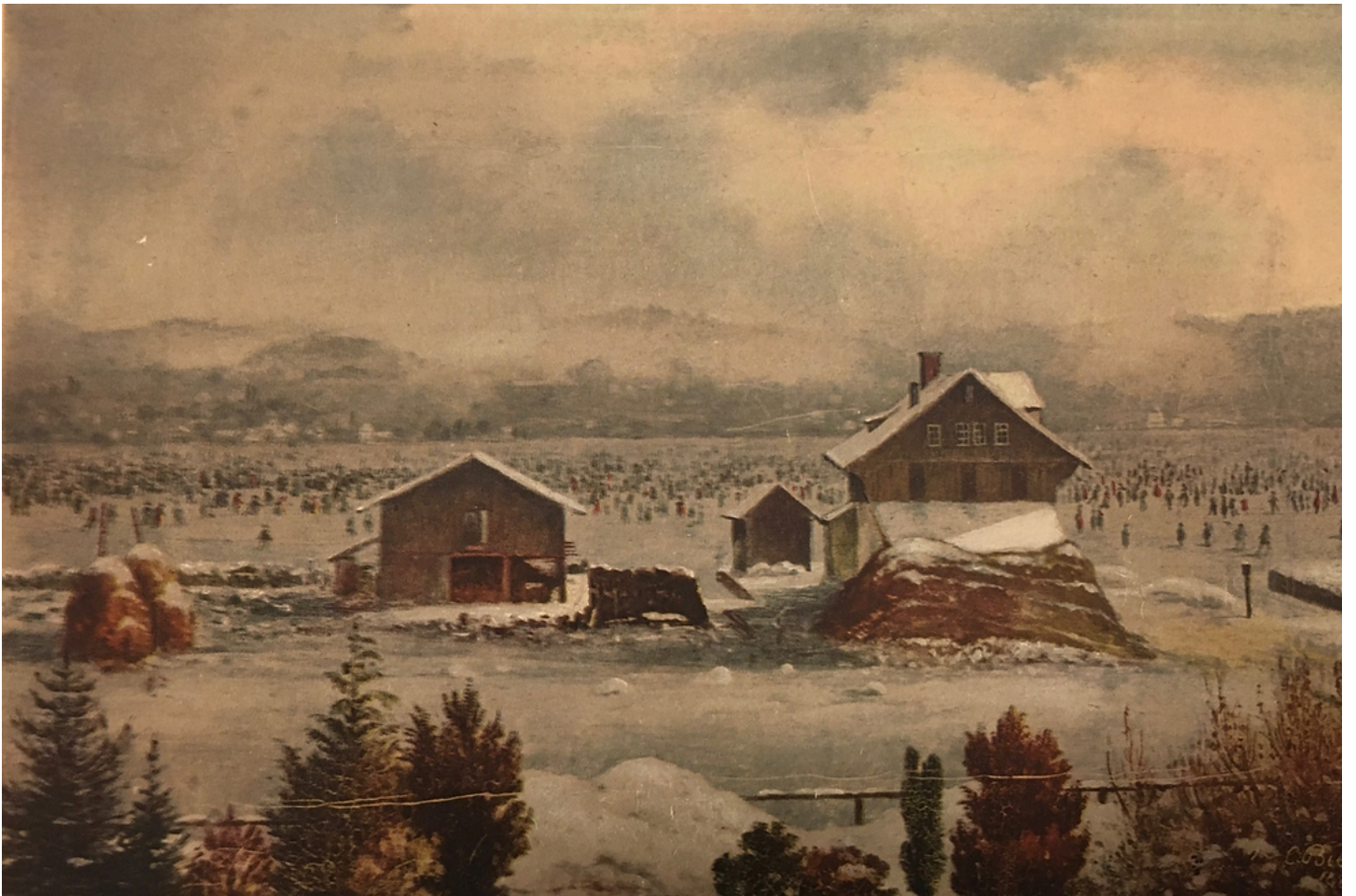
Caspar Burkhard. Die Ziegelhütte. 1880. Aus: Stauber (Tafel 24).