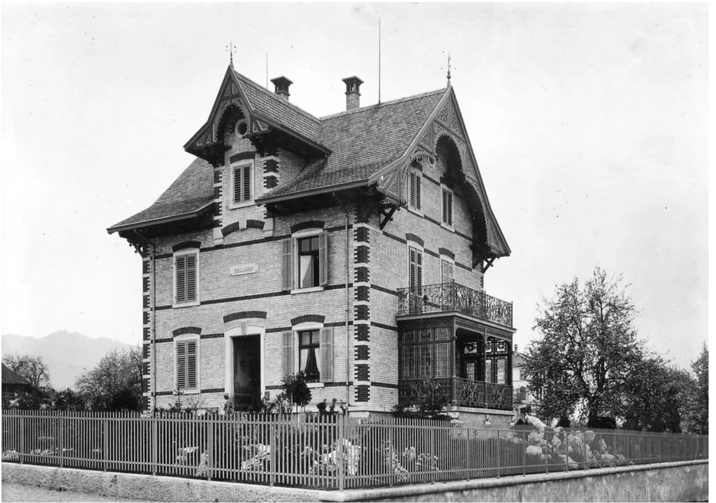
Villa Bellaria an der Zeller-/Hoffnungsstrasse (Hoffnungsstrasse 2). Baujahr 1889, abgebrochen 1959.