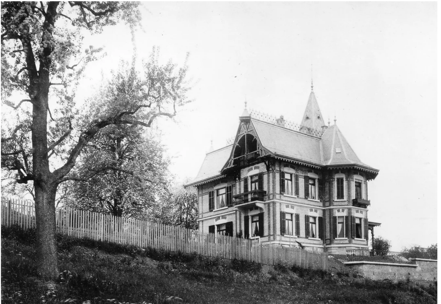
Kilchbergstrasse 65. Erbaut 1890, abgebrochen 1950. Foto: Robert Breitingen 1891. Baugeschichtliches Archiv Zürich.

Zu den verlorenen Bauten gehört inzwischen auch die Franz Garage am Mythenquai, Ecke Bachstrasse!