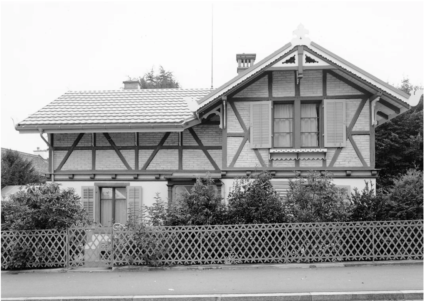
Kilchbergstrasse 49. Baujahr 1887.

Erhalten sind zudem weitere wichtige Backsteinbauten, so vor allem an der äusseren Seestrasse ein Gebäude der ehemaligen «Wöschi» (Seestrasse 463) und die ehemalige Hamol-Fabrik (Seestrasse 513) sowie – vorderhand – die ehemaligen Fabrikbauten der Firma Locher in der Manegg.