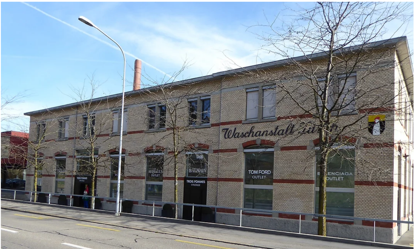
Waschanstalt Zürich, erbaut 1876, Seestrasse 463, denkmalgeschützt (2000).