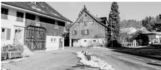
Im Rumliker Unterdorf wohnende Kinder überqueren hier die Reitenbachstrasse.

Für Kinder bis und mit 4. Klasse steht ein Schulbus zur Verfügung. Schülerinnen und Schüler ab der 5. Klasse haben den Weg per Velo auf den vorerwähnten Routen zu bewältigen.