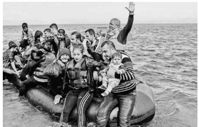
Auf solchen Booten gelangen syrische Flüchtlinge auf das Europäische Festland. Familien, die es hinüberschaffen haben noch eine lange Reise vor sich, bis sie irgendwo vielleicht ein neues Zuhause finden.

Das Café International ist eine Gemeinschaftsinitiative von Einwohnerinnen und Einwohnern und der reformierten Kirche Russikon. An Mitarbeit Interessierte sind jederzeit herzlich willkommen!