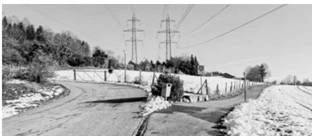
Die empfohlene Veloroute führt über die Kilchacherstrasse zum Rumlikerweg.