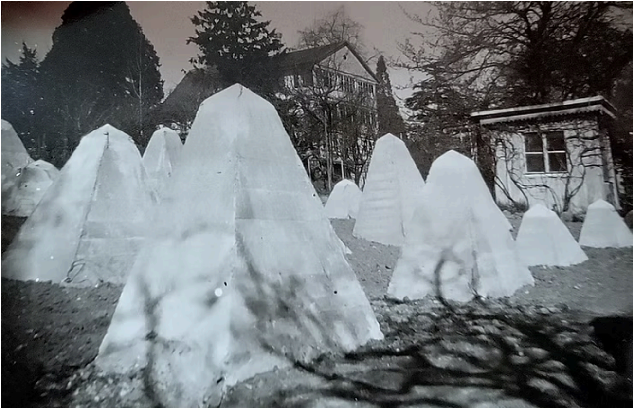
Panzersperren im Garten (um 1940), Fotoalbum Familie Thomas-Wyss.

Nach dem Kriegsende gab es noch andere Probleme: die Panzersperren. Schon die Generäle Napoleons wussten, dass man den Durchgang von Truppen in Wollishofen relativ leicht blockieren konnte. Auch im Ersten und Zweiten Weltkrieg wurden hier deshalb Sperren errichtet. Man vergleiche auch den Blog-Beitrag WOLLISHOFER RIEGEL . Die Sperren im Garten des Cedernheims wurden 1948 beseitigt.