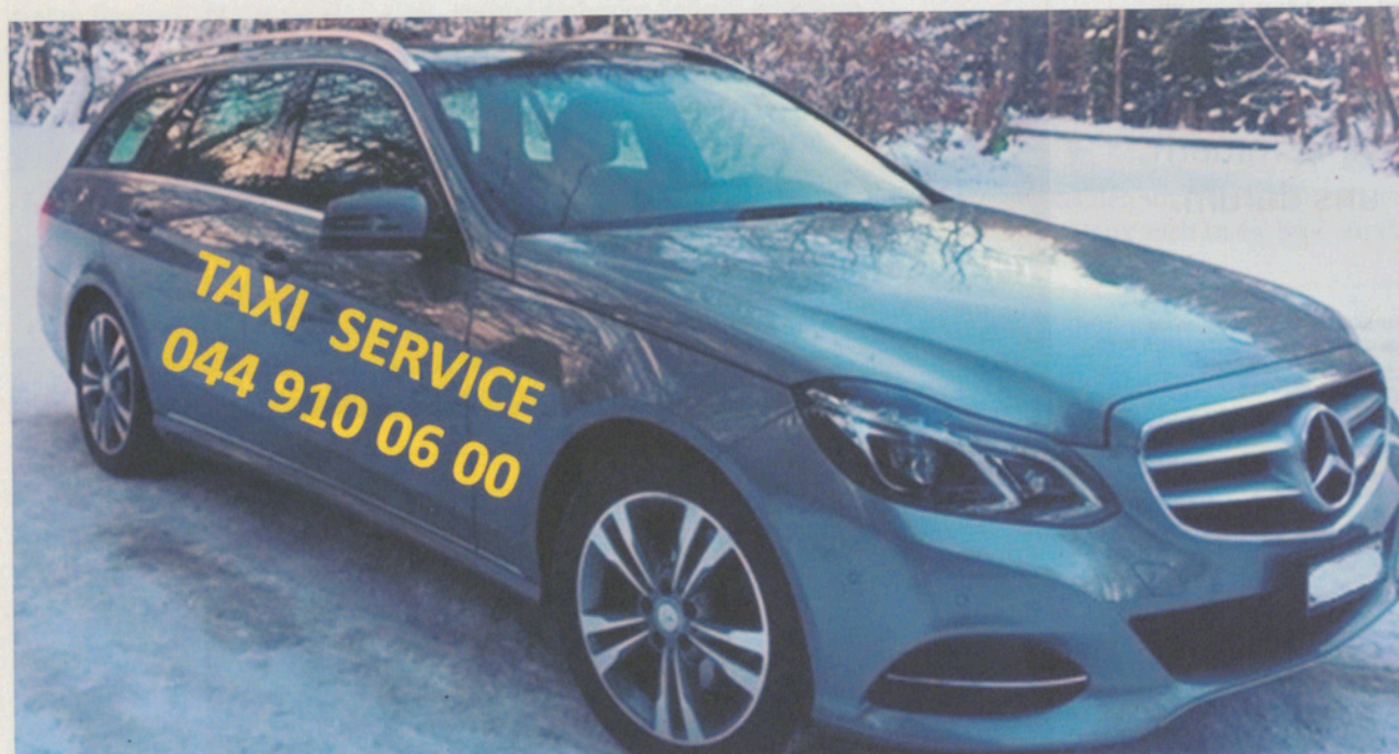
Das Ruftaxi verkehrt zu fixen Betriebszeiten von Maur nach Scheuren, hält aber nicht an allen Haltestellen.