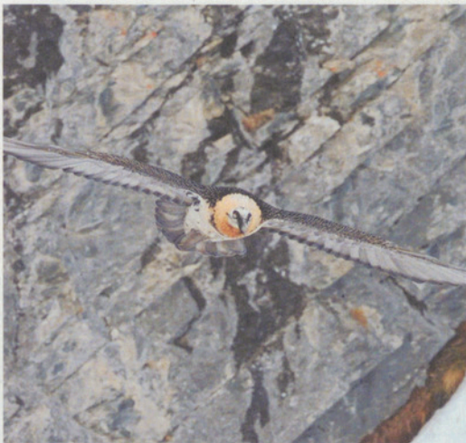
Der Bartgeier ist wieder in den Alpen anzutreffen.