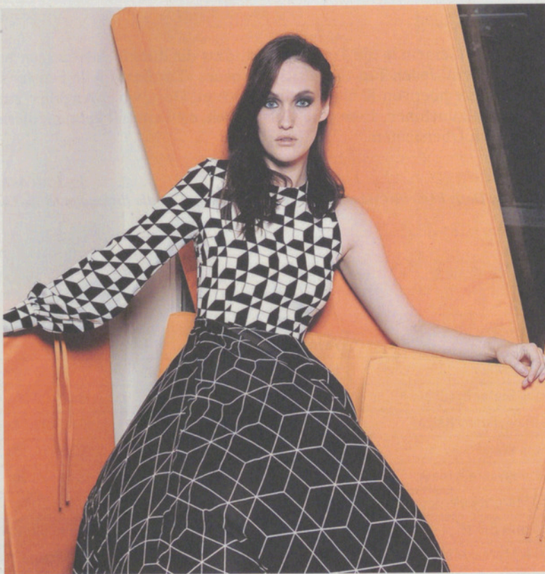
Ausblick auf den nächsten Frühling/Sommer: Mode von Mourjjan.