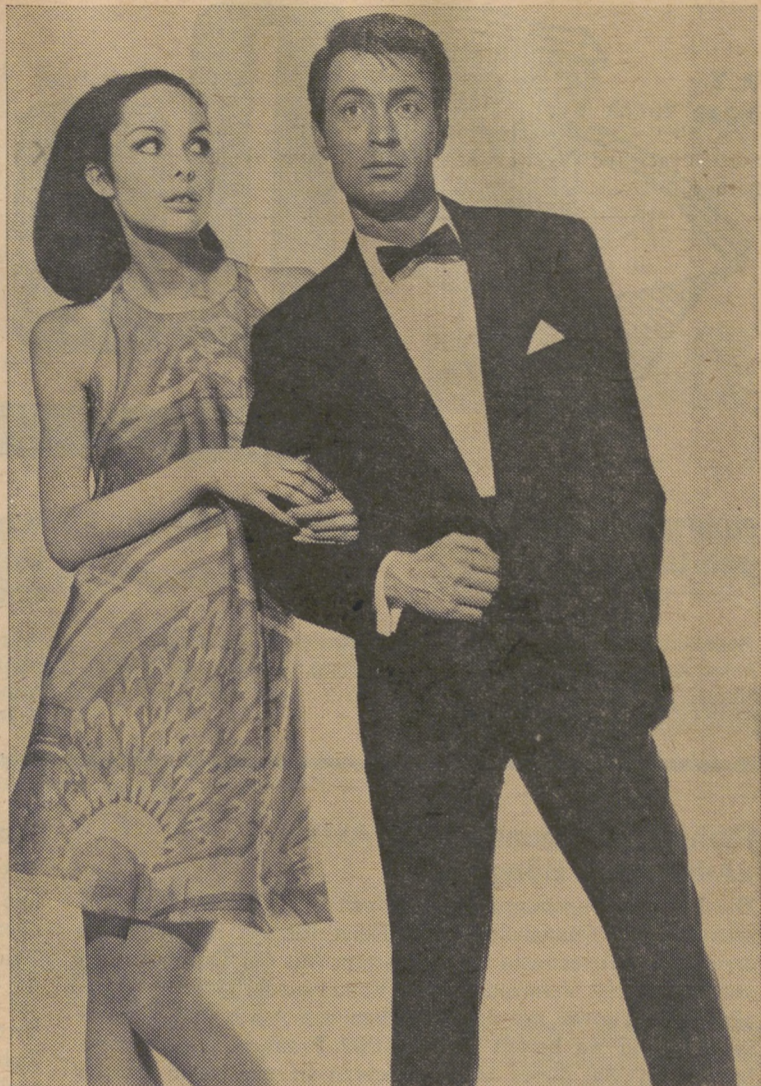
Dieser elegante, leicht taillierte Smoking ist mitternachtsblau und aus einem Mohair—Wolle Gewebe, der Shawlkragen aus reiner Seide. Dazu werden Fliege und Kummerbund aus dem selben Stoff getragen. Modell PKZ Burger-Kehl

Die feingeschnittene Zwiebel in der Butter dünsten, das Mehl dazugeben und mit der Milch zu einer sämigen Sauce kochen,