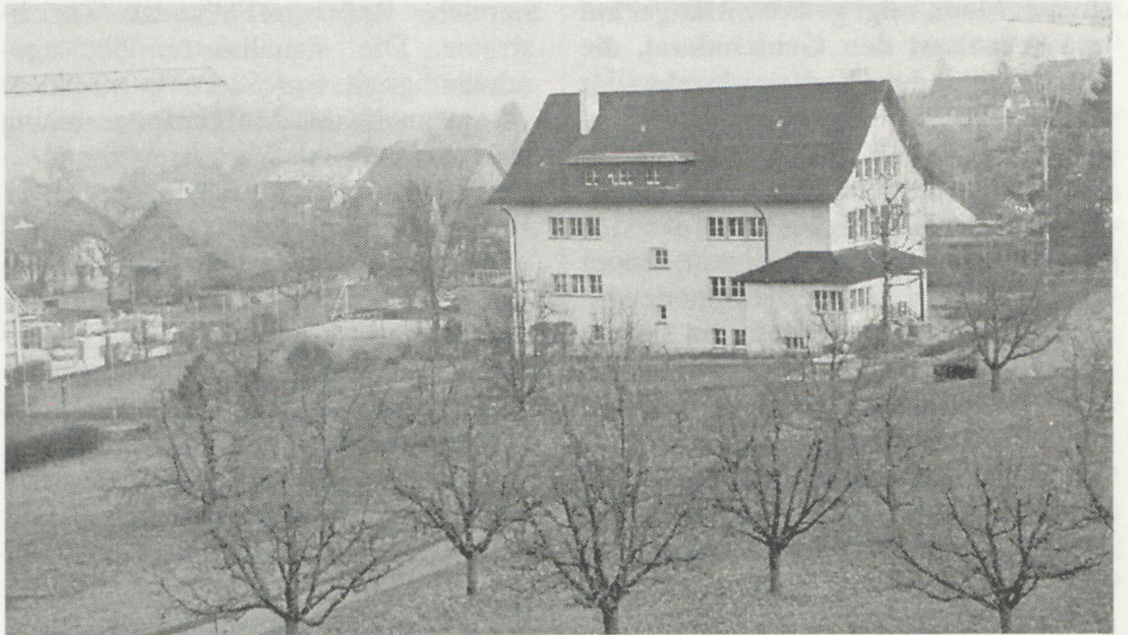
Direkt neben dem Püntschulhaus kann die Schulgemeinde Reserveland erwerben.

Die Bauabrechnung für die erste Etappe des Umbaus im Saaltrakt Looren mit einer Kostenunterschreitung von 23 362 Franken und der Ausbau der Kläranlage mit einem Kostenanteil von 220 320 Franken wurden einstimmig gutgeheissen. Die Vorschläge des Gemeinderates von sieben Mitgliedern für das kantonale