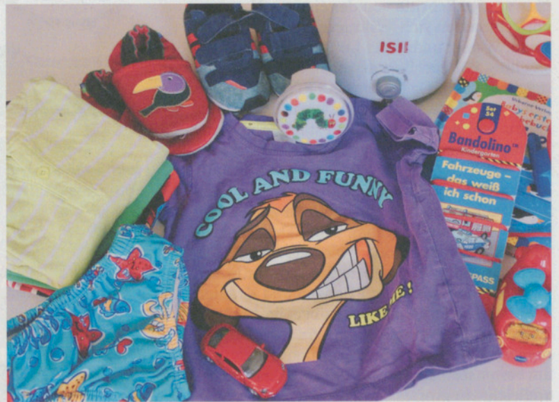
An der Börse findet man allerlei gut erhaltene Kindersachen.

Und falls es in der Gemeinde noch fleissige Helferinnen und Hel-