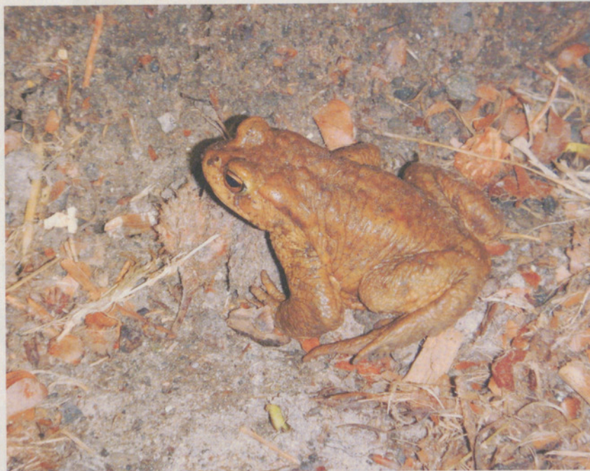
Lebt gern im Verborgenen: die Erdkröte.

«Für mich als Tierärztin sind Krankheiten ein Lieblingsthema», sagte Lohmann scherzhaft. Denn Viren und Bakterien könnten ganze Populationen dezimieren. Ein Pilz, eingeschleppt