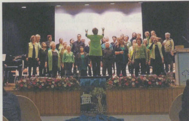
Gottesdienst mit Chor «Do Lord Gospel Power Maur».