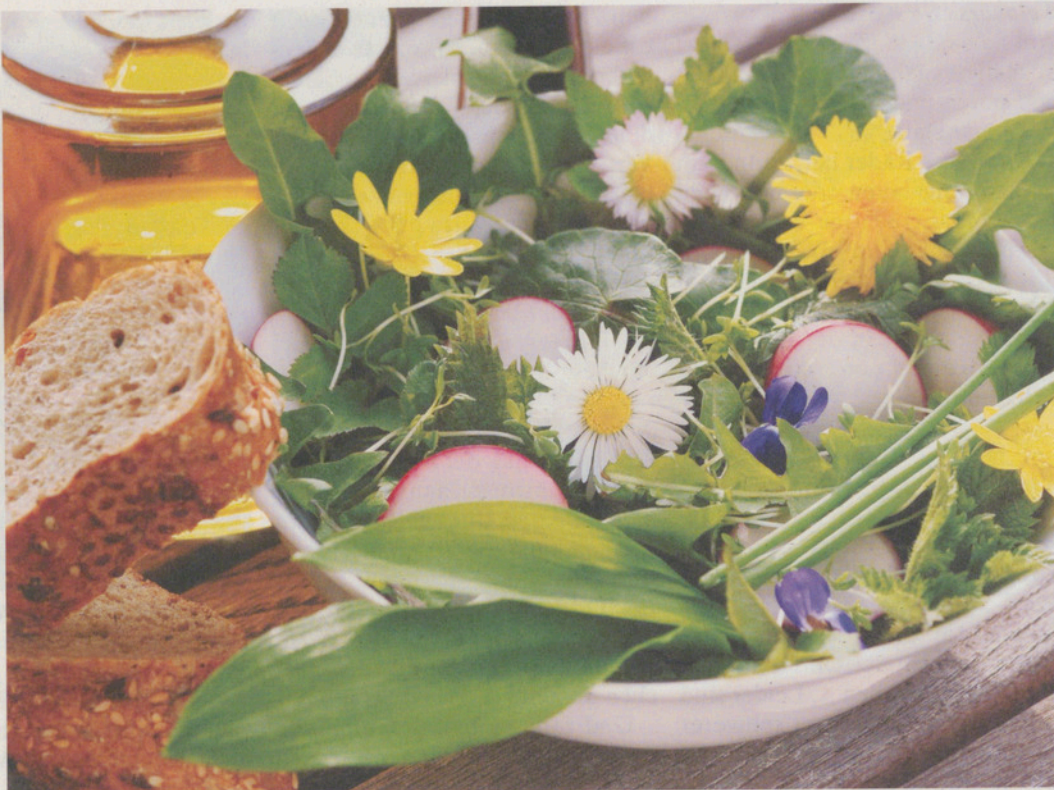
Essbare Wildkräuter – auf Spaziergängen kann man die «Natur vor unserer Haustüre» erkunden und kennenlernen.