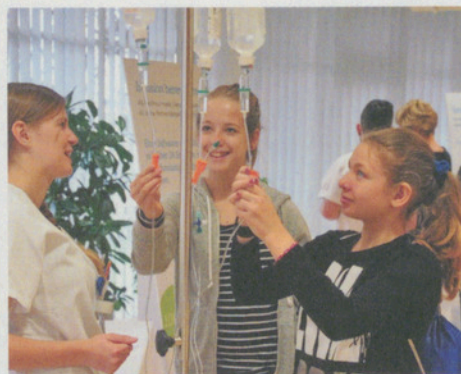
Einblick in die Arbeitswelt des Spitals.

Sie stehen vor der Berufswahl? Oder Sie denken über einen Quereinstieg nach? Dann besuchen Sie am Samstag, 25. März, den Infotag Gesundheitsberufe im Spital Uster.