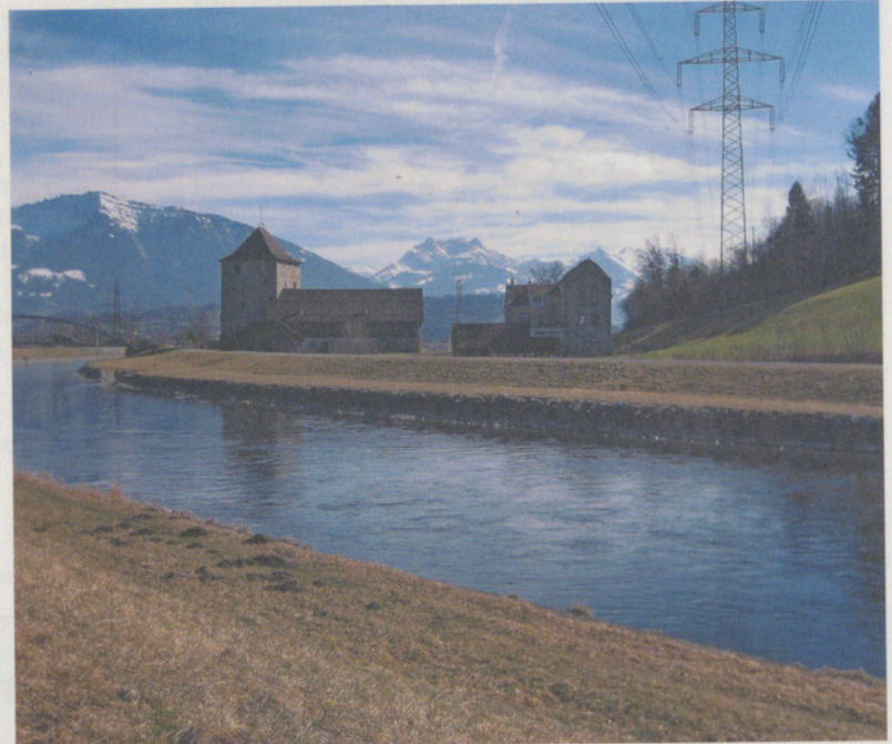
Wandern entlang dem Linthkanal.