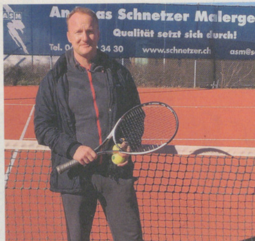
Spielen auf den neuen Plätzen auf der Looren.