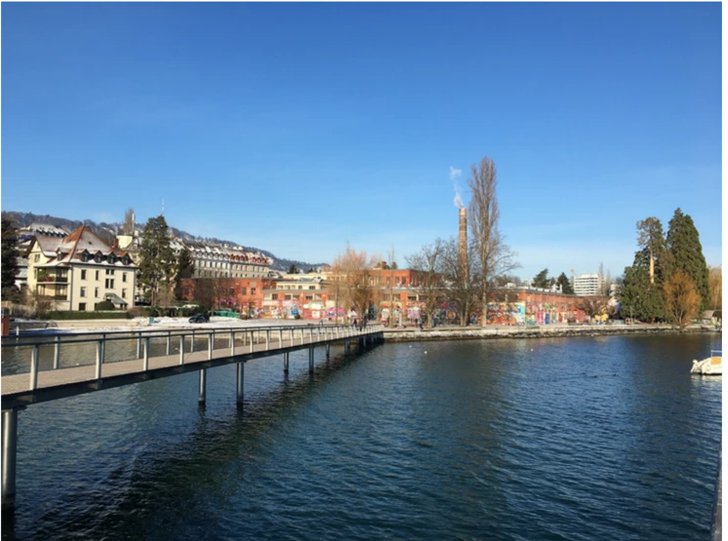
Rote Fabrik vom See aus.

Und was geschah mit der Roten Fabrik nach Auszug der Seidenzettlerinnen? Tempora mutantur! Die Zeiten ändern sich. Nach der Seide kam das Telefon in die Rote Fabrik. Ab 1935 mietete die Firma «Standard Telephon und Radio AG»(STR) sukzessive mehr Flächen auf dem Gelände und übernahm 1940 alle Gebäude. 1972 zügelte die STR nach Wiedikon, es kam zu einem Landabtausch mit der Stadt Zürich. Die Geschichte seither wurde zu Beginn des Blogs skizziert. – Die Rote Fabrik ist zwar nicht im Zentrum des Quartiers, gleichwohl heute die wohl bekannteste «Marke» Wollishofens.