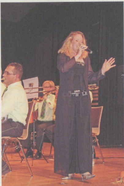
Spielt die Brass Band Maur, ist gute Unterhaltung Programm!