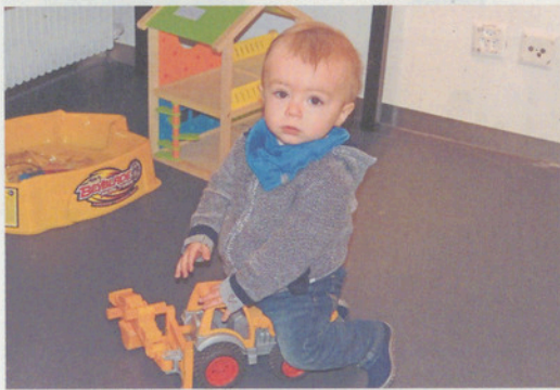
So viel Schönes an der Kindersachenbörse!