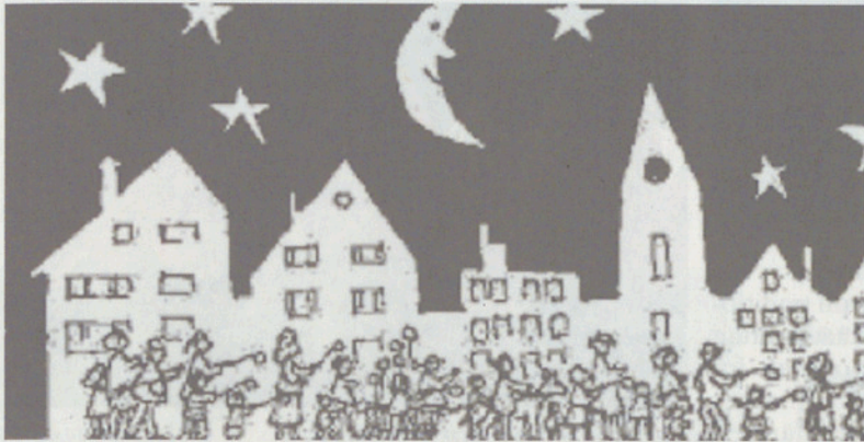
Der Umzug, eine vorweihnachtliche Tradition.