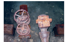
Grundwasseraufstoss Ursprung vor der Sanierung