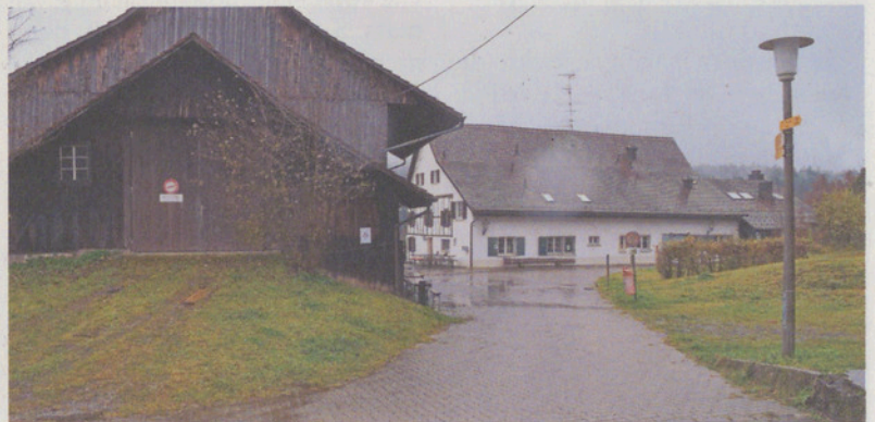
Die SVP Maur sagt Ja zum privaten Gestaltungsplan «Hinter Guldenen».