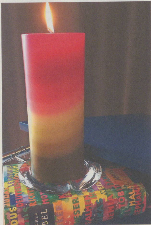
Zürcher Bibel und Weizenkorn-Kerze