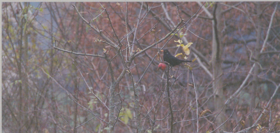
Der letzte Apfel am Bäumchen gehört der Amsel!