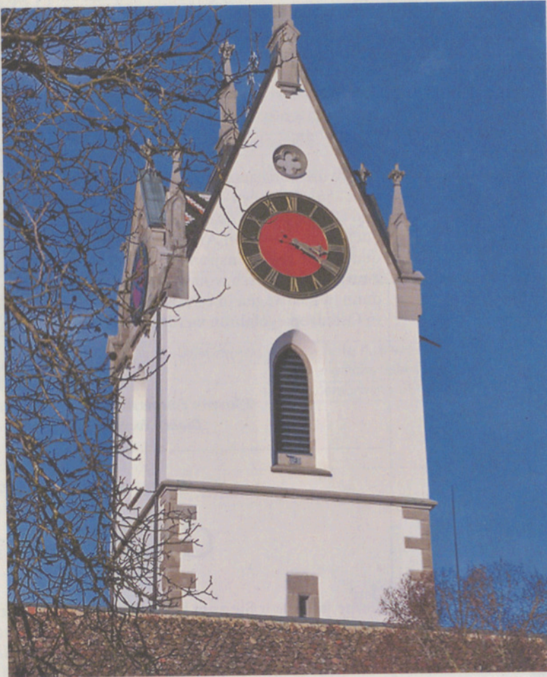
Stolze 505 Jahre alt und frisch herausgeputzt: Der Kirchturm Maur.

Nicht nur sie, sondern auch die Handwerker reagierten alle höchst flexibel auf überraschende Herausforderungen und Mehrarbeiten. So zeigten sich Schäden am Steinwerk, welche vorher nicht zu erkennen waren. Diese Überraschung bedeutete beispielsweise für die Steinmetze der Firma Kuster aus Bäch, dass sie innerhalb