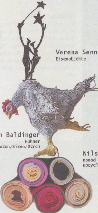
Verena Senn Eisenobjekte