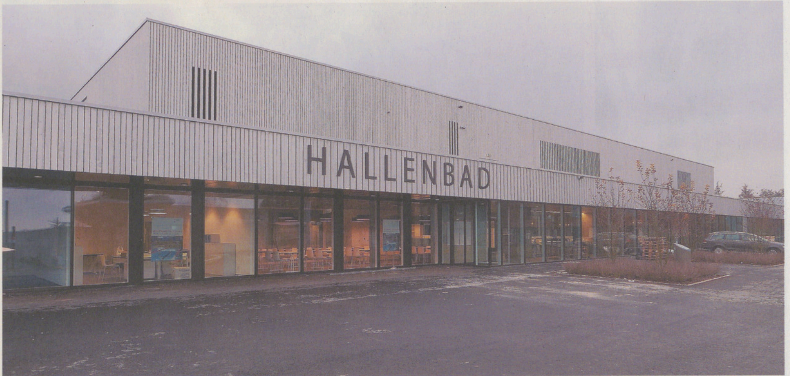
Das grosse Bad ist eine Attraktion in der Region – davon profitieren auch die Maurmer.