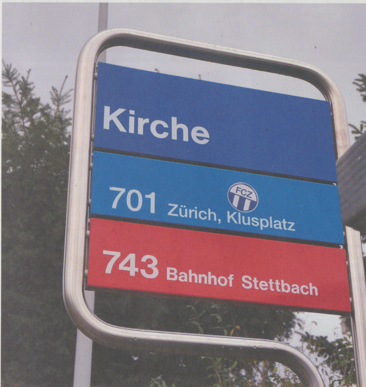
Die Buslinien 701 und 743 gelten zwar als «eher ruhig», bleiben aber auch nicht ohne Vorfälle.