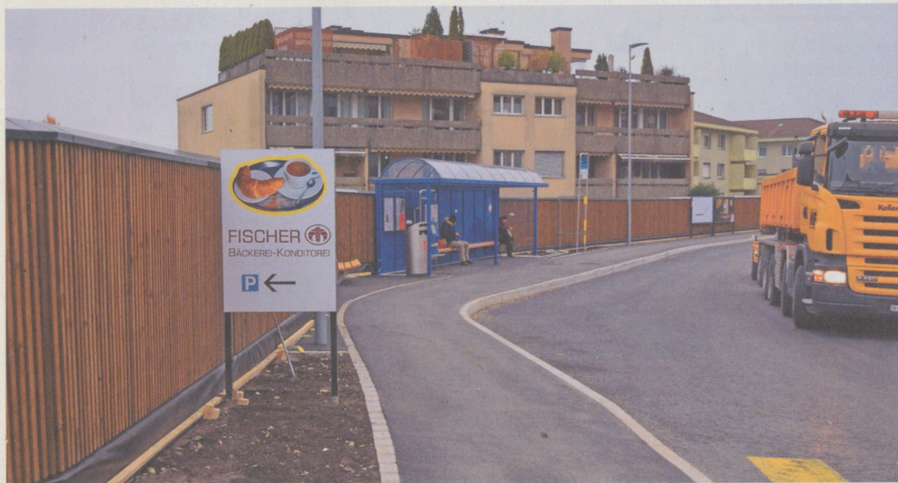
Neue Haltestelle und Lärmschutzwände bei der Bushaltestelle «Dorf».