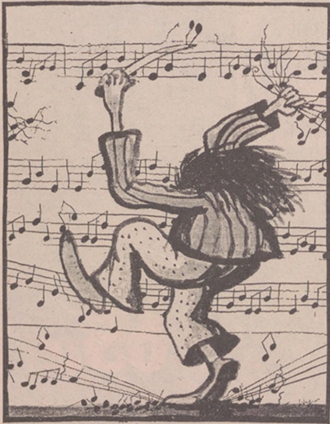
Das von Tomi Ungerer gestaltete Festival-Plakat.

An der gleichen Wand und an vielen andern im Quartier steht ein A in einem Kreis. Steht das A für Autonomie, so würde es Verantwortung voraussetzen, Verantwortung für sich selbst und für andere. Es könnte aber auch für Anarchie stehen und wenn man die vielen Beschädigungen überall betrachtet, dann neigt man zu dieser Deutung. Oder steht es ganz einfach für Affen, die von ihrem Baum noch nicht herunter sind? Da fiel mir