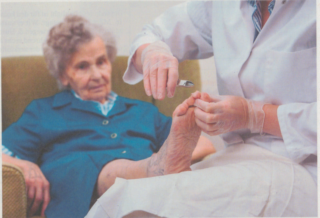
Im Alter fällt es schwer, die Fusspflege alleine durchzuführen.

Wer durch das Alter oder wegen schwacher Augen seine Füße nicht mehr bis ins letzte Detail