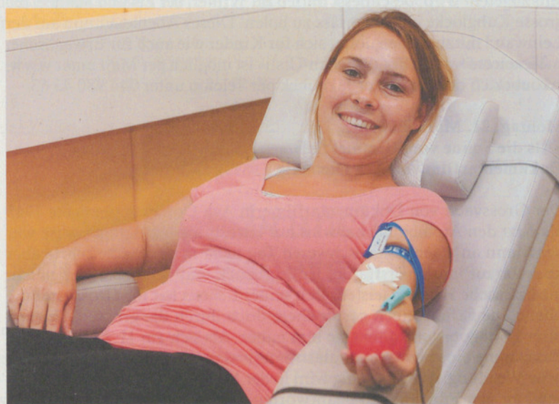
Blut spenden: einfach, aber effektiv.