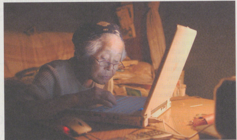
Zwei unterschiedliche Werke: Heimatfilm «Schellen-Ursli» (oben) und der Dokumentarfilm «Als die Sonne vom Himmel fiel».