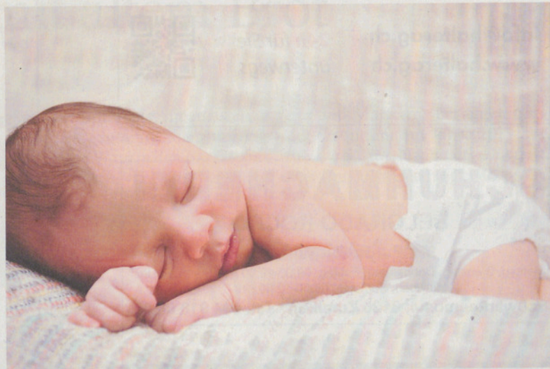
Für Eltern unvergesslich: die Geburt des eigenen Kindes.