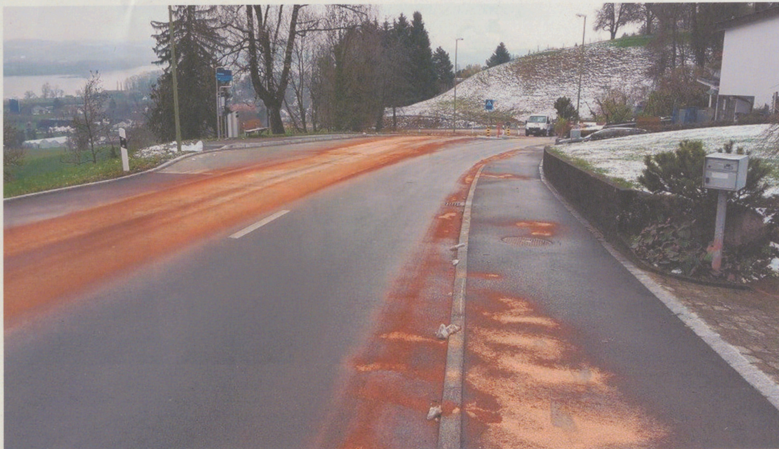
Die Ölspur entlang der Zürichstrasse war wegen des Bindemittels auffällig rot gefärbt.