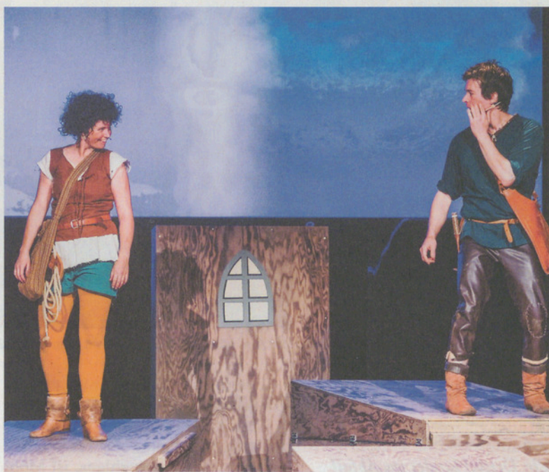
Ronja Räubertochter ist mutig, schlau und neugierig.; ihr Freund Birk gehört zur verfeindeten Räuberbande.

Für Kinder ab 5 Jahren Dauer ca. 70 Minuten, keine Pause