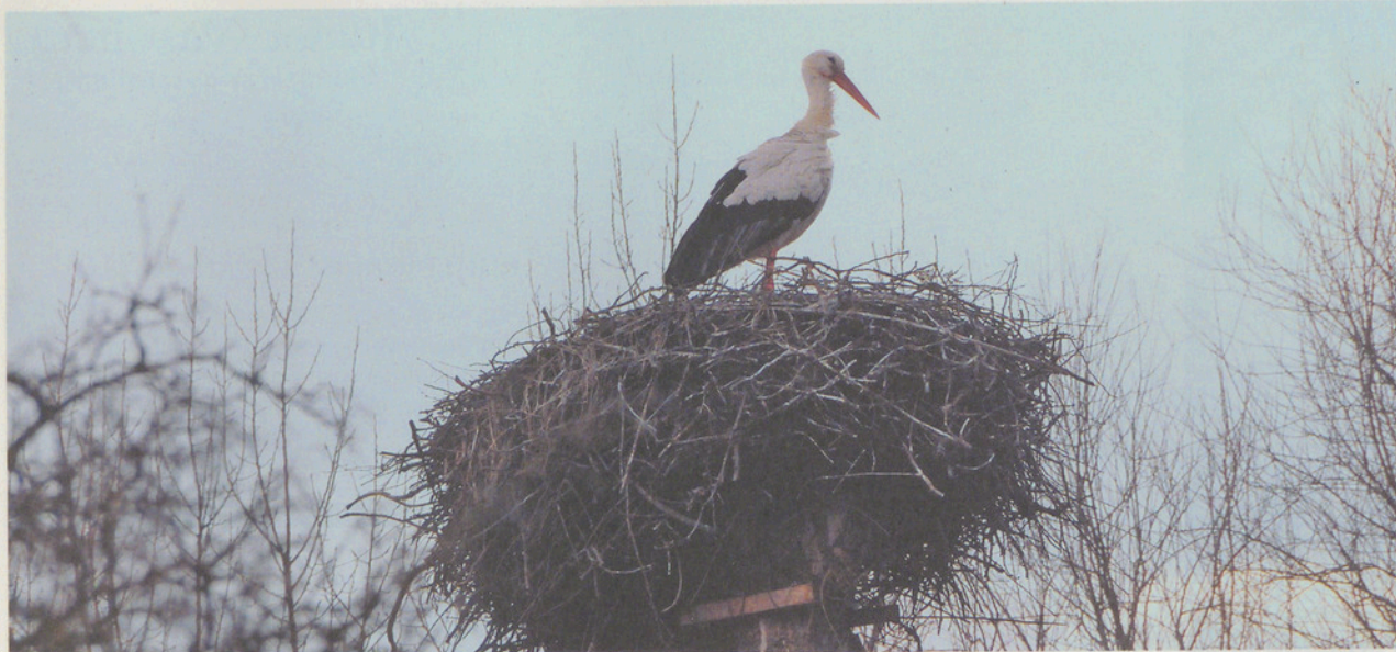
Der Maurmer Storch im Nest bei der Schiffflände in Maur.