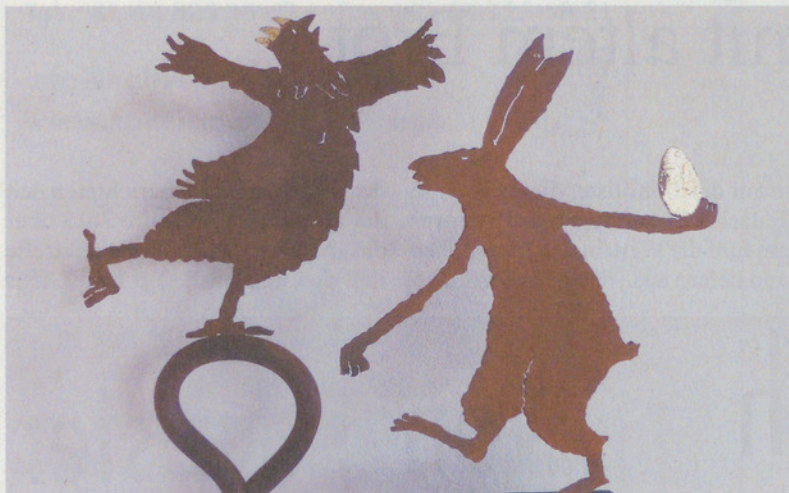
Kunst von Verena Senn.