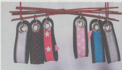
So sehen die Anhänger aus ( www.urn-online.ch ).