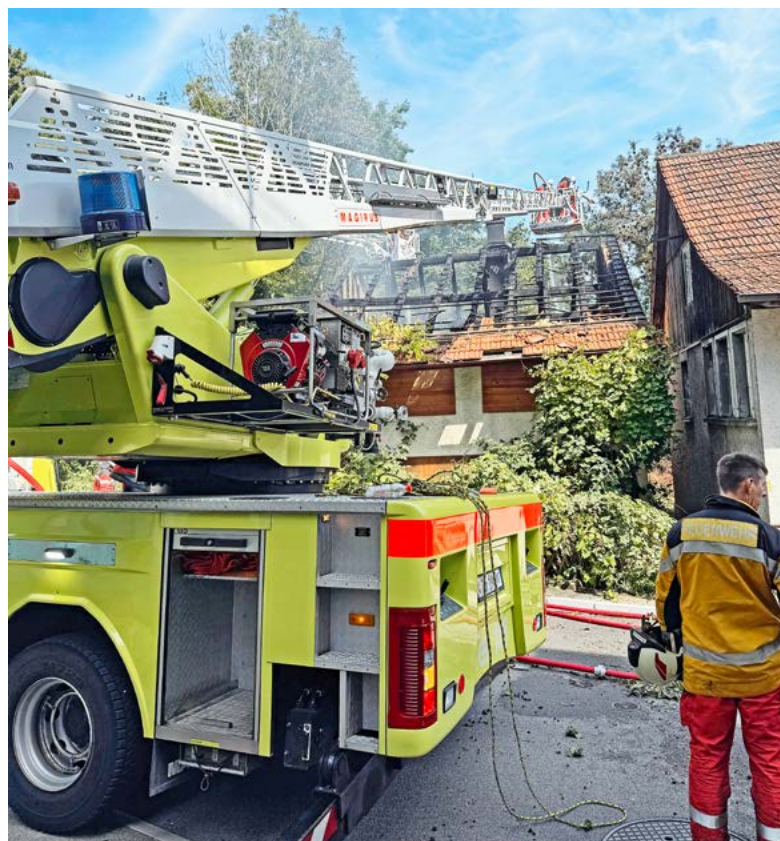
Das Nachbarhaus steht extrem nahe, nur einen Meter entfernt.