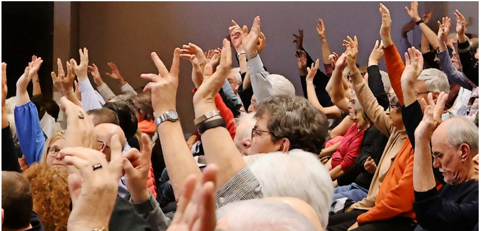
Traumhafte Wahlbeteiligung bei der Gemeindeversammlung vom 8. Dezember.