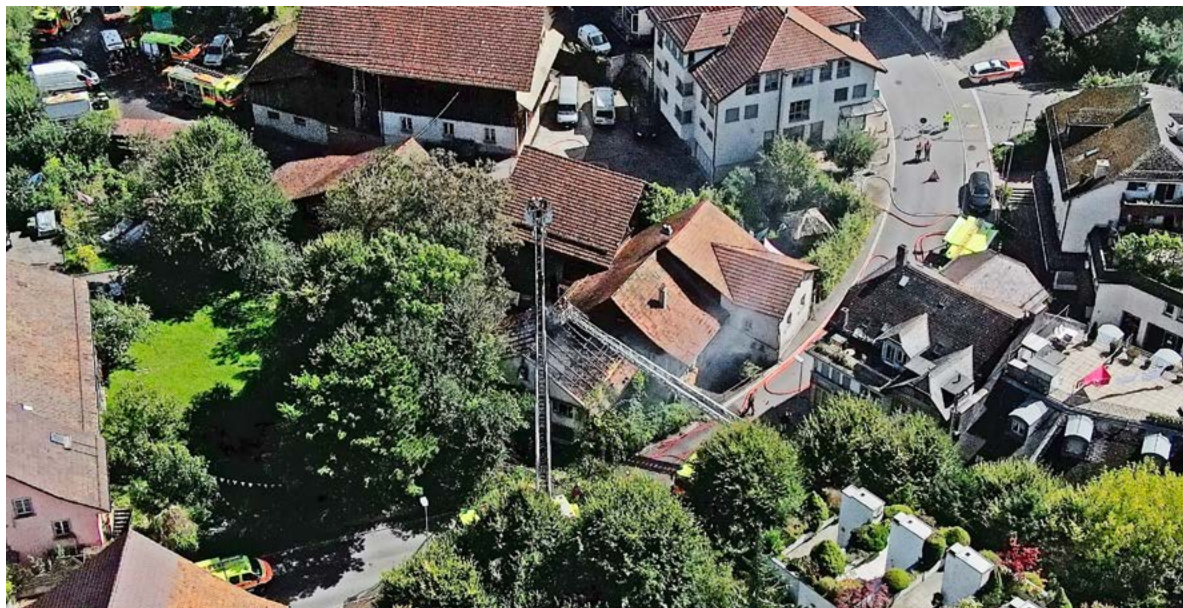
Von allen nur möglichen Seiten her wird gelöscht.