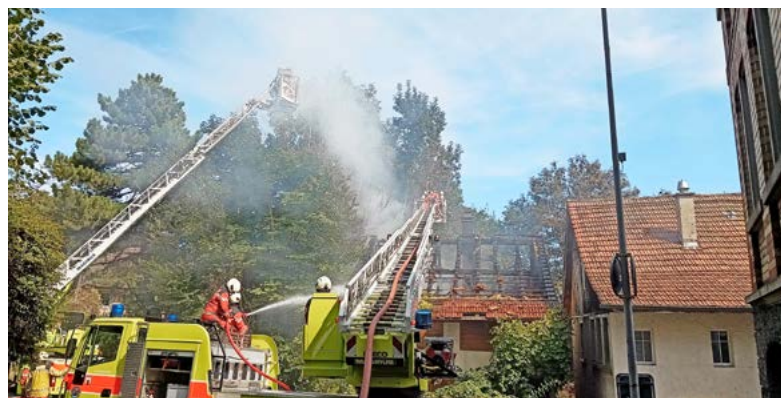
Mit beiden ADL-Fahrzeugen am Löschen.

Nach kurzer Überlegung beschliesse ich als Einsatzleiter, dass wir keine Drohne brauchen. Mit dem Aufge-