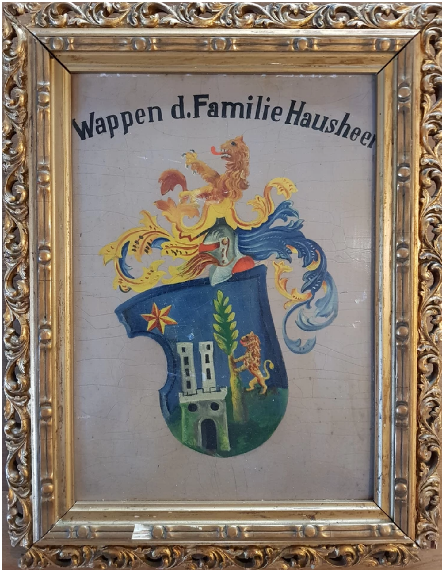
Familienwappen Hausheer. In Wollishofer Privatbesitz. ***