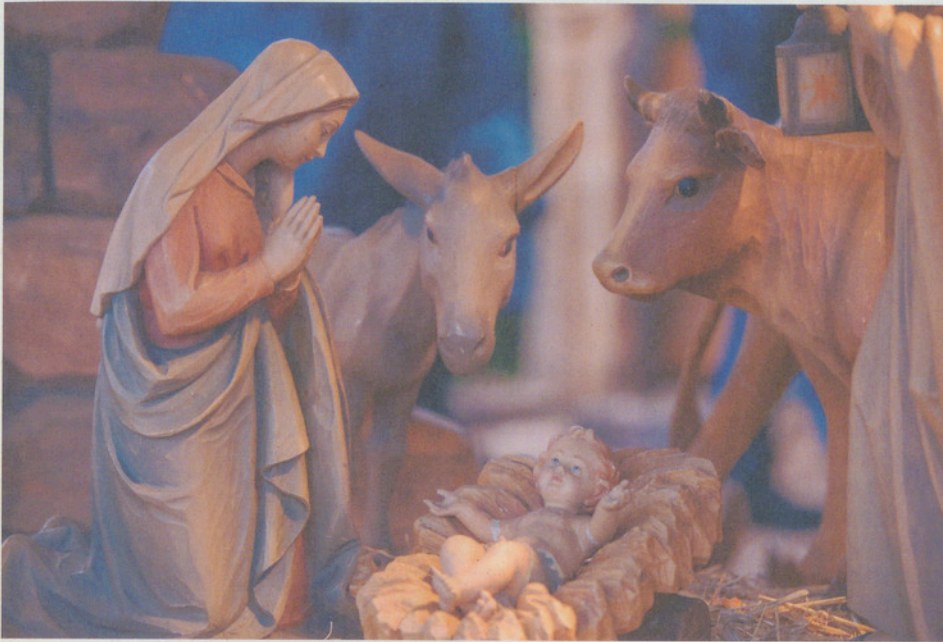
Ulrich Knellwolf zeigt, dass die Weihnachtsgeschichte unterschiedlich erzählt werden kann.