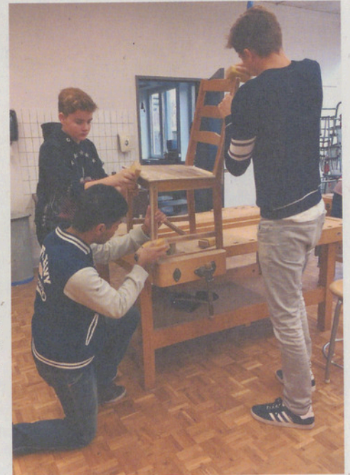
Schüler der Schule Looren Stuhlverwandler bei der Arbeit.

Die Auktion findet am 1. Dezember 2016 um 19 Uhr im Polterkeller der Schule Looren statt.