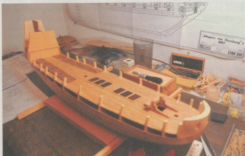
Der Rumpf der «Wappen von Hamburg», an der Wand hängt der Bauplan.

Ausgehend von der ausserordentlichen Geduld, die er mit dem Bau von Schiffsmoellen gewonnen hat, kann man davon ausgehen, dass er sowohl die «Wappen von Hamburg» wie auch den Steingarten in absehbarer Zeit fertigstellen wird.