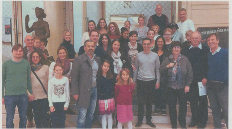
Die Besucher genossen die Führung.