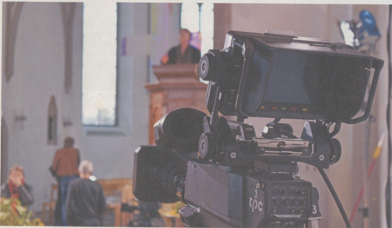
Die Kameras des Schweizer Fernsehens sind auf die Kanzel im Scheinwerferlicht gerichtet.