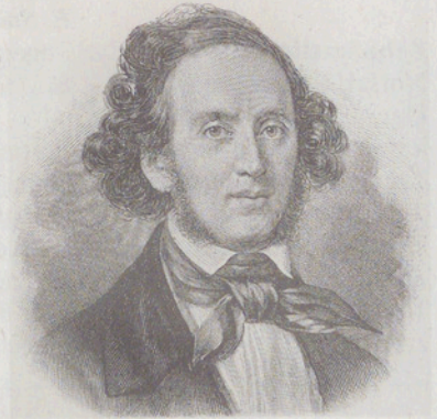
Felix Mendelssohn Bartholdy.