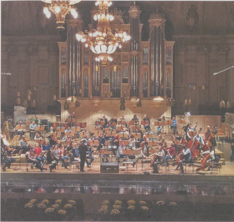
Das Tonhalle-Orchester an der Generalprobe.