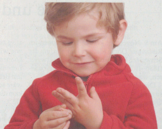
«... und de chli isst all eile!»