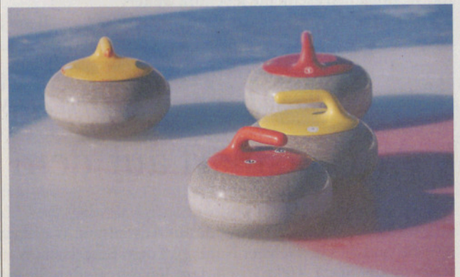
Curling kostenlos ausprobieren!