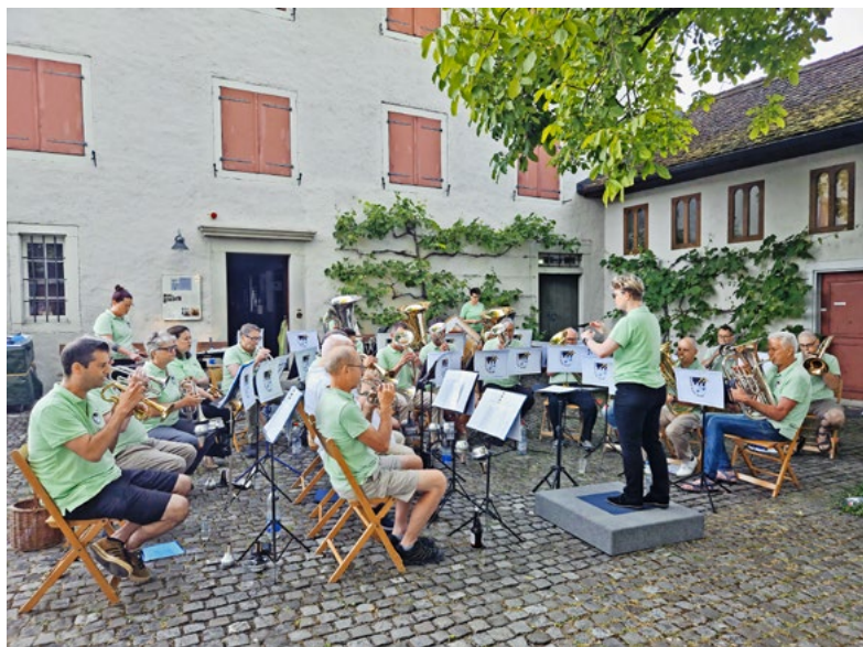
Fetzige Klänge im Burghof.

Text: Urs Bräker, Präsident Brass Band Maur