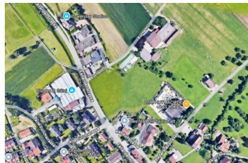
Die grüne Wiese in der Bildmitte wird überbaut werden.

Die Zufahrt zum Grundstück erfolgt via Fällandenstrasse über den Buchenhof-Weg, der für diesen Zweck verbreitert wird. Unschönes Detail an der Sache, wie auch Thomas Frauenfelder einräumte, ist der Umstand, dass Traktoren, Lastwagen und PW dabei den Veloweg kreuzen müssen. Bei den zahlreichen Velofah-