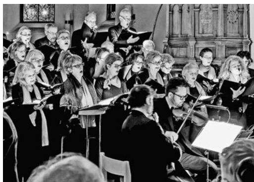
Konzert im Jahr 2024 in der Kirche Maur.

Es ist an der Zeit, den neuen Veranstaltungskalender der Gemeinde aufzuhängen. Sei es an einer Kastentüre oder am Kühlschrank, dieser analoge Kalender wird bestimmt immer noch rege benutzt. Aber just im Jubiläumsjahr – 60 Jahre Singkreis Maur – ging das Datum des Jahreskonzertes unter.