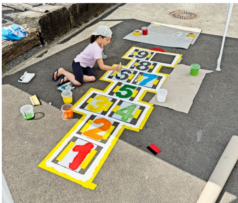
25 Liter Farbe wurde in allen Farben des Regenbogens vermalt.

Grosses Projekt des SchüRa und des Elternrats Aesch, es war ein fröhliches Miteinander von Gross und Klein.