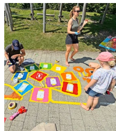
Mehr als 60 Eltern malten mit.

Sogar die heissen Temperaturen von über 30 Grad hielten niemanden davon ab mitzumachen. Und so malten am Samstag und Sonntag, 21. und 22. Juni, über 60 Eltern, Grosseltern, Göttis und mehr als 80 Kinder, es machten sogar ganze Familien mit, und auch die Lehrpersonen und die Schulleiterin waren das ganze Wochenende im vollen Einsatz. So wurde der Pausenplatz farbig und farbiger, es entstanden Hüpfspiele, Leiterspiele, Schachfelder und vieles mehr. Zum Schutz vor