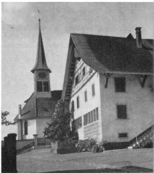
Pfarrreinsatz, Oktober 1919

Eine Ehrenpforte stand wiederum beim Pfarrhaus mit dem Spruch: