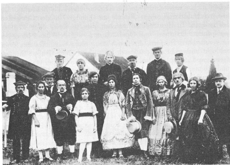
«Am Allerseelentag» Foto: J. Bersinger, 15. Januar 1928

Der starre Sinn des reichen Vaters verhinderte das Glück der Liebenden, der junge Mann starb an Liebesgram. Im letzten Akt zeigte sich das offene Grab. Beim Klang der Totenglocke (der Moment fiel jeweils just mit dem Betzeitläuten der nahen Kirche Volketswil zusammen) konnte eine allgemeine Ergriffenheit nicht ausbleiben, die sich im Aufklappen ungezählter Handtäschchen und im Hochheben ebenso vieler Nastüchlein deutlich genug offenbarte!