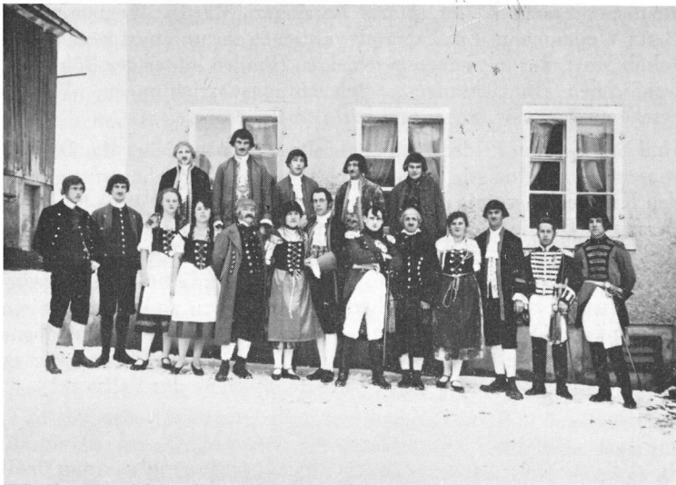
«Die Rose vom Thurfeld» Foto: J. Bersinger, 1931

Natürlich fehlt es auch nicht an Liebes- und Eifersuchtszenen. Am Schluss finden die beiden Hauptgestalten, der Vogt Adelhart von Straussberg und der Senne Walter Hunn im Zweikampf den Tod. Die gehobene dichterische Sprache und der bedeutende Inhalt gaben der Aufführung ein besonderes Gepräge. Als eindrucklichste Szene blieb wohl manchem Zuschauer der Endkampf und der Tod des Landvogtes (Gottl. Schneebeli jun.) bleibend im Gedächtnis haften.