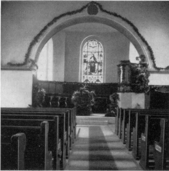
Festlich geschmückte Kirche Volketswil, 12. Oktober 1919